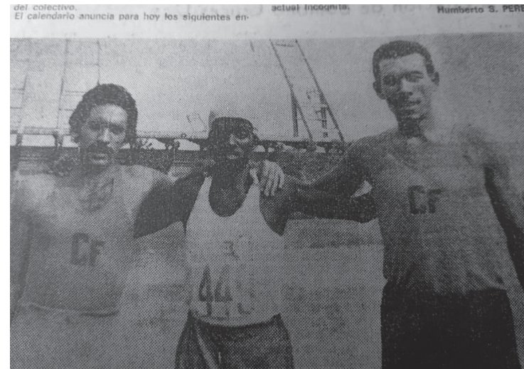
Deportista de alto rendimiento que conquistara títulos para Cuba.

los 42 kilómetros y logré el mejor tercer tiempo de Cuba, 2 horas y 29 minutos.