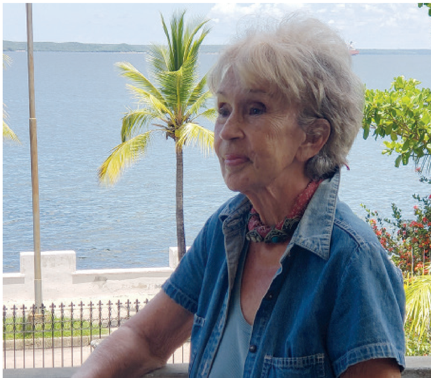
La destacada escritora y teatrera cienfueguera rememora cuando aquella noche del 30 de noviembre de 2016 vio pasar frente a la verja de la Casona de Toqui el armón con la urna de cedro que trasladaban a la inmortalidad las cenizas de Fidel.

"Por cosas de la vida me habían elegido para formar parte del primer grupo de instructores de arte, a desarrollarse en La Habana y, como es lógico acepté, a pe-