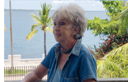
Centenario de Fidel: La creadora de Toqui y el Comandante