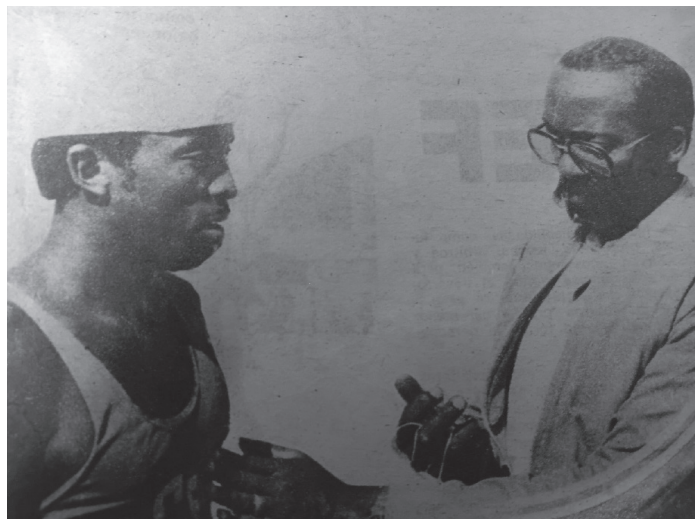
La medalla de oro en México la dedicó a su colectivo de Medicina Deportiva en Cienfuegos.