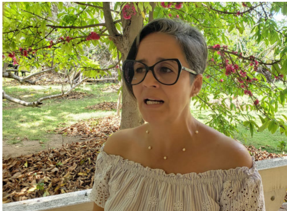
Imilla detalla sobre algunas de las bondades de la miel y otros derivados de la abeja melipona.

Como colofón del intercambio, la afanosa ingeniera refiere el saldo de los últimos encuentros nacionales. En particular narra la anécdota de una recién incorporada cienfueguera al grupo, donde aprendió a disfrutar del entorno gracias a las meliponas. Con ello instó a sumarse a este nuevo hábito de vida de las mujeres cubanas, con el fin de aprender más sobre la naturaleza en medio de las dificultades y complejidades domésticas del día a día que ha impuesto este momento que nos tocó vivir.