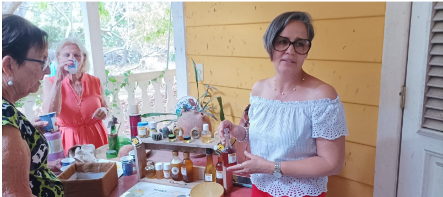
En una verdadera clase magistral se convirtió la disertación de Imilla sobre los hábitos de vida y demás curiosidades acerca de las meliponas.

“Las meliponas son fascinantes. Desde el mismo instante en que usted se coloca de-