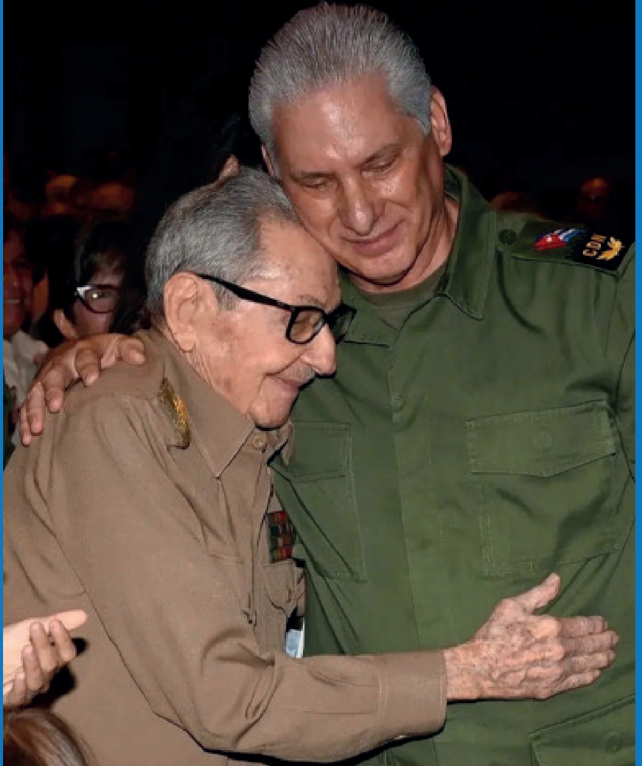
Raúl y Díaz-Canel, la continuidad de la Revolución.