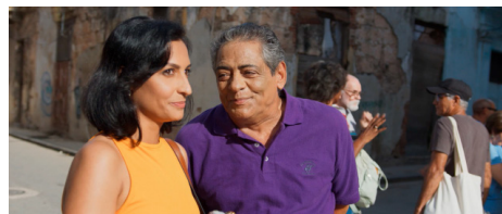
Imagen de Cinco historias de amor y un bolerón desesperado , película cubana de estreno nacional.

feliz, a causa del modo deslavazado y deshilado con que discurren.