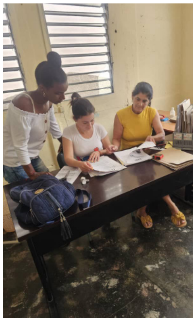
La atención a las reservas, prioridad de los consejos electoral en Cienfuegos.