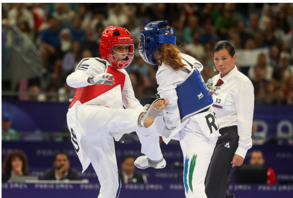
Corea del Sur acogerá el Campeonato Mundial.