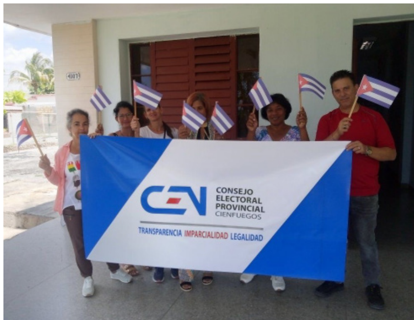
Trabajadores del CEP Cienfuegos siempre con la Patria.