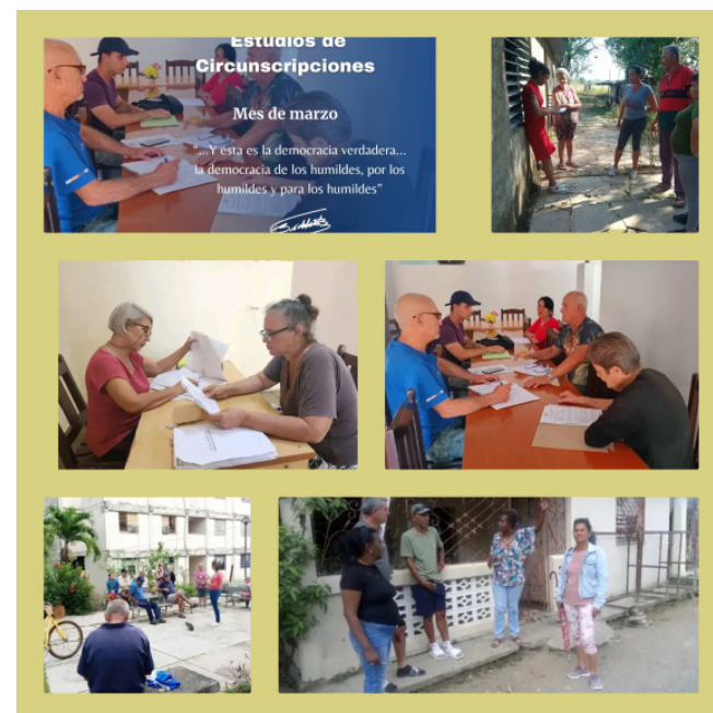
El Estudio de circunscripción, una de las acciones fundamentales de 2026.