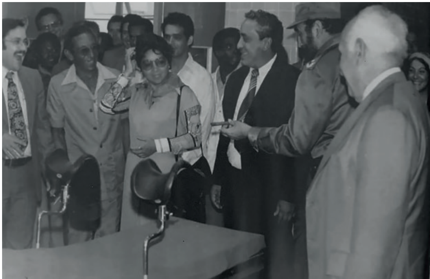
El entrevistado junto al Comandante en Jefe el día de la inauguración del Hospital Gustavo Aldereguía Lima.

Con la nueva división político-administrativa (1876) y el surgimiento de ocho nuevas provincias, supuso su regreso a la Perla del Sur en el '77 y ya de manera definitiva para asumir como Delegado, “así se llamaba entonces” en el territorio, donde le esperaba en calidad de inversionista la construcción y puesta en marcha del Hospital Gustavo Aldereguía Lima. “El último que se comenzó (1974) de nueve proyectos a lo largo de la Isla, y el primero en inaugurarse (23 de marzo de 1979)”.