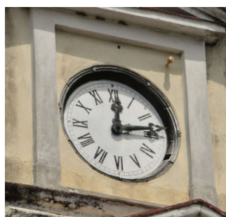
Un emblemático reloj da la hora exacta disciplinadamente en las alturas.