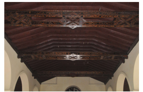
Elementos florales adornan el cielo de madera de la iglesia.