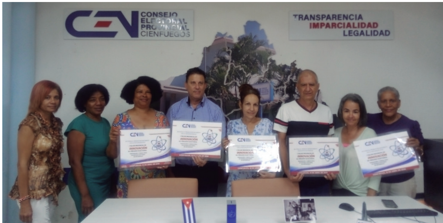
Premiados del primer taller de Innovación Electoral en Cienfuegos.

comunicación efectiva y Propuesta de Normas de Redacción para un estilo propio , de la comunicadora del órgano provincial.