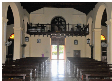
La limpieza y correcta disposición de sus elementos caracterizan todo el recinto.