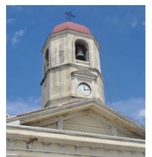
Dentro de dos meses cumplirá 158 años de ins-taurado el templo lajero.