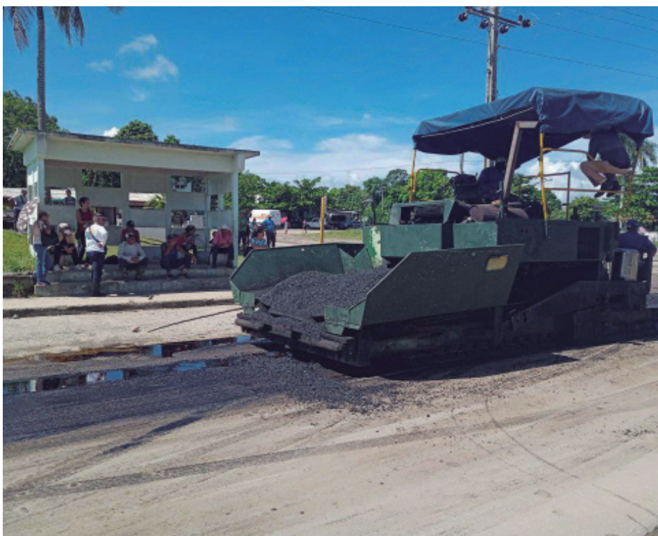
El surco de baches en la senda derecha supone un peligro para el tráfico en el poblado.