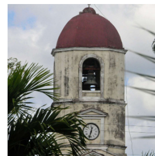
La campana que mira al parque es catalana y tiene 160 años.