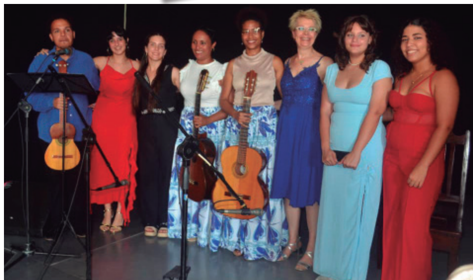
La guitarra femenina, muy bien representada.