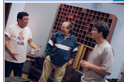
A tres décadas de nuestro Estudio de Grabaciones