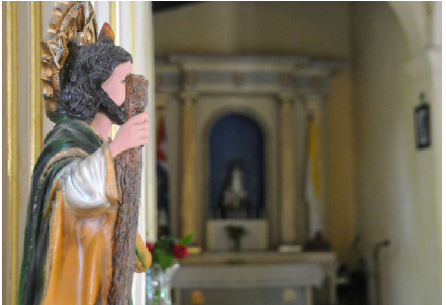
El ábside con la imagen del santo lusitano da la bienvenida al templo.

Guardiana de los alrededores, la iglesia del San Antonio de Padua es sin dudas poseedora de un bien cuidado patrimonio arquitectónico, por lo que resulta vital seguir preservando cada uno de sus símbolos para que las próximas generaciones también disfruten de esas singulares resonancias de pasado.