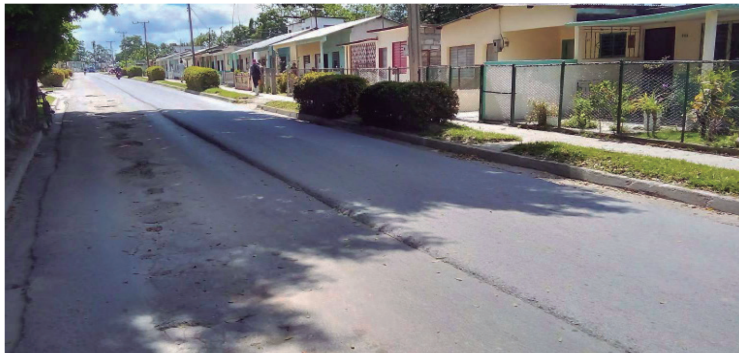
Panorámica del trabajo a medias en la calle Napoleón Diego, en dirección al policlínico.

“Los coches son muy necesarios para trasladar a las personas, y es el único