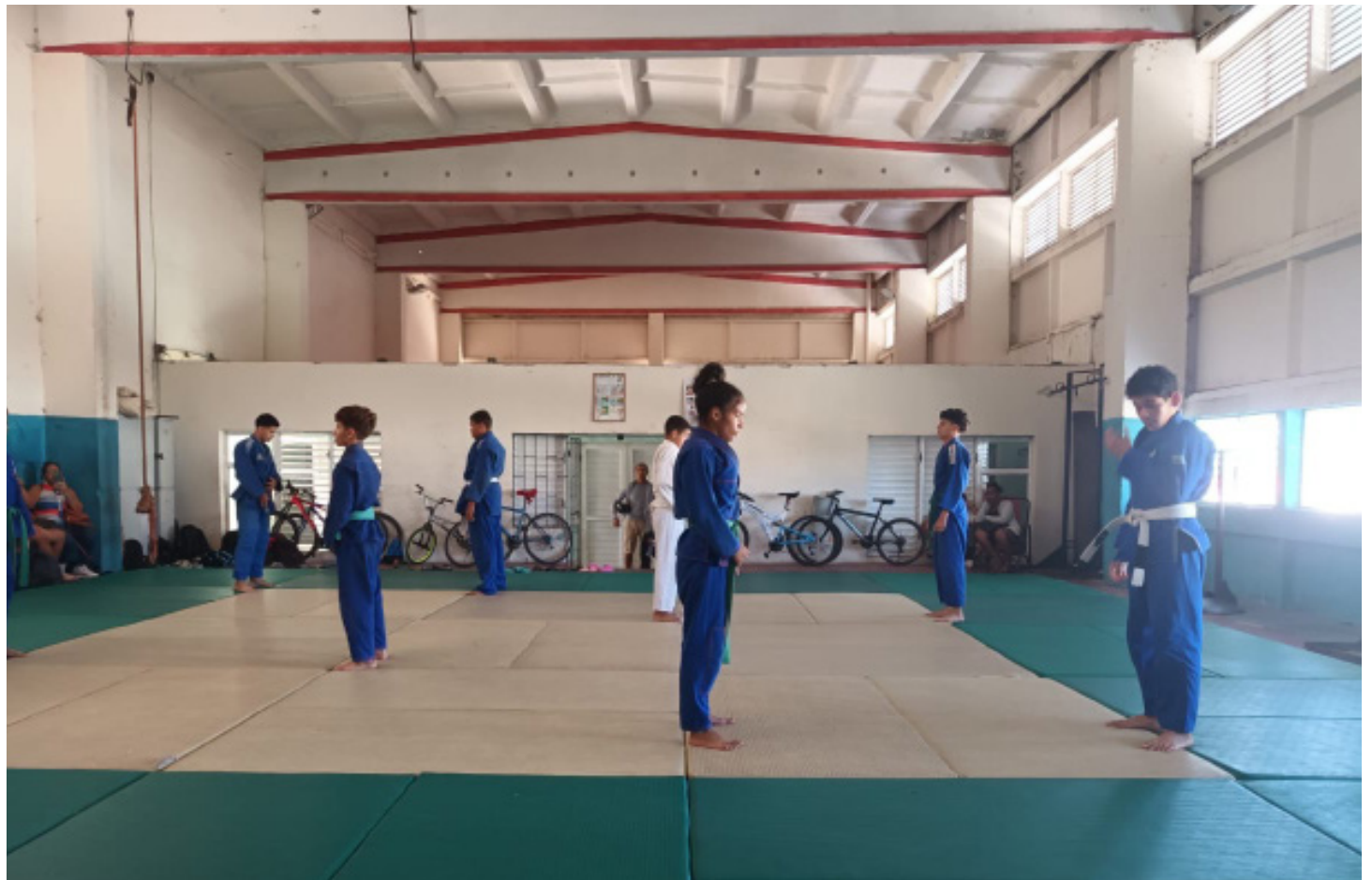
Realización de la Toma Deportiva en los asentamientos de la provincia.

“En la EIDE tenemos un por ciento bien alto de la matrícula que es de la cabecera provincial, o sea, que mantiene su preparación aquí, no con todo lo que está planificado porque la escuela hoy está brindando solamente la atención docente y la parte deportiva se ha visto disminuida. Es decir, los atletas no están almorzando en el centro, por lo que no reciben el consumo alimentario establecido, y tienen que regresar a su casa, almorzar e incorporarse al entrenamiento. En algunos casos, llevan el almuerzo desde su casa y pueden continuar de forma corrida la jornada. Sin embargo, no llegan a reunirse las kilocalorías necesarias para desarro-