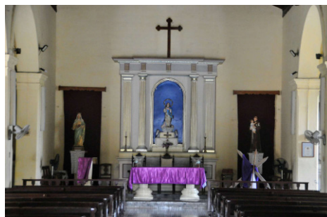
Varias estampas sagradas rodean el altar.