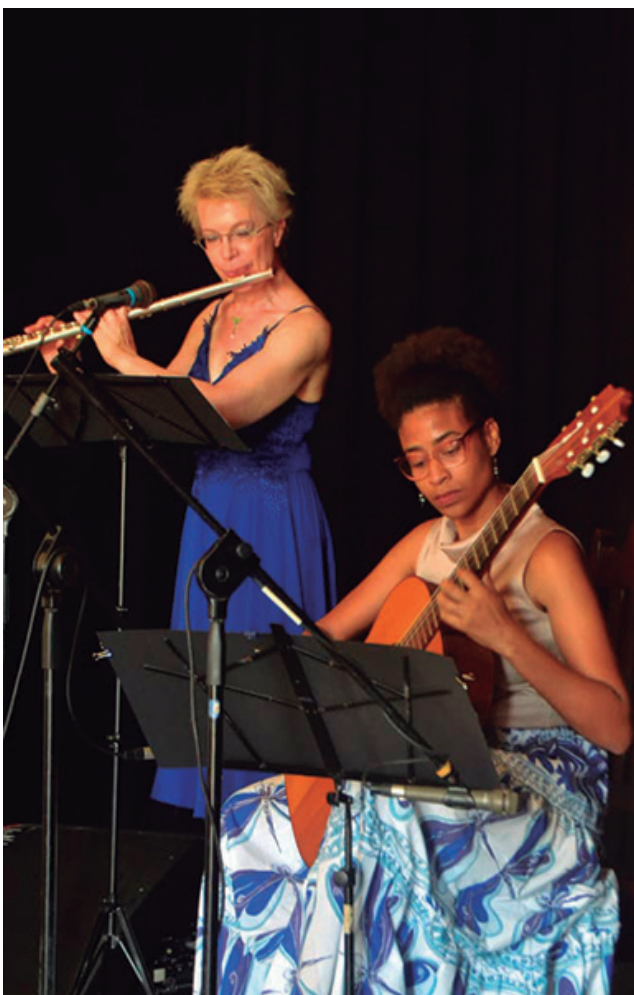
Intercambio generacional en el certamen guitarrístico.

un guitarrista, compositor y pedagogo Licenciado en Música en la especialidad de Guitarra (1982), en el Instituto Superior de Arte de La Habana (ISA).