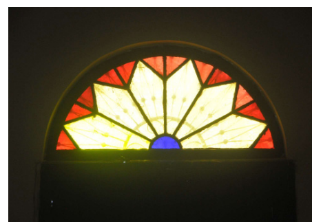
Luz y estética a través de sus sencillos vitrales.