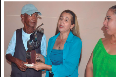
Honran a Los Naranjos en su centenario