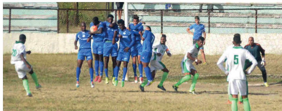
Este sábado se juega la octava jornada del certamen.

En otros resultados, en el grupo A PRI o