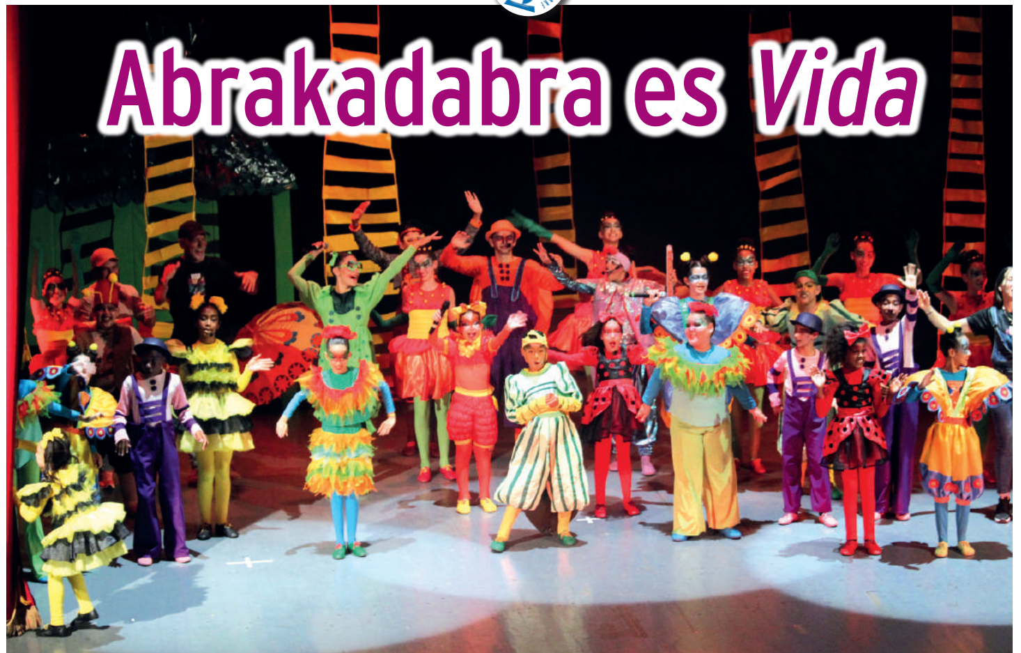
Durante dos funciones, la sala principal del teatro Tomás Terry acogió el más reciente estreno de Abrakadabra.