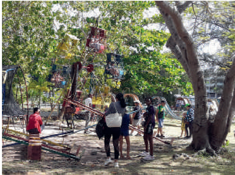
Nuevos aires se respiran hoy en el Parque de diversiones de Cienfuegos.

A lo largo de los años, el Parque de diversiones ha figurado entre los preferidos por la población infantil para su deleite durante