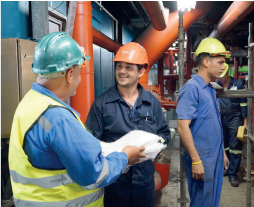
Los obreros de la Termoeléctrica, en la reactivación del bloque 3, han realizado una verdadera hazaña laboral en saludo al Día de los Trabajadores.