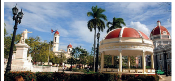
Cienfuegos conmemora sus 206