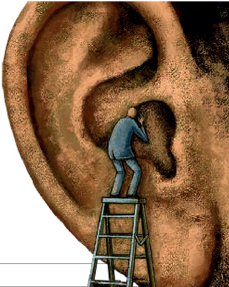
Ilustración: Osval (tomada de Internet)

Y no crean que son solo personas ignorantes, de pocos estudios, no, de que los hay los hay, y entre mayor es su preparación, más aguda resulta la “curiosidad” rayana a la chismosería superlativa que lacera.