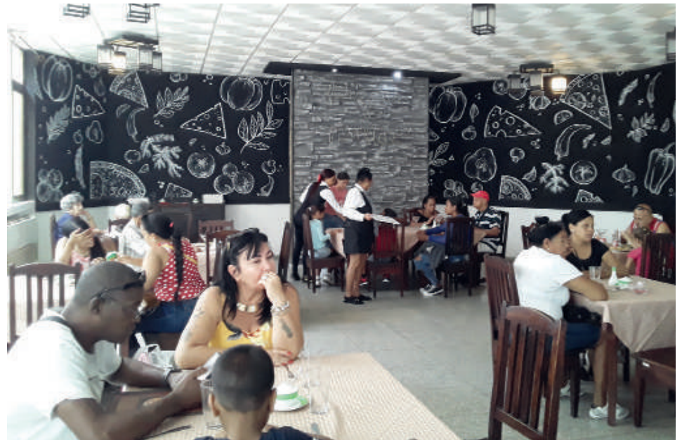
El regreso de la pizzería Giuventu a la gestión estatal ha sido bien acogido por el pueblo.