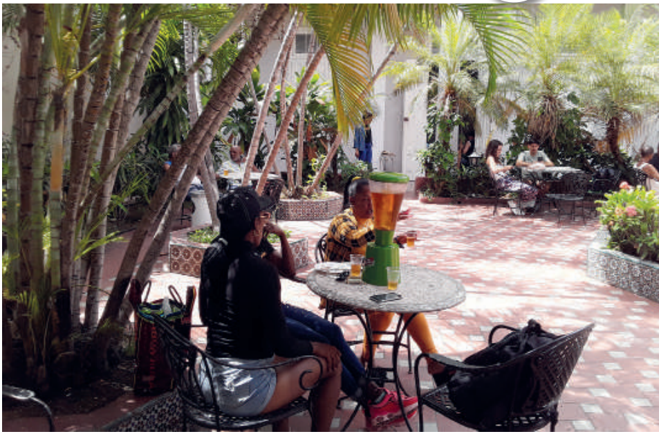
Gracias al buen servicio, los clientes repiten su visita al restaurante La Verja.