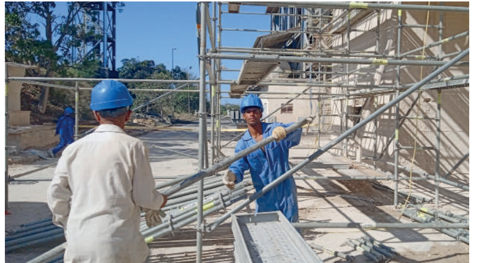
Montan un andamio para subir al sitio donde deben laborar ahora.