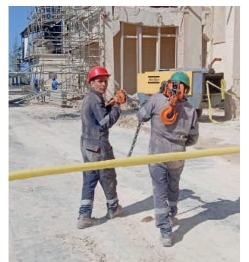
Cada trabajador toma las medidas de seguridad establecidas.

el apoyo de empresas especializadas del Ministerio de la Construcción, las cuales montaron sensores infrarrojos para determinar la verticalidad de las columnas, escaneo con técnicas modernas para saber hasta donde podríamos entrar”, abundó el ingeniero.