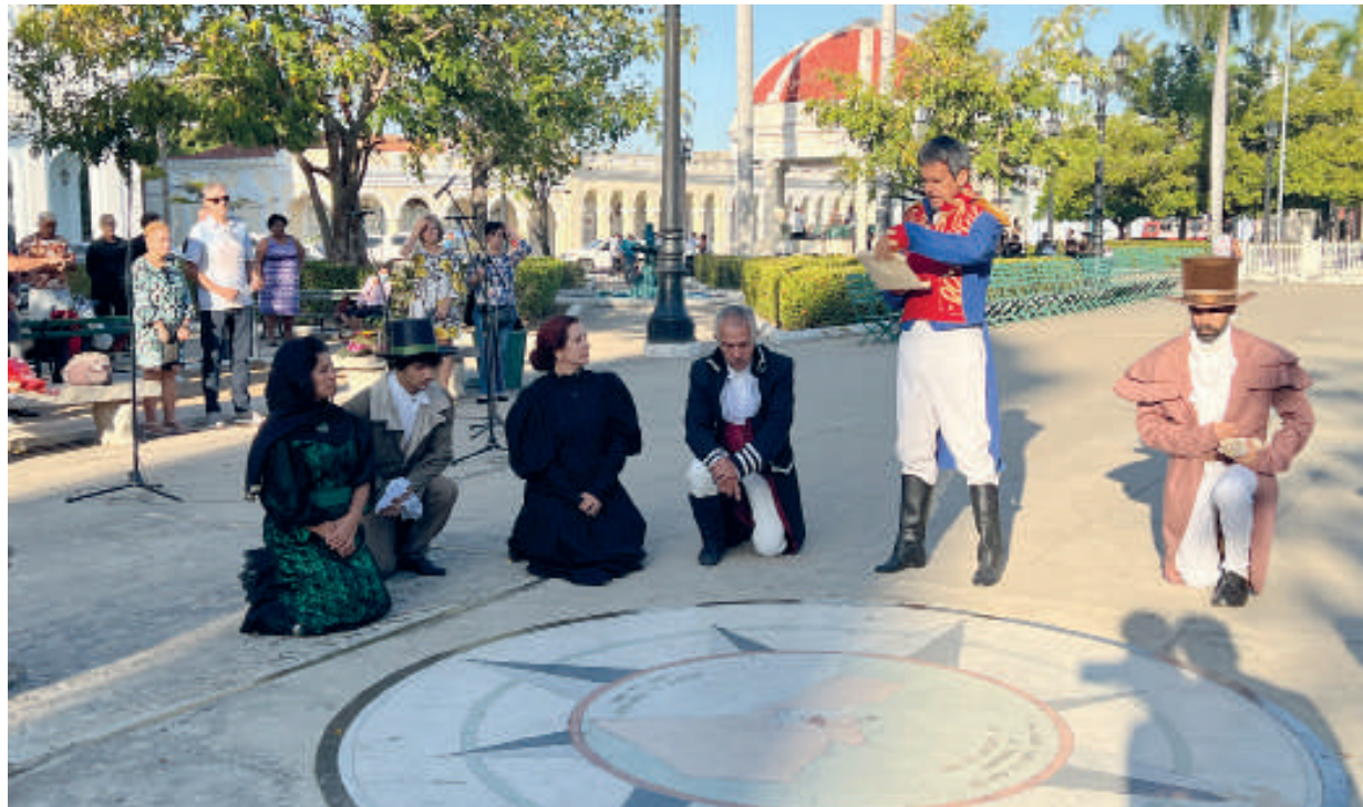
Actores del Centro Dramático de Cienfuegos, como es tradición, recrearon el acto fundacional.