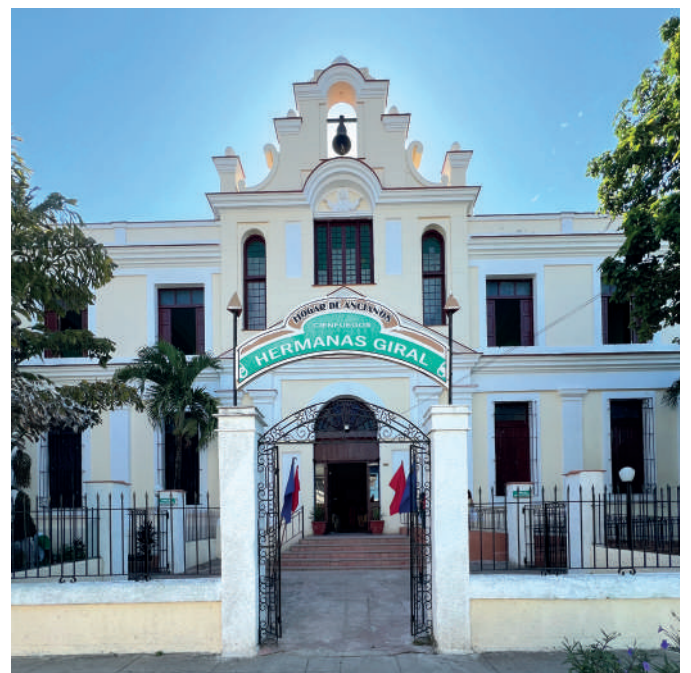
El Hogar de Ancianos Hermanas Giralt resultó ganador en la categoría de Restauración.

La jornada busca fomentar la conciencia sobre la diversidad y vulnerabilidad del patrimonio cultural de la humanidad, así como destacar la importancia de su protección y conservación.