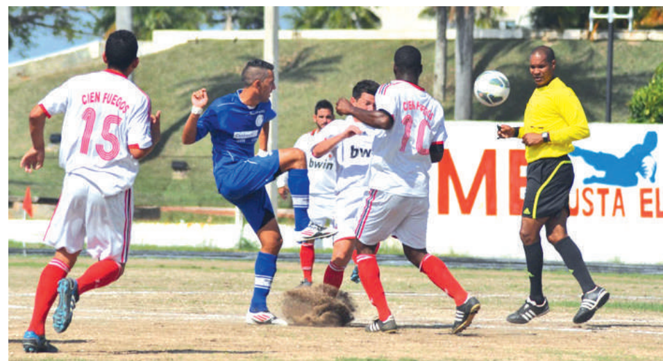
Los Marineros necesitan reencontrarse con la victoria.