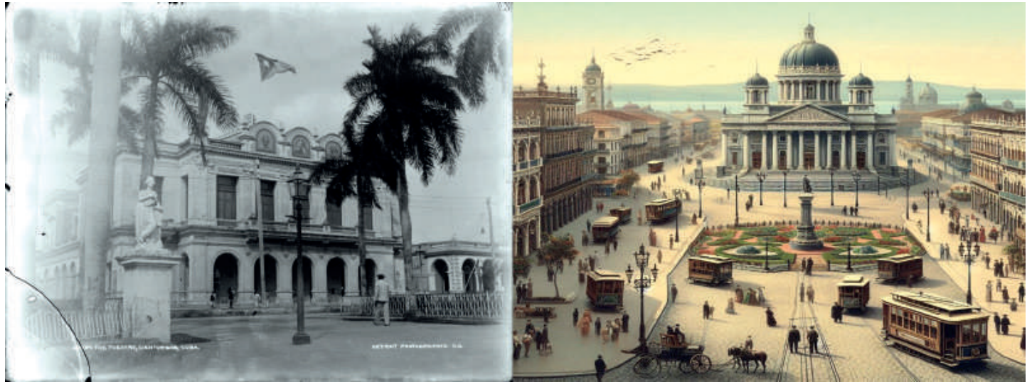
A la izquierda, el farol de gas en la antigua plaza de armas cienfueguera en los años finales del siglo XIX; al fondo, el teatro Terry, inaugurado en 1890 con alumbrado eléctrico. A la derecha, una imagen ilustrativa generada con Copilot Designer .

En apenas unos días la Perla del Sur, ciudad que muchos amamos y aún habitamos, cumplirá su aniversario 206. Valdría la pena, según me parece, tornar la vista al pasado, donde descansan nuestras raíces para, según Eduardo Galeano, “por lo que fue y contra lo que fue”, anunciar lo que será. La historia de Cienfuegos no es la historia de un rincón aislado del Caribe. Antes bien, la ciudad, su región y la isla misma son el resultado de complejas interacciones y transformaciones económicas, políticas y culturales que una y otra vez modelaron y reconfiguraron a los pueblos y culturas de este lado del Atlántico.