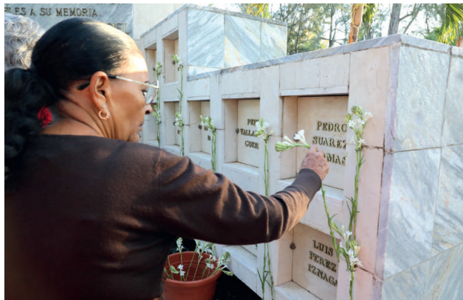
Familiares y pueblo en general colocaron ofrendas florales a los mártires y héroes de Girón.

En el contexto de la cita, la sede provincial de la Fiscalía General de la República (FGR) recibió la condición de Colectivo Distinguido Nacional, otorgado por la Central de