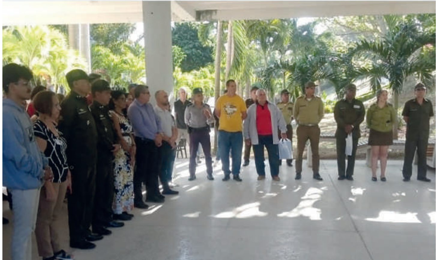
Los directivos de la casa de altos estudios transmitieron el agradecimiento a las fuerzas del Ministerio del Interior y el compromiso de su institución de incrementar las medidas de protección y seguridad, con el fin de salvaguardar los recursos dispuestos allí para la formación de los universitarios cienfuegueros.

Con el propósito de retornar a la institución los artículos recuperados hasta el