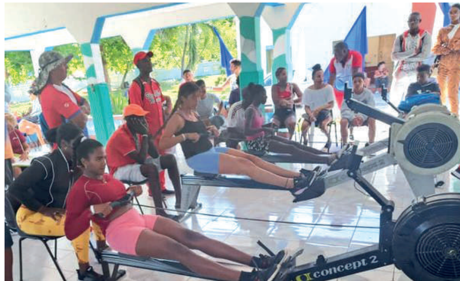
Matanzas dominó por provincias el Campeonato Nacional de Remoergometría.

Por provincias, Matanzas dominó las acciones con un total de 201,1 puntos. Detrás se ubicaron las representaciones de Cienfuegos y Villa Clara, dueñas de 91,1 y 50,1 unidades, respectivamente, en evento que tradicionalmente acoge Varadero. (C.E.CH.H. y A.L.A.)