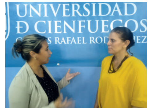
Alianzas entre la jefa del departamento de Derecho, primera de izquierda a derecha; y la decana de Ciencias Sociales.

“Tenemos la responsabilidad de propiciar un avance de la ciencia en el que todos participemos consciente, reflexiva y dialógicamente. Por eso es preciso emplear la IA para facilitar ese cambio en el uso de herramientas en los espacios educativos, y también en función de las problemáticas por las que transita la sociedad. Incluso, llevar esas experiencias al ámbito internacional, y del mismo modo nutrirnos de los estudios realizados en América Latina. Se trata de fortalecer nuestros procesos sustantivos universitarios y el currículo a través de cursos optativos; estrechar vínculos con las empresas locales y la sociedad en general; en las unidades docentes y entidades laborales de base, donde los estudiantes ven in situ las diferentes formas para implementar lo normado y legislado. La premisa es formar profesionales comprometidos con el desarrollo de la nación de una manera integral”, expresó Fernández Beriau.