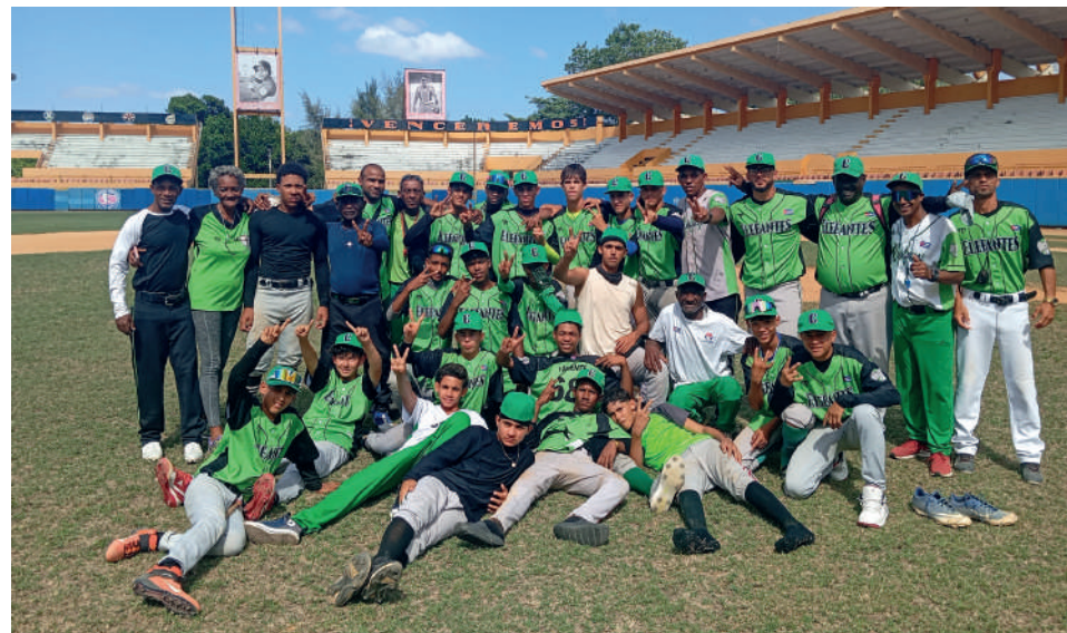
Los escolares aseguraron su boleto hacia la siguiente fase.