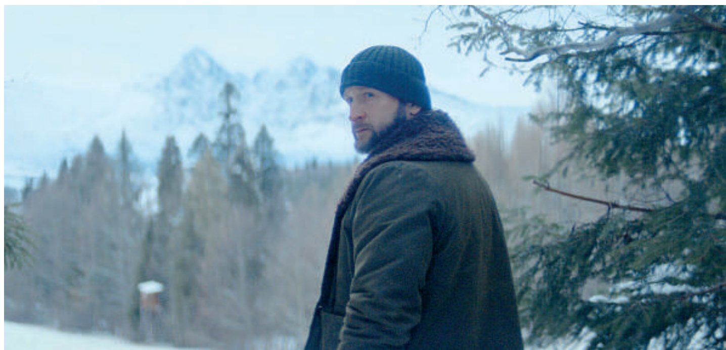
Imagen de la serie polaca Forst .

No, el equipo de Forst (fundamentalmente su guionista, su realizador y su director de fotografía) ha tomado debida nota de las enseñanzas de las series nórdicas, inglesas, irlandesas o alguna que otra neozelandesa, al convertir al entorno en sujeto dramático y contribuyente de peso a la atmósfera ominosa del material.