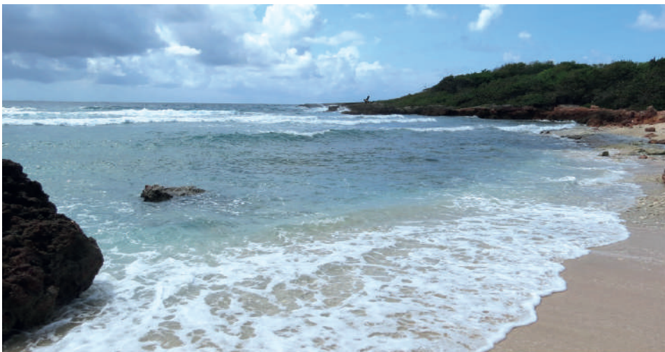
El sitio se enmarca muy cerca del área protegida de refugio Laguna de Guanaroca-Punta Gavilanes, de interés para la biodiversidad.