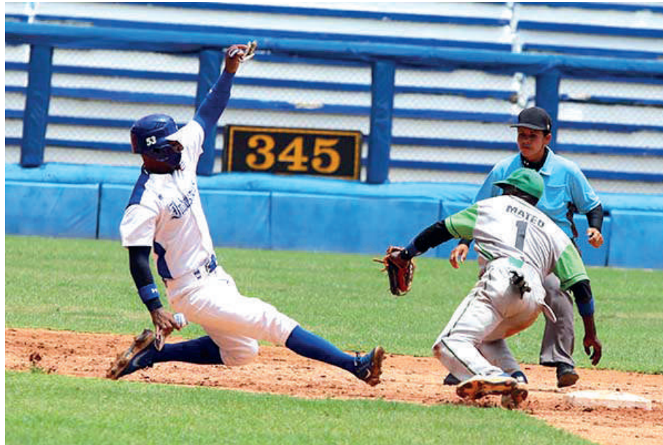
La afición cienfueguera espera con ansias el despertar de los Elefantes.

Subrayó que incluso habrá que variar el sistema de juego de los Elefantes, ahora que adolecen de los bateadores de fuerza de antaño, por lo que la selección tendrá que reajustar las maneras en dependencia del arsenal que posea.