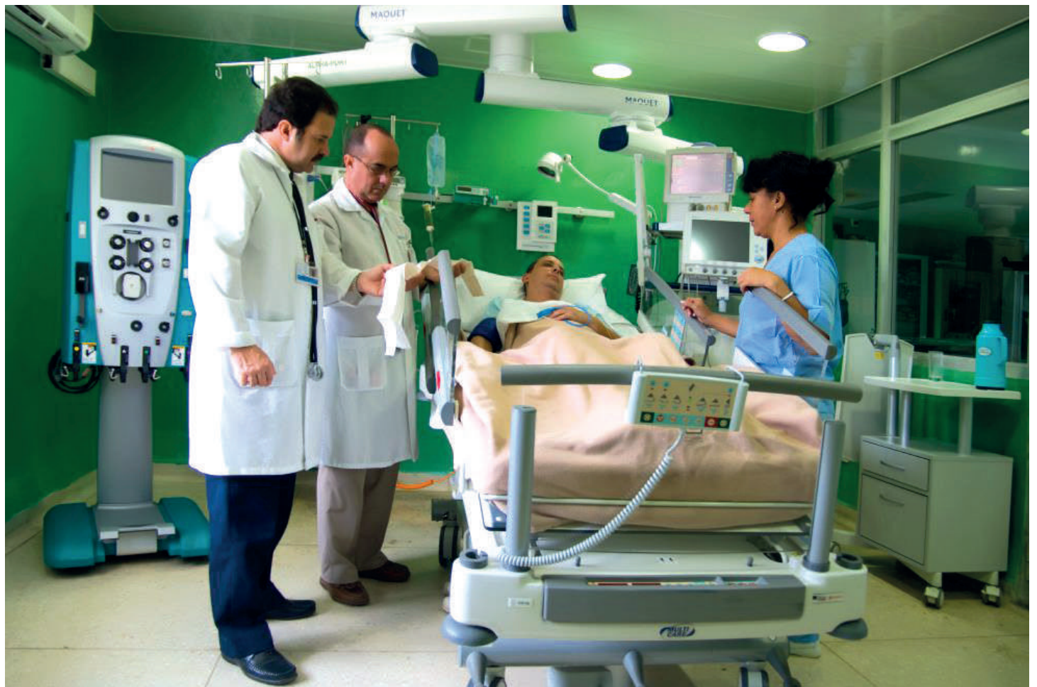
En los centros asistenciales cubanos se salvaguardan minuto a minuto las vidas de nosotros, de nuestros padres, abuelos, hijos, amigos, compañeros... no importa en el barrio en que vivan. Protegerlos, entonces, resulta esencial.

No obstante, en aras de despejar las dudas con el tema que nos ocupa