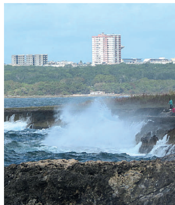
Las olas crean un verdadero frenesí contra el litoral y las rocas.

Aunque el acceso a la cresta de la torre blanca de 66 pies está limitado en la actualidad, sería muy positivo que en años venideros los visitantes nacionales y foráneos pudieran conocer más de cerca sobre