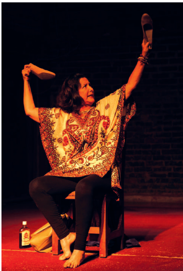
Las penas saben nadar.

La venidera celebración del Festival constituirá la sexta desde su transformación en evento latinoamericano, dado el interés mostrado por artistas de América, España, Portugal e Italia. En total, será la oncenava edición desde su surgimiento en 2002 como un acontecimiento de carácter nacional.