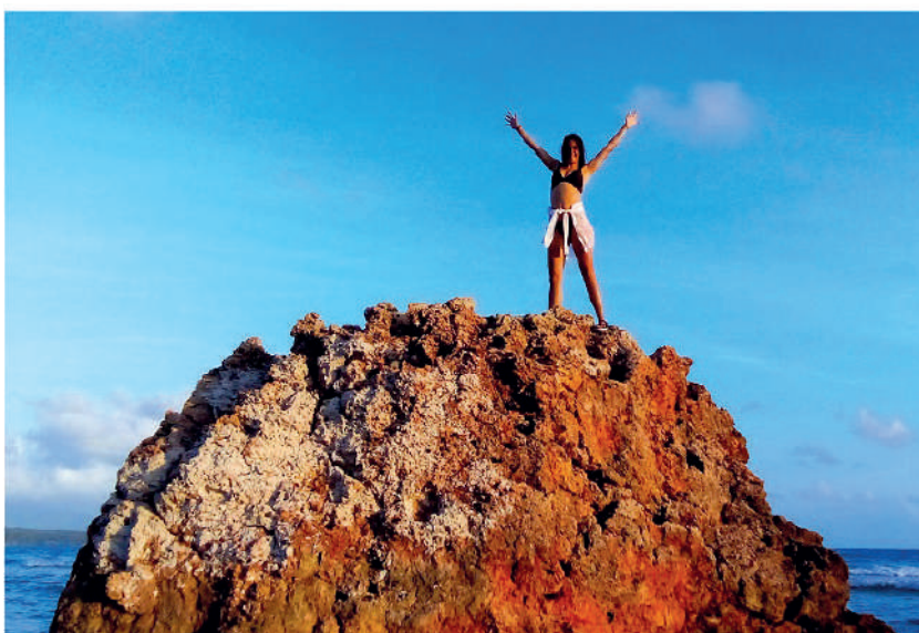
Formaciones rocosas peculiares se alzan como lunares en medio del mar.