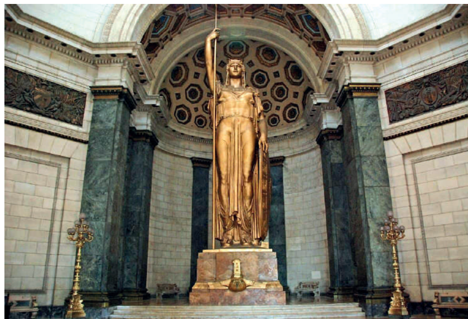
Estatua de la República en el Capitolio de La Habana, sede de la Asamblea Nacional del Poder Popular de Cuba.

Luego de varios concursos y un tiempo prolongado de espera, fue precisamente el escultor italiano Ángelo Zanelli el encargado de ejecutar la obra de homenaje a Artigas. La estatua está hecha en bronce, fue fundida en Italia y trasladada a Uruguay donde se ensambló. Entre el basamento y la escultura alcanzan los 17 m de altura.