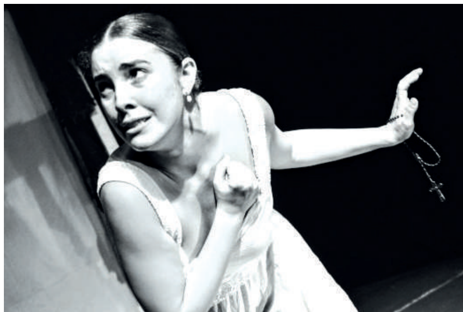
Me llamaban Tula.