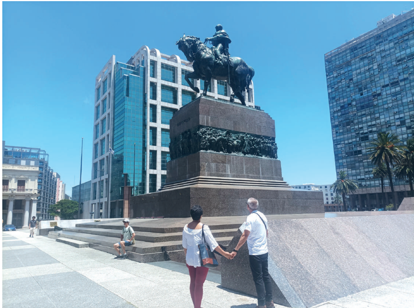
Impresionante escultura ecuestre del general José Artigas en la Plaza de la Independencia, en Montevideo.

Sin dudas, uno de los sitios más visitados por nativos y extranjeros en la capital