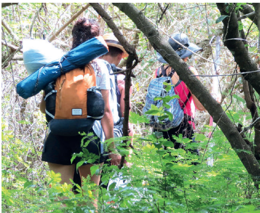
Un trillo da acceso a la playita, ubicada allende la punta de los Colorados.

El nombre, vinculado al devenir de un antiguo cable submarino que aún hoy perdura en las cercanías, unió en su momento telegráficamente a la boyante urbe cienfueguera, por ejemplo, con las poblaciones de Batabanó, Santiago de Cuba, La Habana y otros territorios de la región caribeña, asimismo con los Estados Unidos y Europa. Han pasado 150 años de su establecimiento en aquellos lares y bien poco queda de él. Luego de la escaramuza entre españoles y norteamericanos en la década del 90 del siglo XIX, que produjo su inhabilitación, la fuerza de la naturaleza ha sido quien se ha adueñado de los vestigios, y tanto buzos como fotógrafos han podido dar cuenta de ello en múltiples inmersiones y obras.