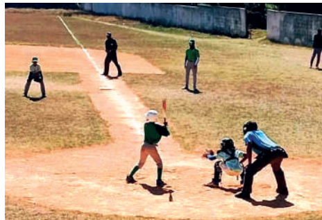
Partido de béisbol de las Pequeñas Ligas entre Cienfuegos y Cruces.

La final nacional de las Pequeñas Ligas dará inicio el 1.º de marzo con una doble jornada, y de ser necesario, se efectuará un tercer encuentro entre el campeón de la provincia de Villa Clara y los sureños en