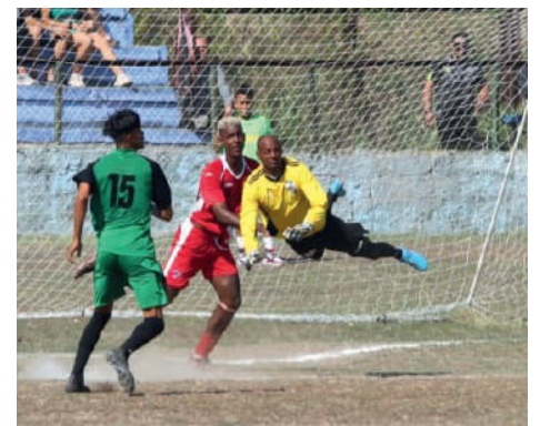
Los Marineros de Cienfuegos, actuales campeones nacionales. / Foto: Carlos Ernesto

Según informaciones llegadas a nuestra redacción, este 8 de febrero debe dar inicio el Torneo Apertura luego de más de un año de inactivi-