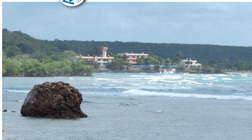
Se aprecian en lontananza las estructuras hoteleras de la zona.