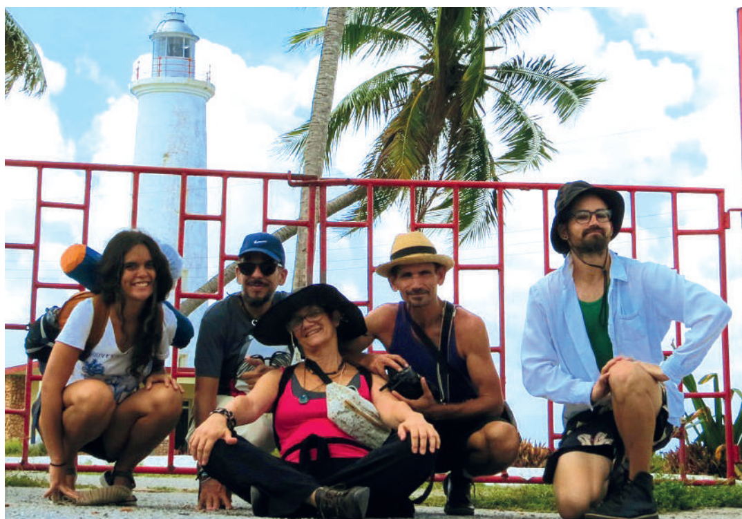
El grupo de amigos de Cienfuegos y Villa Clara.

Uno de los rincones más bellos e interesantes del litoral cienfueguero se ubica muy cerca de la entrada a la bahía de la provincia. Resguardada por el faro de Punta de los Colorados (Villanueva), la playita del Cable Inglés deviene en paraíso escondido en la margen izquierda de la carretera que enlaza a la ciudad cabecera con el Hotel Pasacaballo, y que muy pocos conocen.