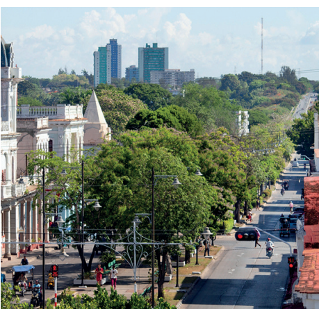
Perspectiva hacia el norte, del Paseo del Prado.