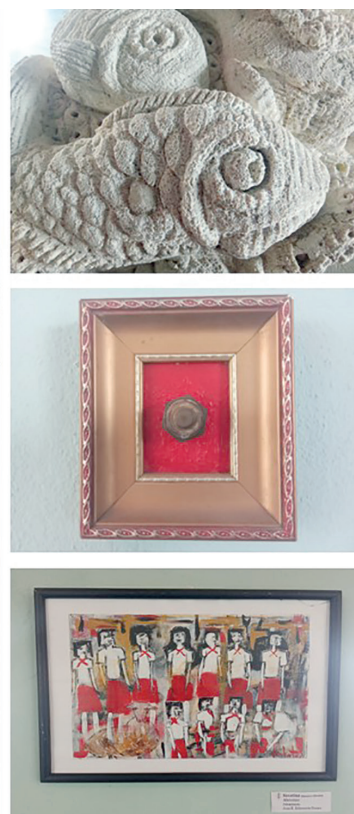
Laura , de Osmany Núñez (izquierda); Fuera del agua , de José Basulto (derecha-arriba); De izquierda a derecha , de Edgar González Era (derecha-centro); y Matutino , de Juan K. Echeverría (derecha-debajo).