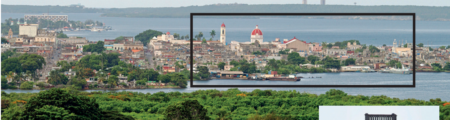
Cienfuegos, la Perla de Cuba. Enmarcado con una línea en negro, el núcleo del Centro Histórico Urbano (CHU), declarado Patrimonio Cultural de la Humanidad por la Unesco, el 15 de julio de 2005.