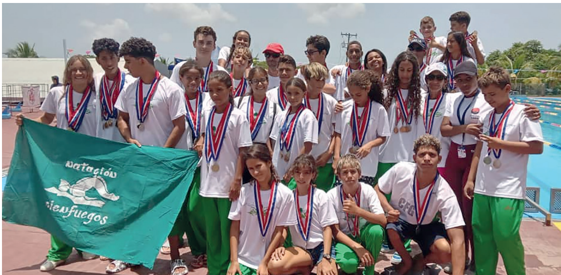
La natación con impresionante cosecha de 44 medallas.