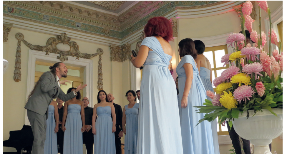
Cantores de Cienfuegos interpretó temas de gran rigor artístico.

Pero fueron las piezas Si me pudieras querer , de Ignacio Villa; Lágrimas negras , obra