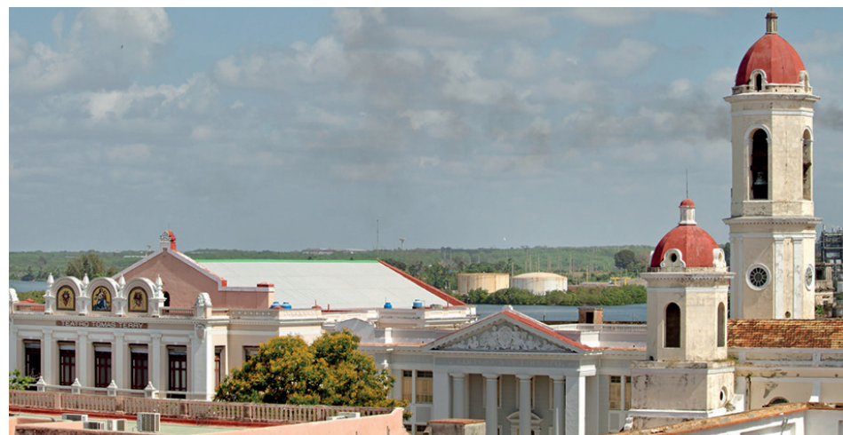
El Teatro Tomás Terry, la Secundaria Básica 5 de Septiembre (antiguo colegio San Lorenzo) y las torres dispares de la Catedral de Nuestra Señora de la Purísima Concepción.