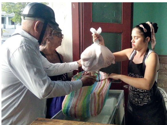
Tras la Resolución 225 del Ministerio de Finanzas y Precios se establecieron precios minoristas máximos para productos alimenticios básicos, como el pollo y el aceite, que ofertan las mipymes.