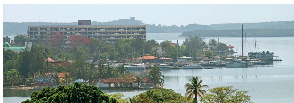
Vista parcial en perspectiva del reparto residencial y turístico de Punta Gorda.