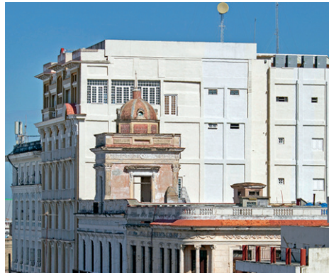
Vista de edificaciones emblemáticas en la avenida 56, entre ellas, el hotel Meliá San Carlos (Premio Nacional de Restauración 2024).