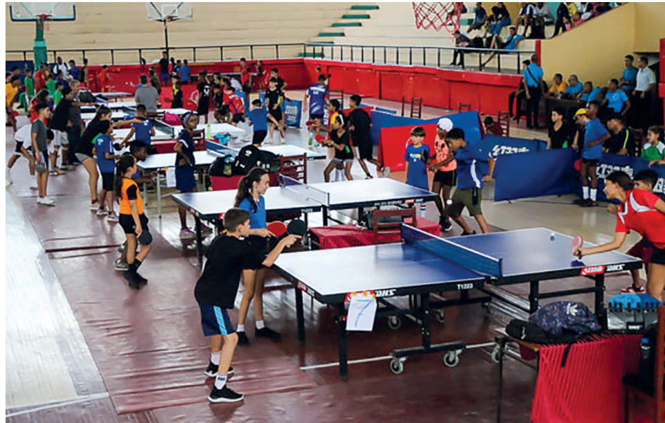
El tenis de mesa finalizó en la segunda plaza.

Hace unos años, cuando Cienfuegos alcanzó un sexto lugar nacional, más de uno