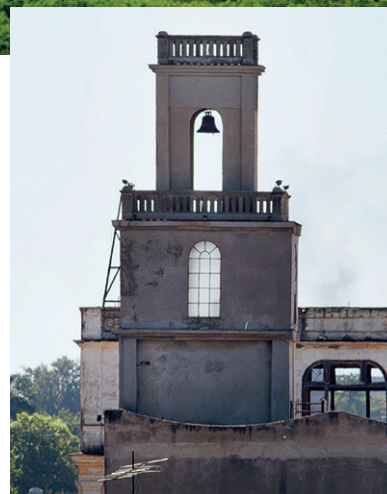
Torre campanario de los Jesuitas.