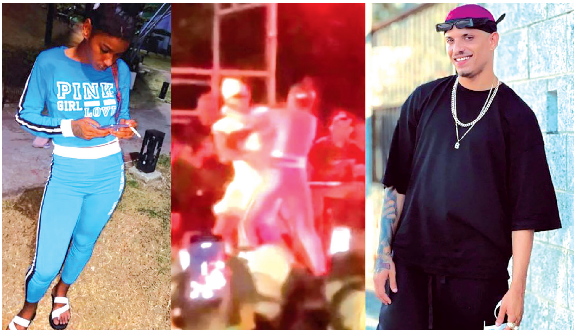
La joven agredida, el momento en que se subió al escenario, y el reguetonero.

Un asunto es el deber y otro el atropello. ¿Cuándo se naturalizó la violencia de género? ¿Puede un pulóver con las letras SEGURIDAD dar carta blanca para que se cometa una injusticia? ¿Tienen los contenidos de las canciones de música urbana responsabilidad en la indiferencia ante la violencia?