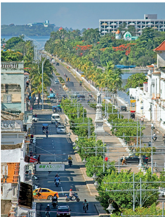
Perspectiva hacia el sur, del Paseo del Prado.