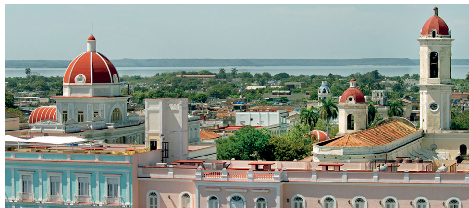
Hotel La Unión, Affiliated by Meliá, y varias de las cúpulas del Centro Histórico Urbano (CHU).