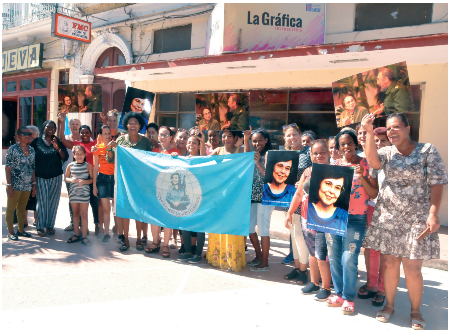
Las laureadas federadas cienfuegueras, tras el acto de agasajo transcurrido este jueves frente a la sede de la institución provincial.

El 23 de agosto de 1960 se creó la FMC, con el objetivo principal de incorporar a la mujer a la sociedad y al empleo, así como al programa de cambios sociales y económicos en marcha en la nación.