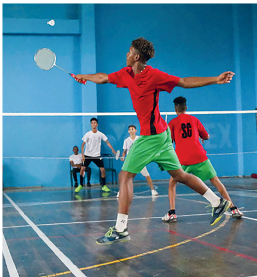
Cienfuegos mantuvo el reinado en el bádminton.

La pregunta es ¿hasta dónde podrá llegar Cienfuegos? Aquí estaremos para contarlo.