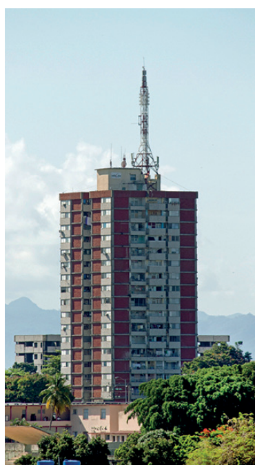
Edificio 18 Plantas en la zona del Hospital Provincial, con la torre de RadioCuba en la azotea.