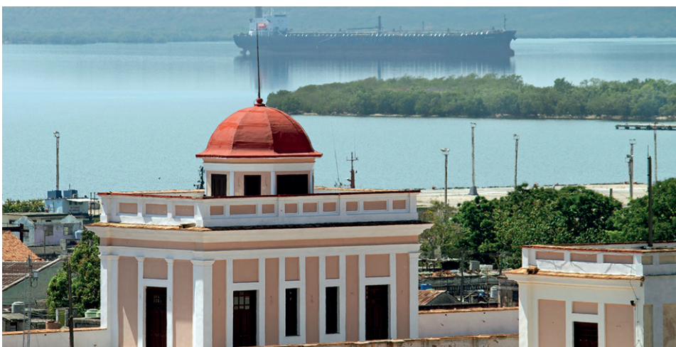
Torre mirador con cúpula en el Palacio García de la Noceda, sede de la Oficina del Conservador de la Ciudad de Cienfuegos (OCCC).