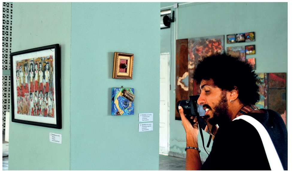
El Taller de los Artistas comparte su tercera exposición: Keratina.