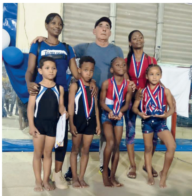
La gimnasia artística fue segunda general y primera en la rama femenina.

En el puesto número tres quedó el pentatlón, mientras el taekwondo y el boxeo terminaban en el cuarto escaño. Más alejados con-