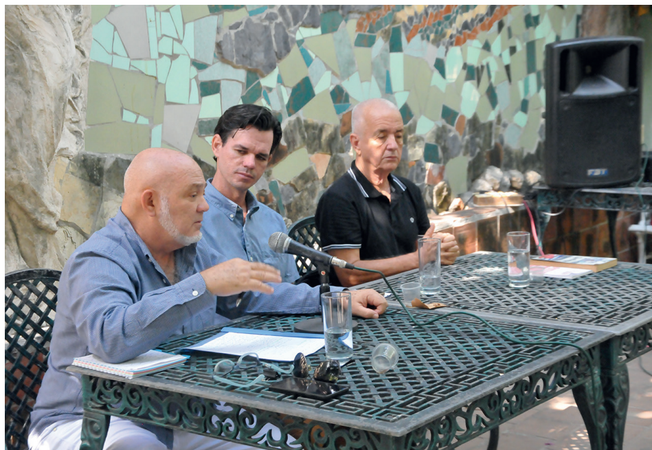
Prestigiosos historiadores de Cienfuegos condujeron el panel sobre la identidad local.

médico y farmacéutico que se conocieron en Cienfuegos resultaron franceses, y pese a los aires patriarcales de la época, las mujeres de estos colonos destacaron por ser muy emprendedo-