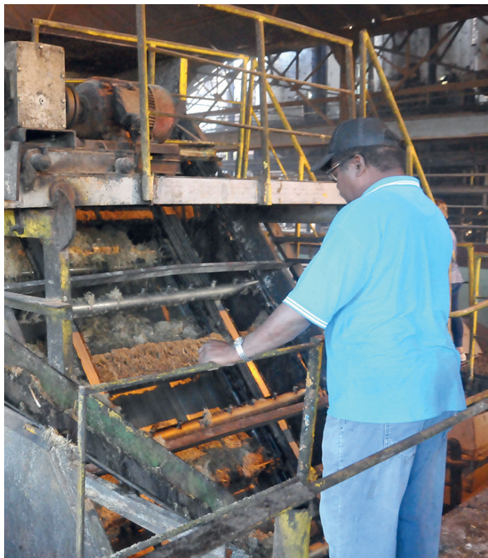
Además de la materia prima propia, se ha molido caña de los campos de la vecina Matanzas.