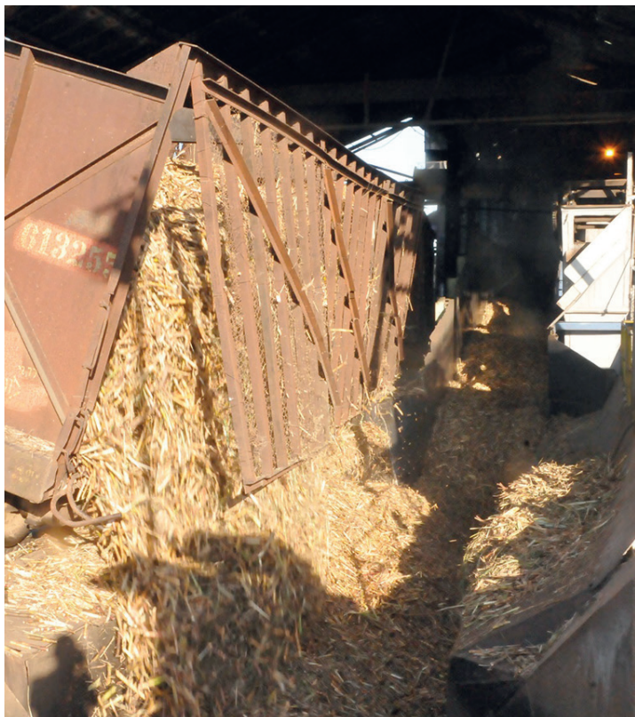
Los bajos niveles de molienda afectaron la eficiencia industrial del central Antonio Sánchez.

En tanto, la chimenea del antiguo central Covadonga sigue expulsando bocanadas de humo, es decir, más azúcar para crecer, mientras cada pitazo del ingenio continúa marcando horarios en el palpitante del batey.