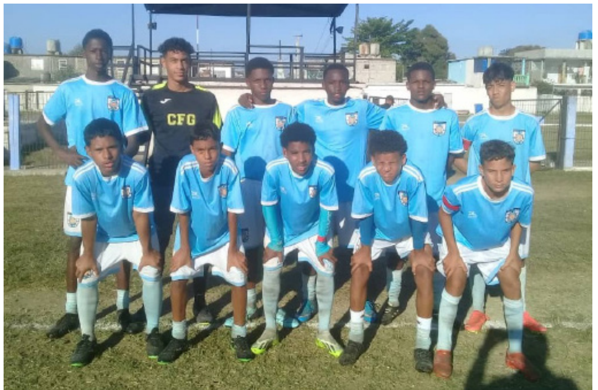
Los escolares sumaron cuatro puntos de seis posibles. / Foto: del autor

El propio Castro se encargó de decretar la igualdad cuando al '52 aprovechaba una mala salida del