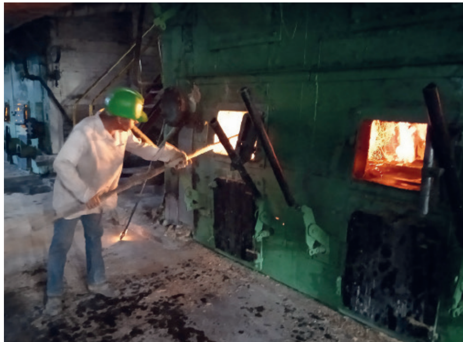
El área de generación de vapor es vital para proveer de energía a toda la maquinaria industrial.

El ejecutivo mencionó entre las labores más acuciantes acometidas durante la etapa previa el colador rotatorio en el área de los molinos, la cadena de estera del basculador y reconstrucción de varios dispositivos de casa de calderas. "Luego, nuestra previsión fue muy clara, a tal punto que el impacto resultó muy favorable, como que-