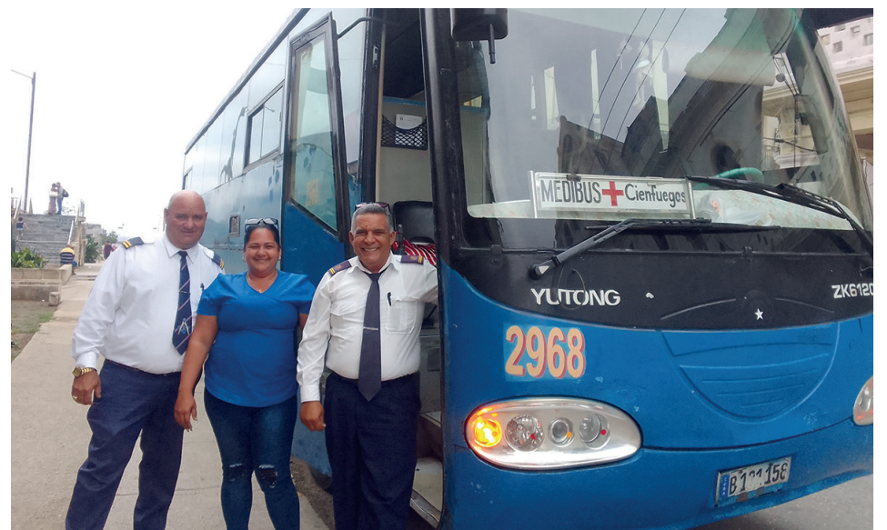
La labor de la tripulación del medibús resulta encomiable.