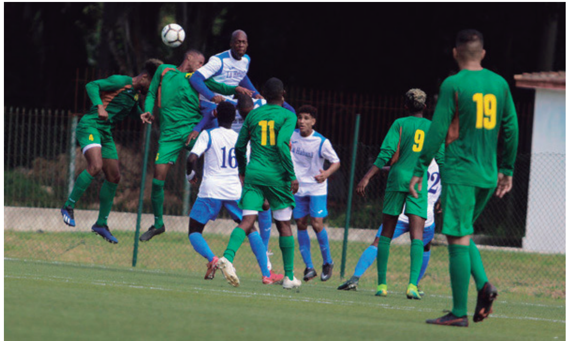
Con el Torneo Apertura da inicio la 108 Liga Nacional de Fútbol.

Santiago de Cuba-Sancti Spiritus y Granma-Camagüey no se realizaron por problemas de transportación.