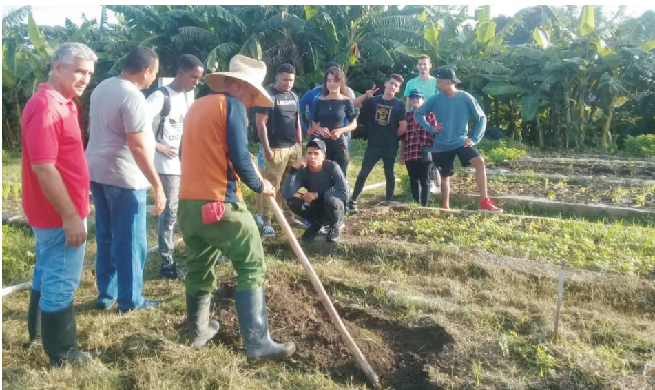
Alumnos de la carrera de Agronomía y de otras especialidades de la Universidad de Cienfuegos participan en la unidad docente Organopónico Cuatro Caminos.

naria, en esa propia línea estratégica debe iniciarse otro en 2024, denominado Modelo de gestión de inocuidad alimentaria basado en la economía circular en la minindustria láctea La Perseverancia, en el municipio de Aguada.