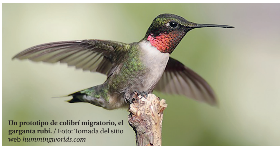
Un prototipo de colibrí migratorio, el garganta rubí.

El tercero y más común es el Riccordia ricordii , conocido