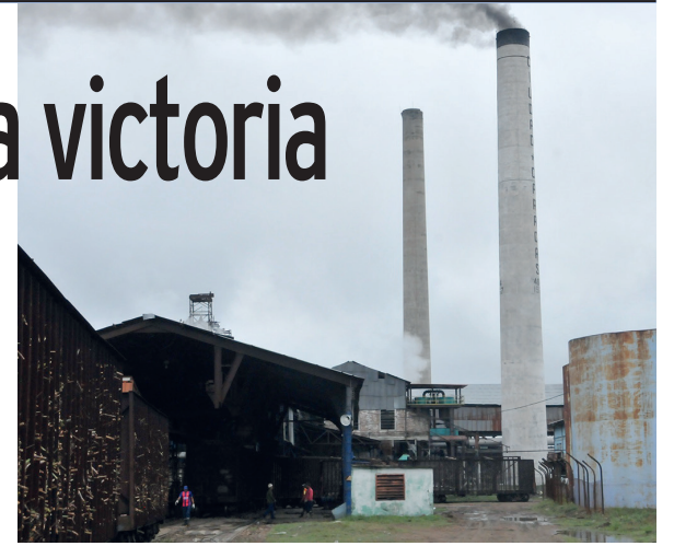
Este ingenio será el que más azúcar aporte con destino a la canasta familiar normada de varias provincias del país.

En estos molinos se procesan las cañas propias, además de las de EAA 5 de Septiembre y Efraín Alfonso, de Villa Clara.