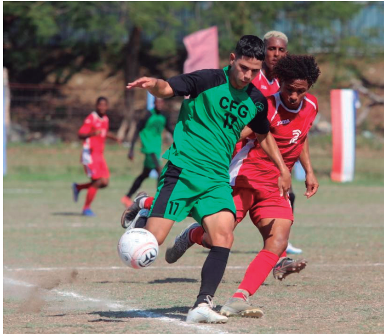
Palmira sigue invicto en el torneo. / Foto: del autor

Mientras, los equipos cienfuegueros sacaron renta positiva