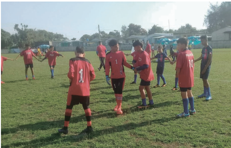
Este sábado dará inicio el Torneo Apertura.

en su debut en los campeonatos nacionales de fútbol de las categorías escolar y juvenil, los cuales comenzaron como visitantes nada menos que ante su histórico rival Villa Clara.