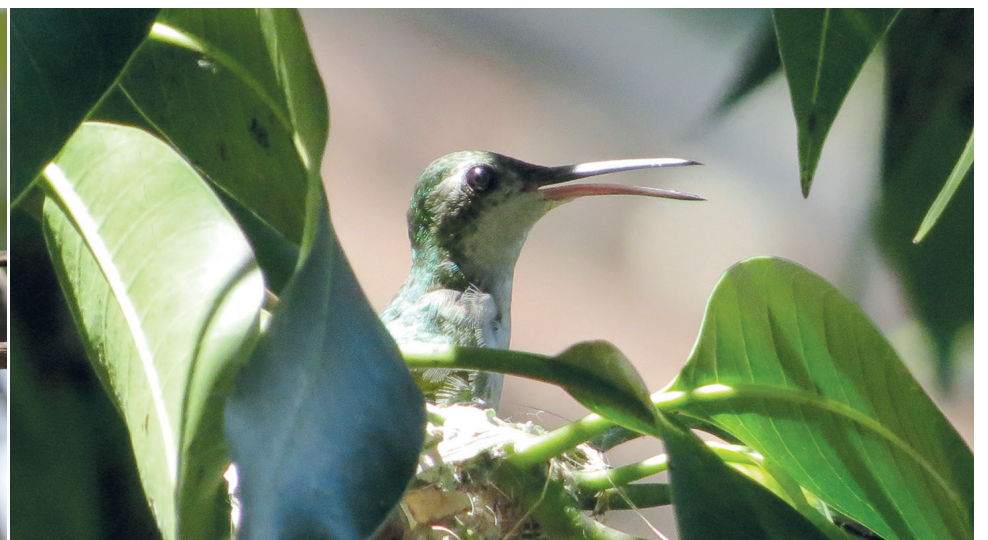
El zunzún esmeralda alegra tanto calles y jardines como las más altas montañas de Cuba.