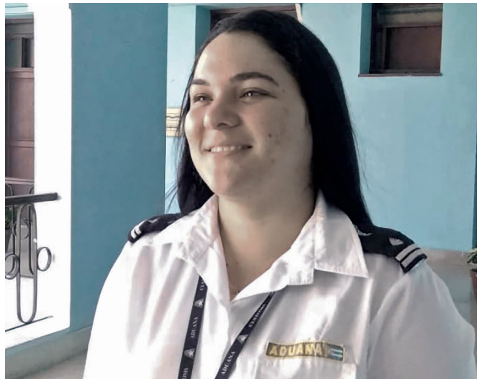
En el aniversario 61 de la Aduana, jóvenes como ella representan la continuidad y el compromiso.

mento de especial significación. De cara a la celebración se ha diseñado una serie de actividades, entre las que sobresale la entrega de viviendas a compañeros nuestros destacados.