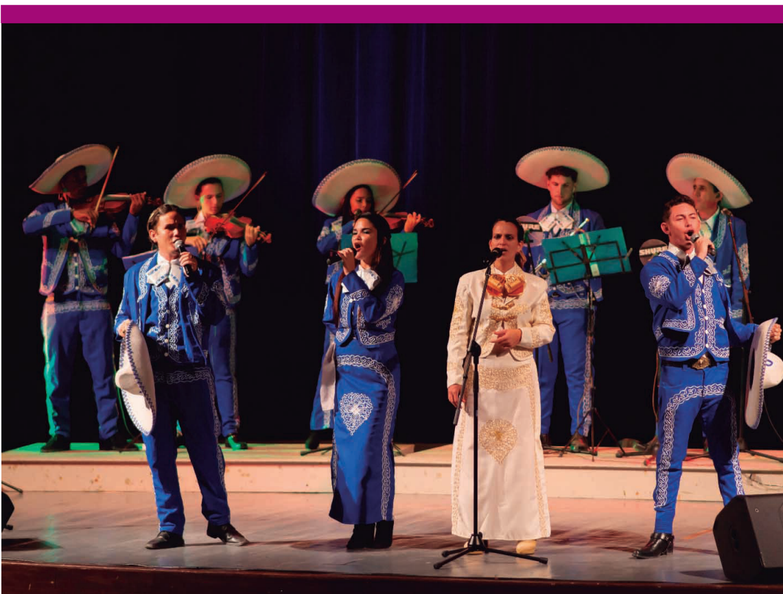
Concierto del Mariachi Galanes Aztecas en el teatro Tomás Terry.