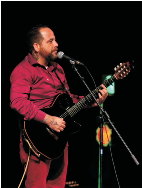
Nelson Valdés estrenó uno de los temas de su próximo disco.