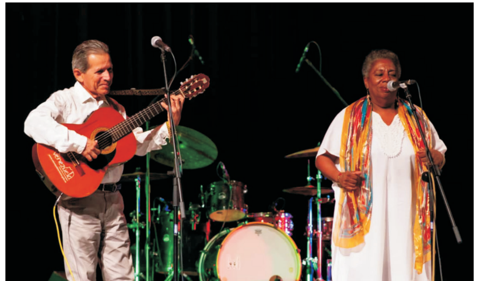
El Dúo Así Son estuvo entre los artistas invitados al concierto del trovador, quien conduce, además, el programa Sesiones Vagabundas, de Telesur.

El concierto de despedida de Mauricio Figueiral supone un punto de inflexión en la trayectoria del cantautor. “A Cienfuegos vine por primera vez a cantar con una guitarra fuera de la capital, después me enamoré y tuve una relación muy intensa, y aquí cierro un ciclo de mi vida para comenzar otro”, concluyó.