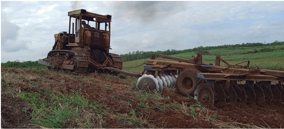
La preparación de nuevas tierras permite el crecimiento sostenido de los cultivos.