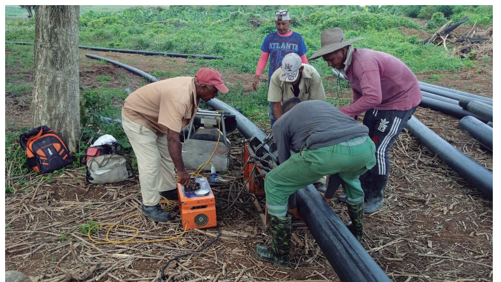
La instalación de una conductora de agua desde el canal magistral Paso Bonito-Cruces garantiza el riego de las diferentes plantaciones.