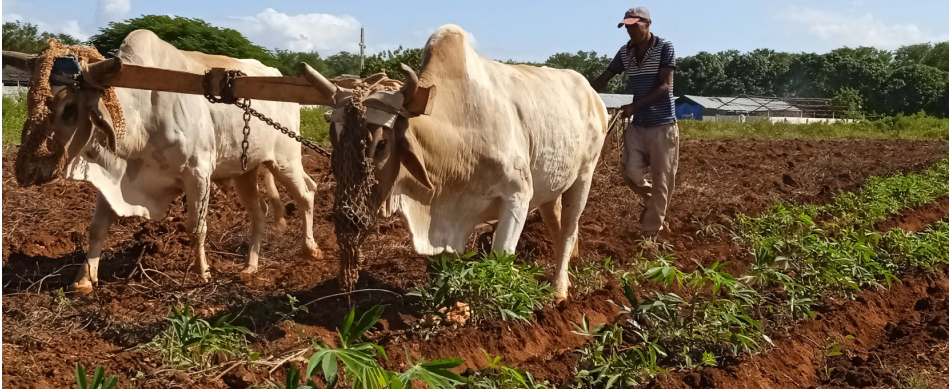
La tracción animal constituye un pilar importante para el laboreo de la tierra y el acarreo de cosechas.