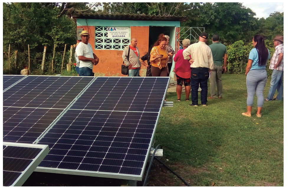
La instalación de paneles solares permite la vitalidad de la estación de bombeo para el abasto de agua a Quesada.