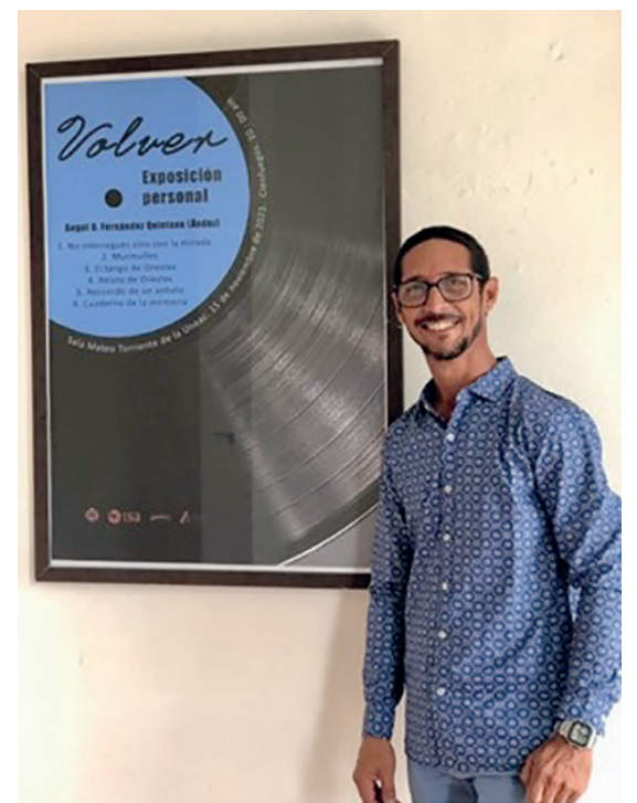
Volver , la más reciente muestra visual de Ángel Fernández ( Ández ).