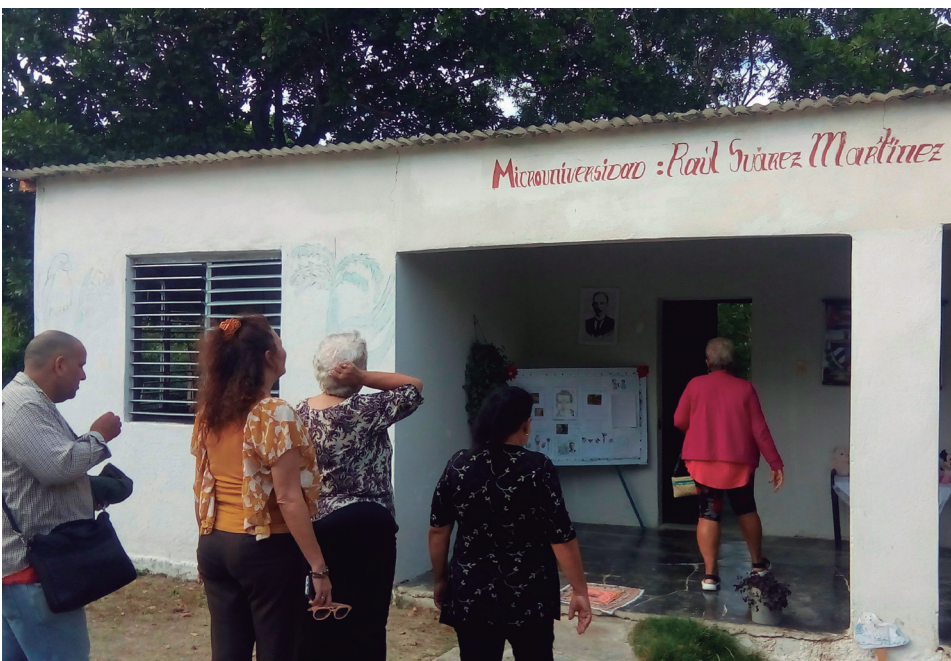
Hasta la escuela primaria llegaron las acciones transformadoras.