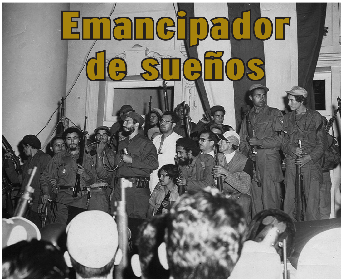
Fidel se dirige al pueblo cienfueguero, como parte de su visita en enero de 1959, un alto en el camino de la Caravana de la Libertad.

Dos años transcurrirían cuando ocurre el funesto golpe militar del 10 de marzo de 1952; acto demoledor al pueblo de Cuba, que perdía totalmente la fe y las esperanzas hacia una vida mejor, suceso triste que no logró entusiasmar al pueblo ni a nadie, hasta pasados los primeros años de la sangrienta tiranía, cuando florecen los emancipados en 1953 liderados por él,