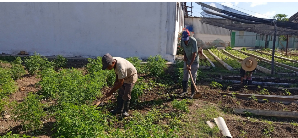
El cultivo de vegetales, como el tomate, cubre parte de las áreas de cultivos varios.