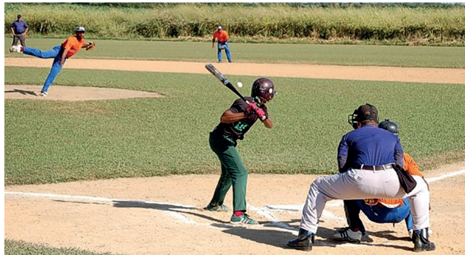
Este fin de semana se disputa la gran final.