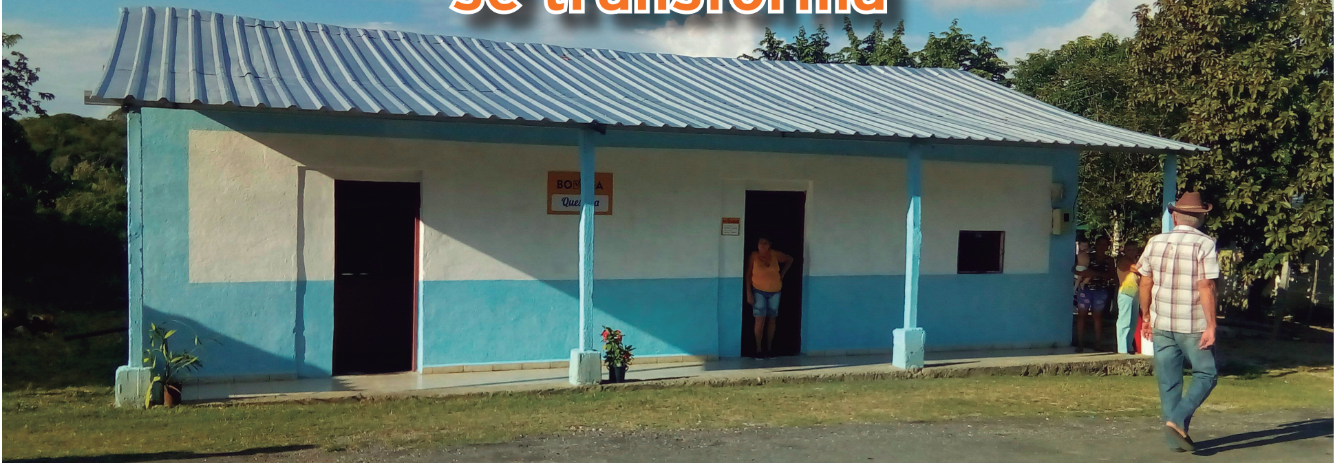
La bodega fue objeto de reparación.