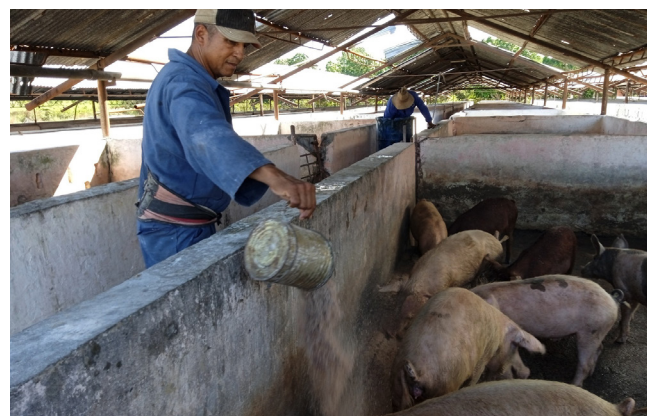
Para la sostenibilidad de la masa porcina es determinante la elaboración de pienso criollo con recursos propios.

Por lo pronto, los agropecuarios aquí se aprestan a culminar el año con saldos favorables en todos los indicadores, sin dejar de mencionar, como bien lo señala su director, el aporte de la brigada de jardinería encargada de las áreas verdes del hotel Faro Luna, el vial Refinería-Petrocasas y la rotonda de Yaguaramas.