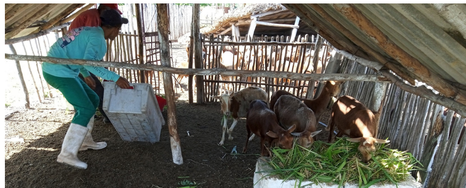
El manejo del ganado menor del módulo pecuario garantiza la buena salud y alimentación de los animales.