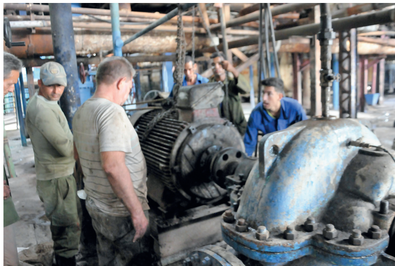
Bajo el techo del ingenio Ciudad Caracas, el ajetreo no para, y tal es el caso del mantenimiento de motores eléctricos en el área de fabricación.