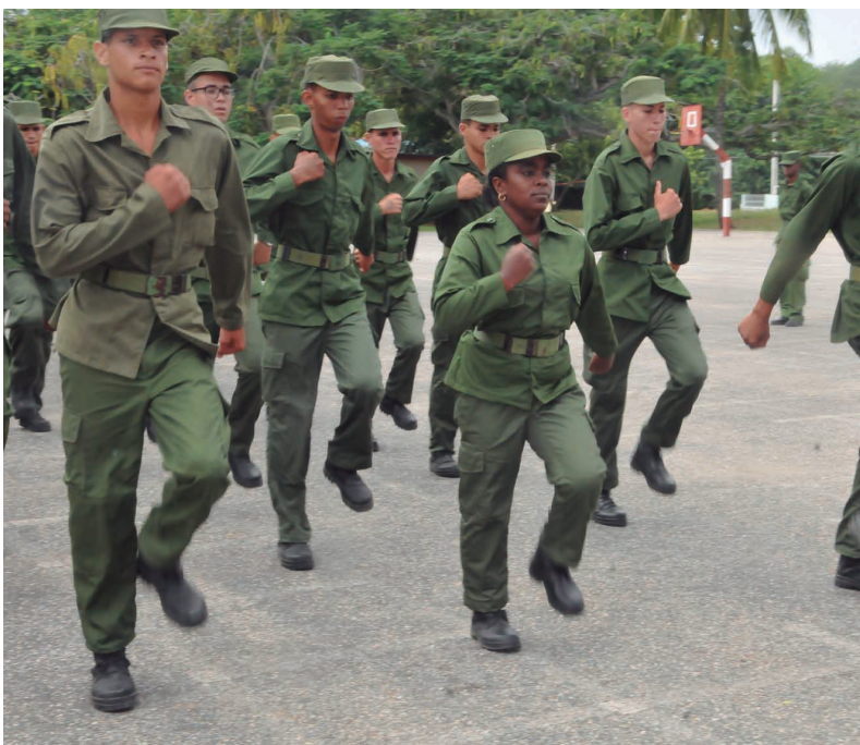
En la Escuela de Preparación, hembras y varones comparten el mismo rigor del entrenamiento y disciplina militares.