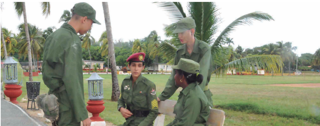
En el campamento, los jóvenes siempre buscan los ratos libres para el esparcimiento y la amena conversación.