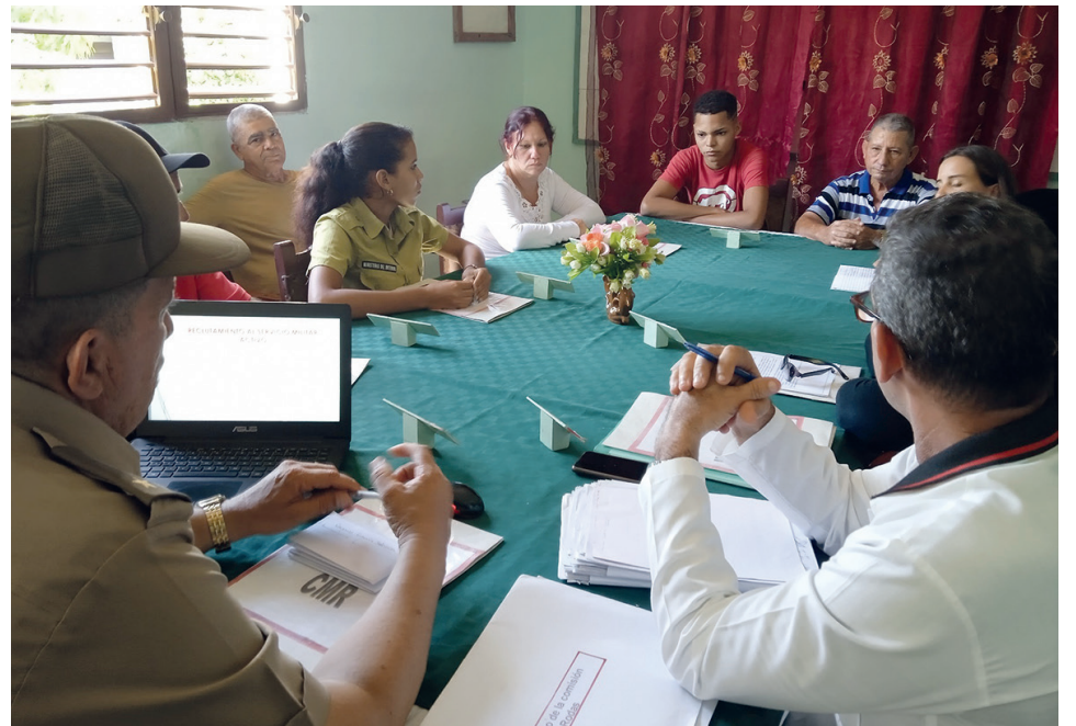
La comisión multisectorial de Reclutamiento del municipio de Rodas tiene entre sus funciones previas al llamado al SMA, la entrevista al joven y su familiar.

Las Fuerzas Armadas no solo representan el crisol para la formación de valores y principios patrióticos y revolucionarios, sino además la posibilidad de prepararse en el