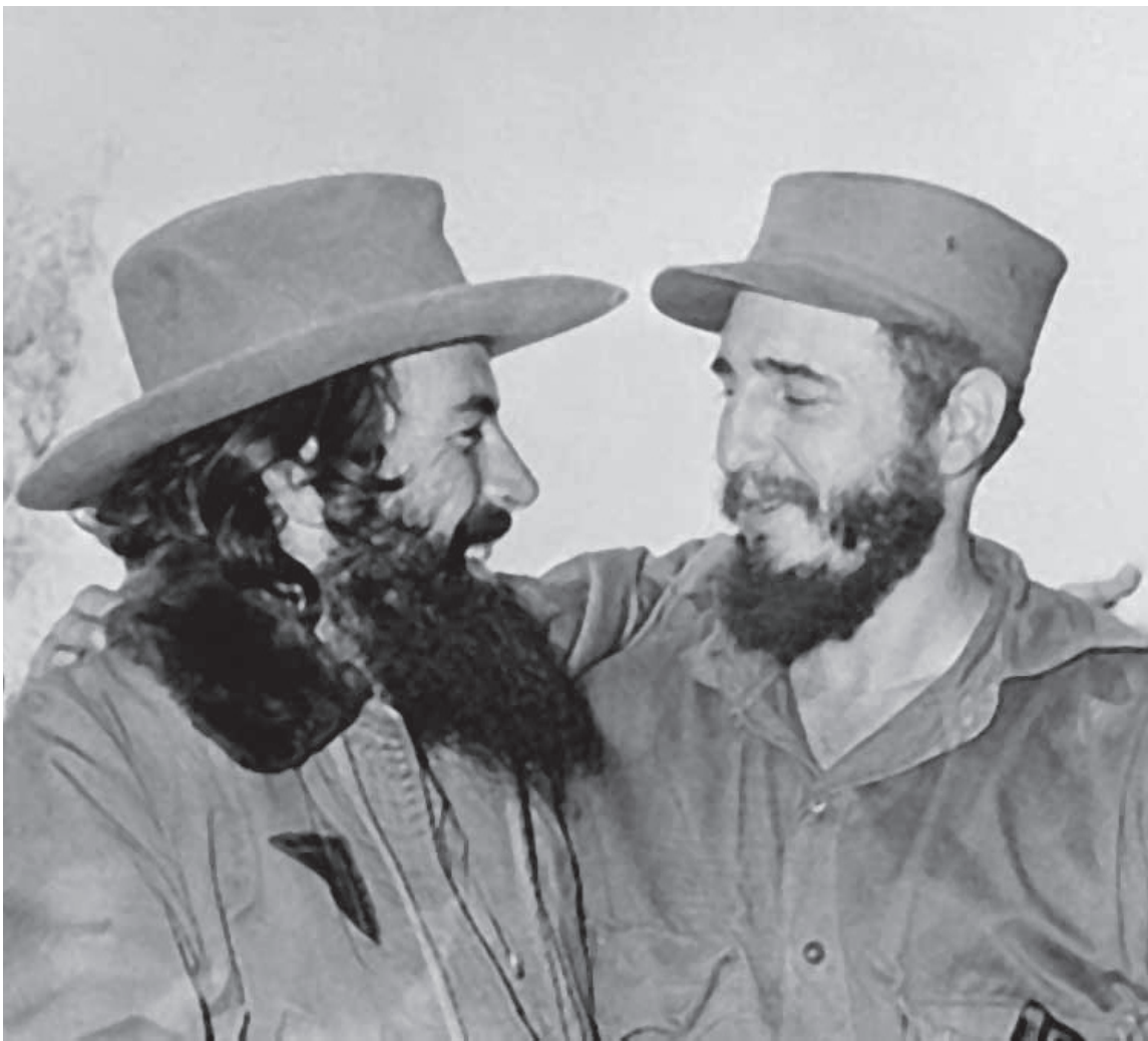
A Camilo Cienfuegos y Fidel no solo los unió el compromiso histórico, sino además una entrañable corriente de simpatía y la más sincera amistad.