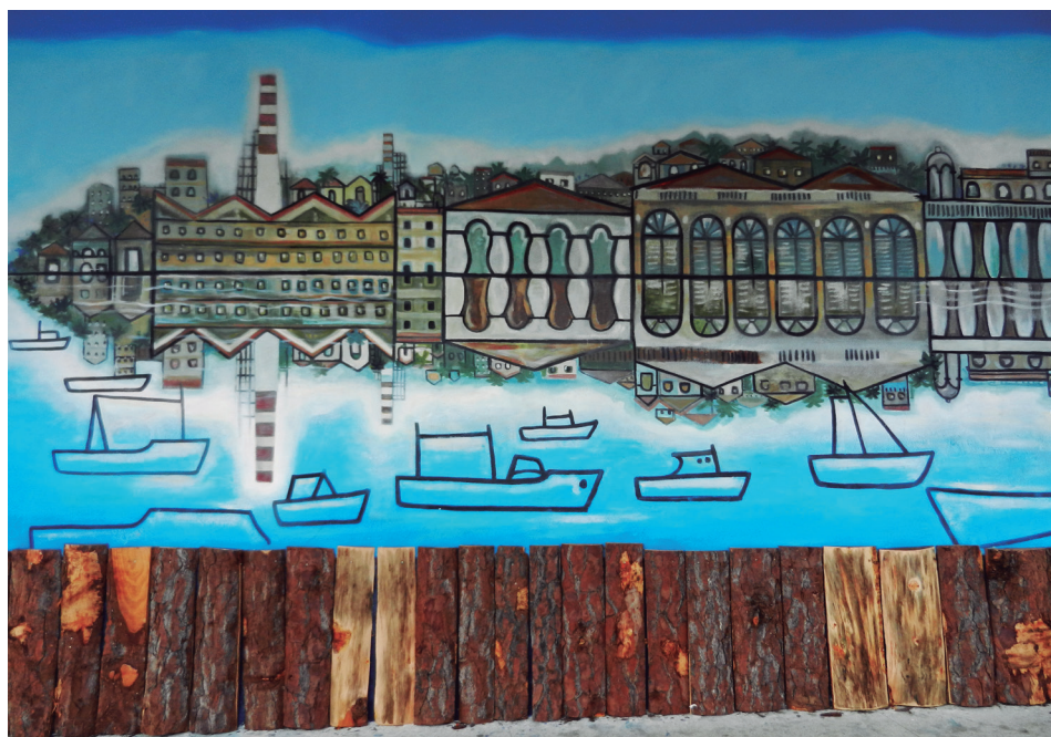
Observe la diferencia de color entre los tablonces.

Es increíble hasta dónde pueden llegar la desidia y el desamor de los depredadores urbanos en Cienfuegos, que amparados quizás en las sombras, la madrugada y la falta de control constante, agravan lo que esté a su alcance. En ese caso se encuentra el maderamen en la parte inferior del recién restaurado mural de Leandro Soto, destacado artista cienfueguero de la plástica, fallecido hace poco más de un año. De la totalidad de los pedazos de madera (87) que cubren esa zona, 36 de ellos han sido desbastados total o parcialmente (hasta el cierre de esta edición), lo cual daña la visualidad que brinda esa hermosa obra de arte, que tanto talento, esfuerzo y recursos demandó para su resurgimiento. Jesús "Chucho" Rebull, quien asumiera con pasión y constancia una vez más la renovación pictórica de ese colorido "lienzo ciudadano", al ser preguntado sobre el tiempo de vida que le daba, fue enfático: "(...) el elemento destructor no va a ser el ambiente, sino la gente...". Los cienfuegueros de corazón y alma no podemos permitir que esos indolentes aniquilen impunemente los símbolos identitarios, culturales y patrimoniales de la bien llamada Perla de Cuba.