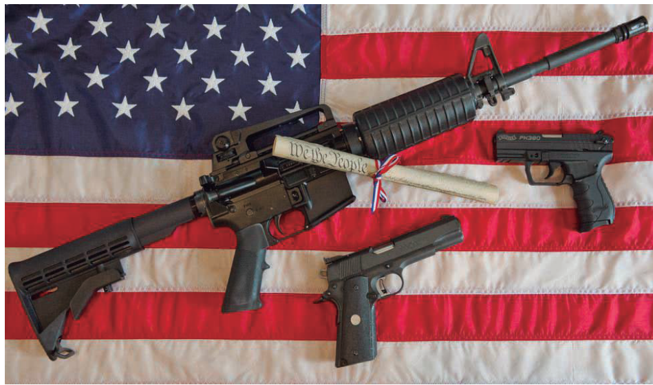
Esta ilustración fotográfica muestra un rifle semiautomático Colt AR-15, una pistola semiautomática Colt .45, una pistola semiautomática Walther PK380 y una copia de la Constitución de los Estados Unidos.

por asesinato, homicidio, disparos accidentales y otras causas (para un aproximado de 52 muertes cada día). Entre tantos decesos, se registran los de mil 405 menores de edad (246 en el rango de cero a once años, y mil 159 en el de doce a 17). Además, se han producido 566 tiroteos masivos.