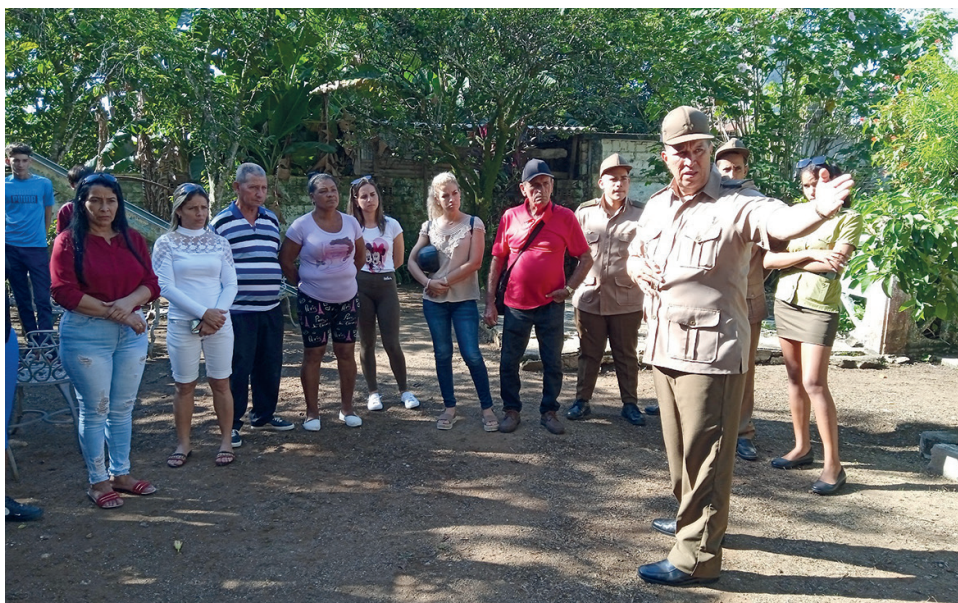
Jóvenes y familiares reciben una detallada información de los deberes y derechos a partir de quedar reclutados para el SMA.