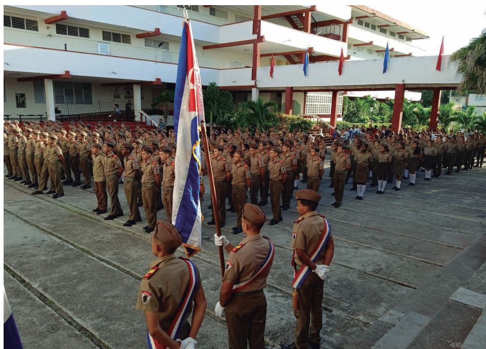
Los “Camilitos” constituyen la principal cantera de futuros oficiales de las Fuerzas Armadas Revolucionarias.