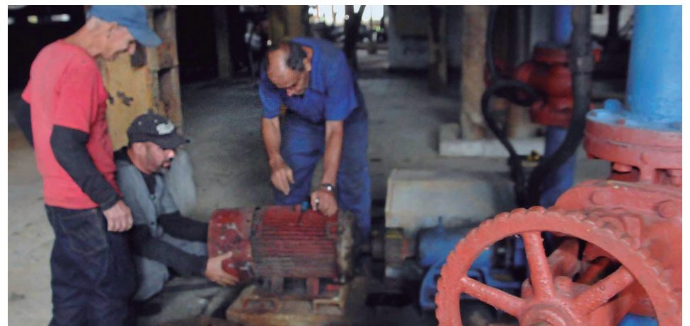
En cada rincón del central se ultiman detalles en el alistamiento de los equipos industriales.