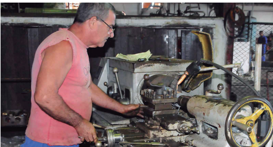
Las iniciativas de los miembros de la ANIR en el ingenio constituyen un apoyo fundamental en la confección de piezas y agregados.