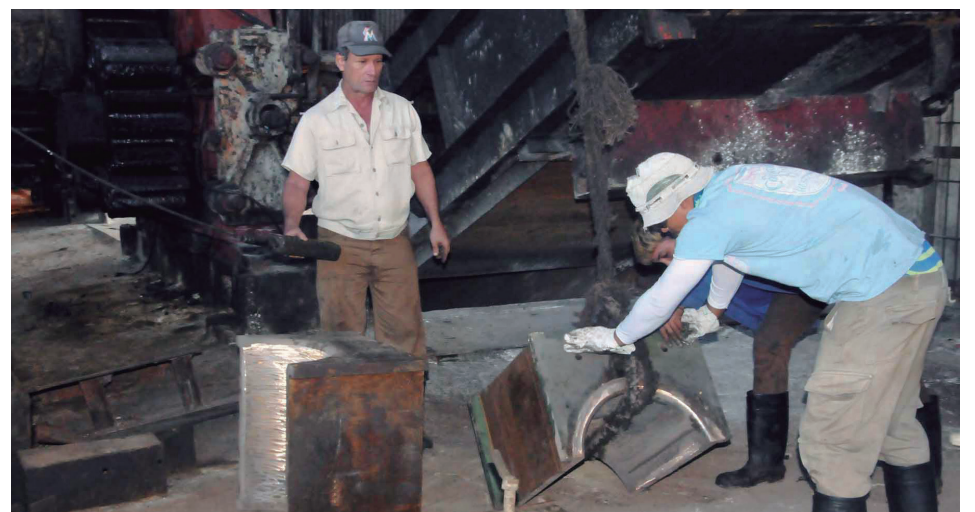
En el área de los molinos y el basculador se concentran los trabajos más complejos en las reparaciones.