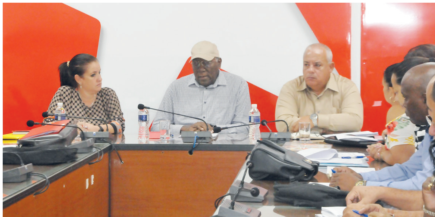
Junto a las máximas autoridades de Cienfuegos, Valdés Mesa reflexionó sobre la necesidad de consolidar los órganos locales de Gobierno.

Buena parte del análisis lo ocupó la producción de alimentos, a tenor de la Ley de Soberanía Alimentaria y Seguridad Alimentaria y Nutricional. Acerca de la misma, Valdés Mesa insistió en las urgencias de que la agricultura, fundamentalmente, asuma la responsabilidad de cubrir productos de la canasta familiar normada que hoy tienen que