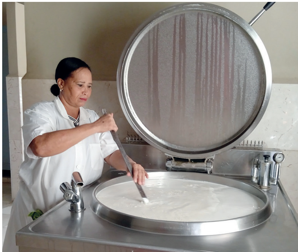
La minindustria láctea, dulces y conservas, forma parte de la nueva estructura.