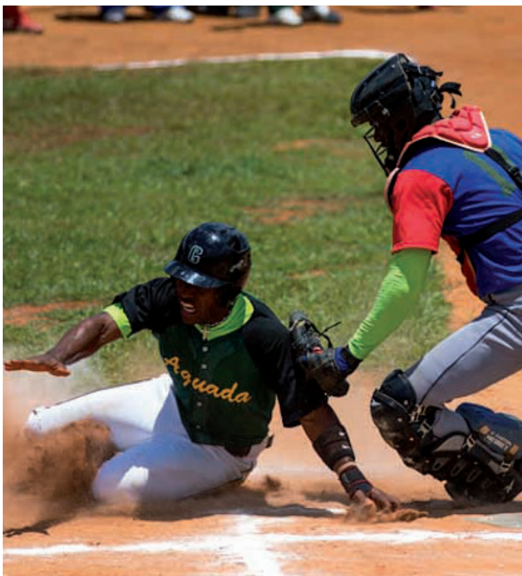
Aguada de Pasajeros es el actual campeón provincial.