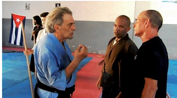
El sensei reconoce sentirse a gusto en Cienfuegos.

portancia de la visita "es que fue el primer maestro de aikido en examinar en ese arte marcial en Cuba, en el año 1997, y eso es un gran honor para Cienfuegos".