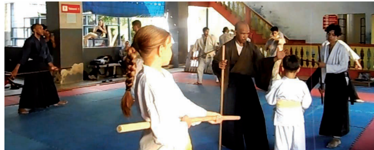
Practicantes de varias provincias participaron en el Seminario.