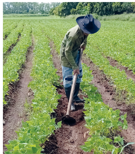
Los campesinos asociados a las cooperativas de Créditos y Servicios en la región constituyen la principal fortaleza de la agricultura.