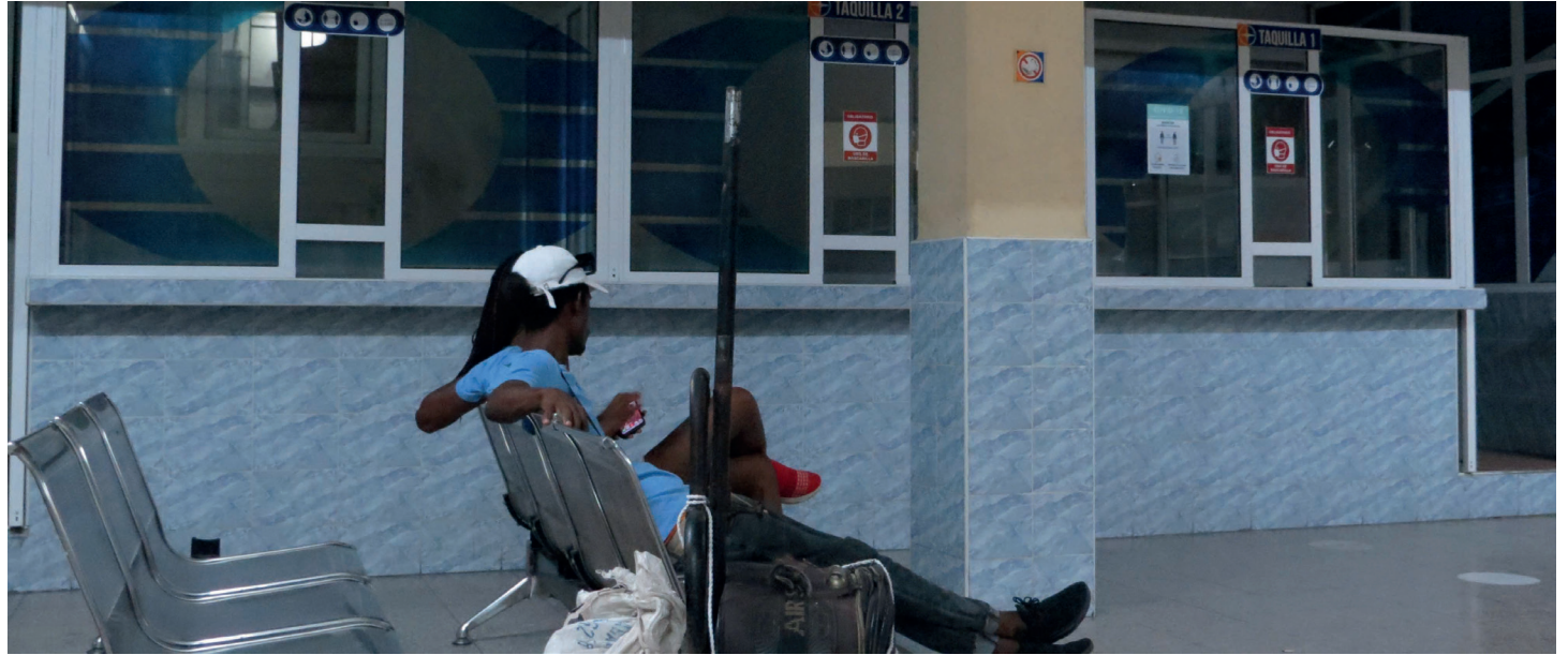
La población acude en vano a las taquillas del primer nivel en la terminal de ómnibus de Cienfuegos, pues hace meses están inutilizadas.

Hasta el sol de hoy, en ninguna de esas plazas y mucho menos en la terminal provincial, sita en la concurrida calle Gloria, se ha cumplido la promesa del directivo. Este periodista ha tenido la dicha o la desgracia de estar en esos establecimientos sistemáticamente y comprobarlo. Con más ahínco en la Estación de Ómnibus de la ciudad, que carece de un cartel informativo —de manera formal— que oriente tanto a los pasajeros nacionales y extranjeros que viajan dentro del perímetro de Cienfuegos, como aquellos que usan las yutones para trasladarse a otras regiones del país.