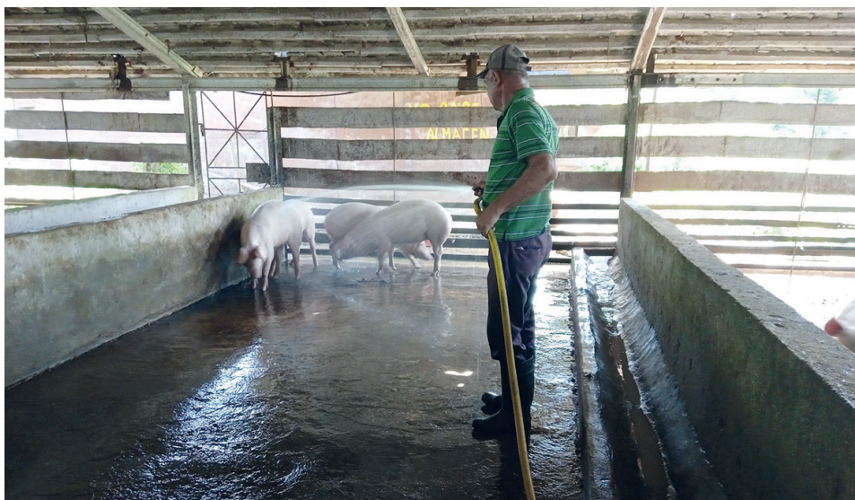
El desarrollo de la producción porcina forma parte de las estrategias de las bases productivas en Aguada.

En tanto, les queda por incrementar la producción de viandas a partir del uso más eficiente de las tierras, incluyendo las actuales ociosas o poco explotadas. Ambos retos fueron planteados recientemente por el vicepresidente cubano, Salvador Valdés Mesa, quien manifestó que Aguada estaba en línea con la seguridad alimentaria.