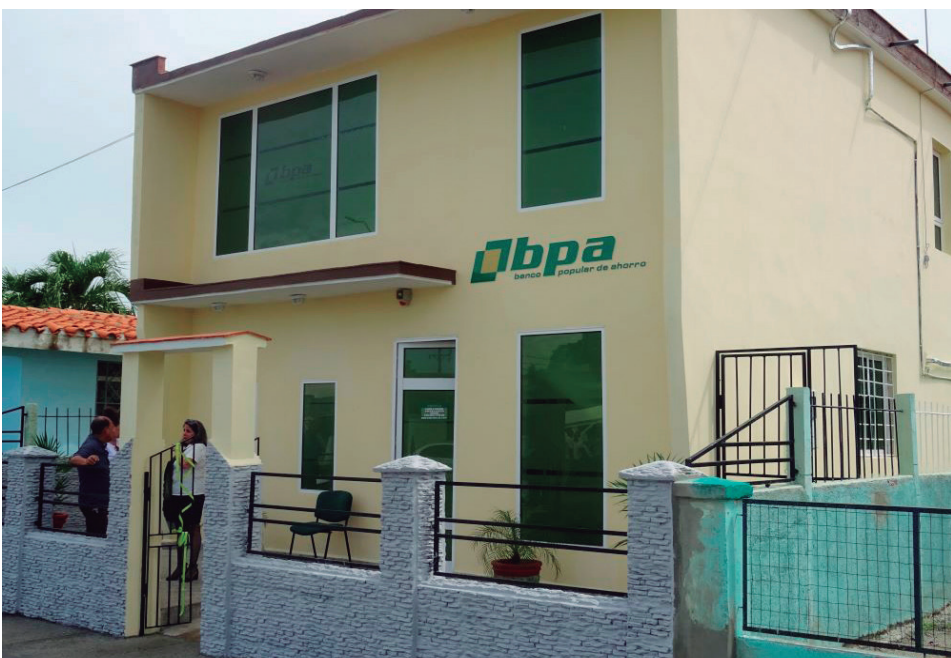
La nueva oficina bancaria comenzará a prestar servicios el lunes 16 de octubre.