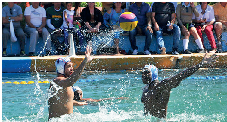
El polo acuático vuelve a ser una de las disciplinas con mayor participación de cienfuegueros.