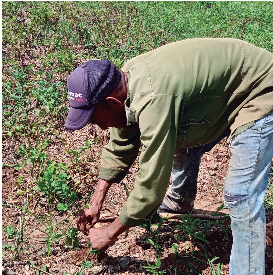
En tierras del asentamiento montañoso de El Naranjo productores cosechan papa fuera de época.

En el pasado mes de agosto plantaron la semilla, luego de su preparación en una nave cercana, y ya en octubre pueden verse los primeros vestigios de una cosecha que contribuirá al autoabastecimiento de estas