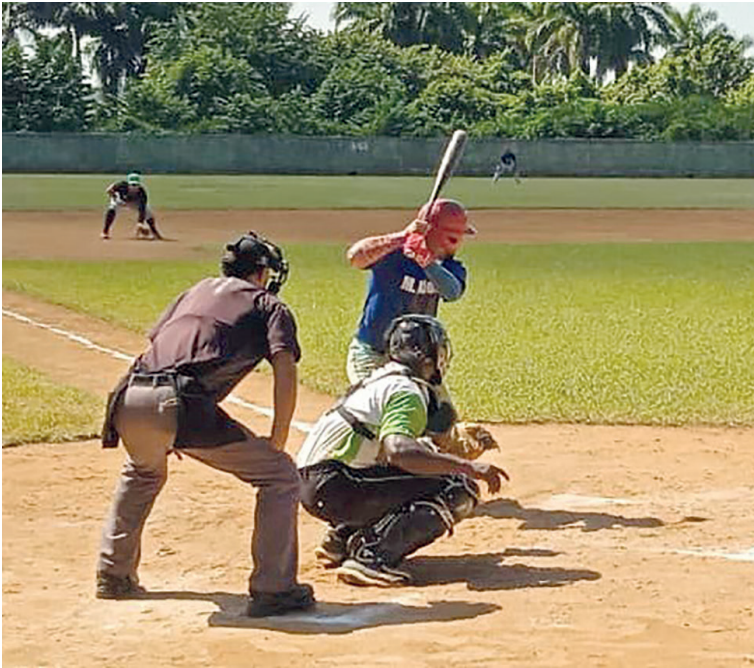
"14 de Julio" aspira a su cuarta corona nacional.