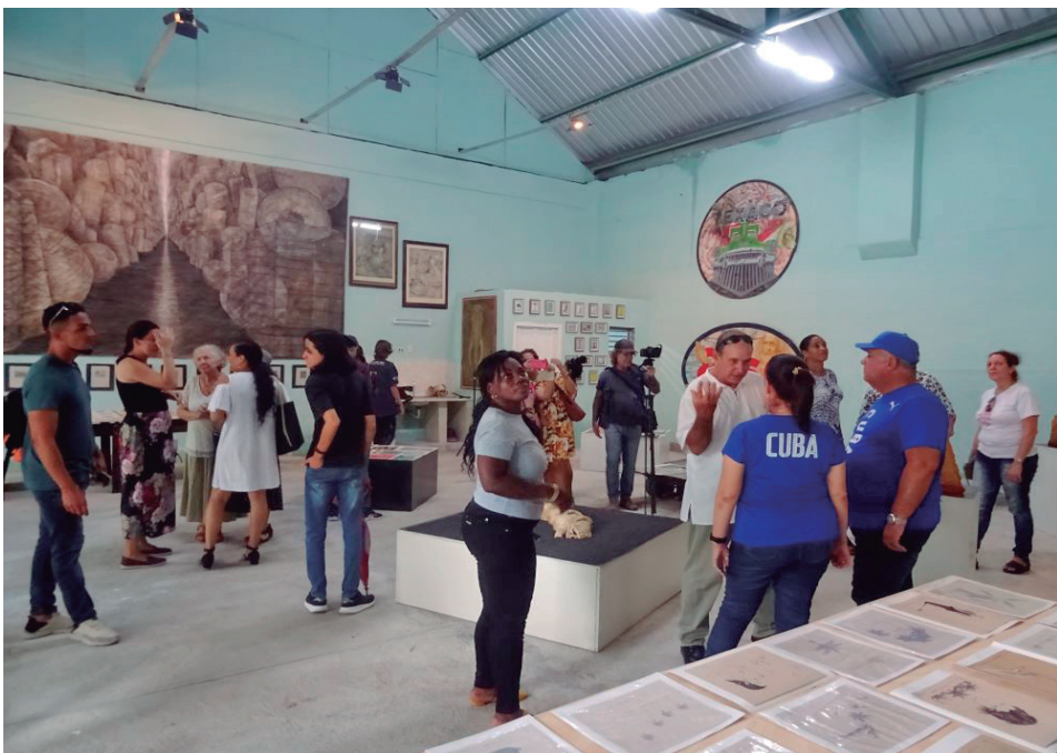
La inauguración del Taller de los Artistas en Cienfuegos celebra el inicio de las actividades por el Día de la Cultura Cubana, el próximo 20 de octubre.

Al decir del creador, el mural transmite un mensaje de unidad al pueblo en momentos difíciles y revitaliza un espacio público importante, a la entrada de esta urbe bicentenario.