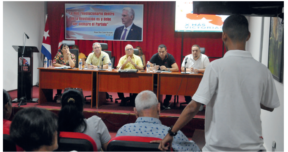
En el debate se registraron valiosas intervenciones.