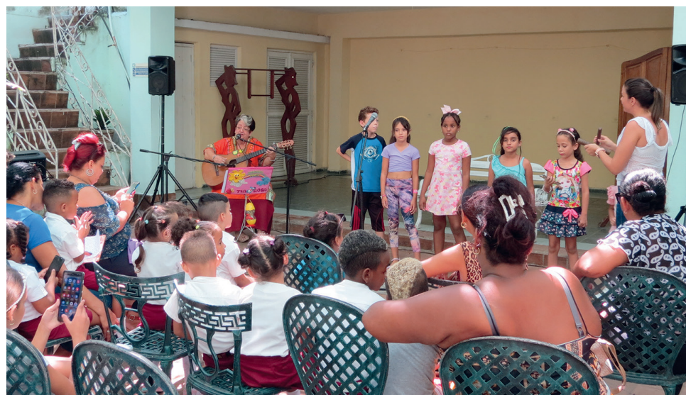
La Peña Parampampín se realiza todos los primeros jueves de cada mes.

zación del poema de Nicolás Guillén, Palma sola , el cual contiene un hondo sentido de cubanidad.