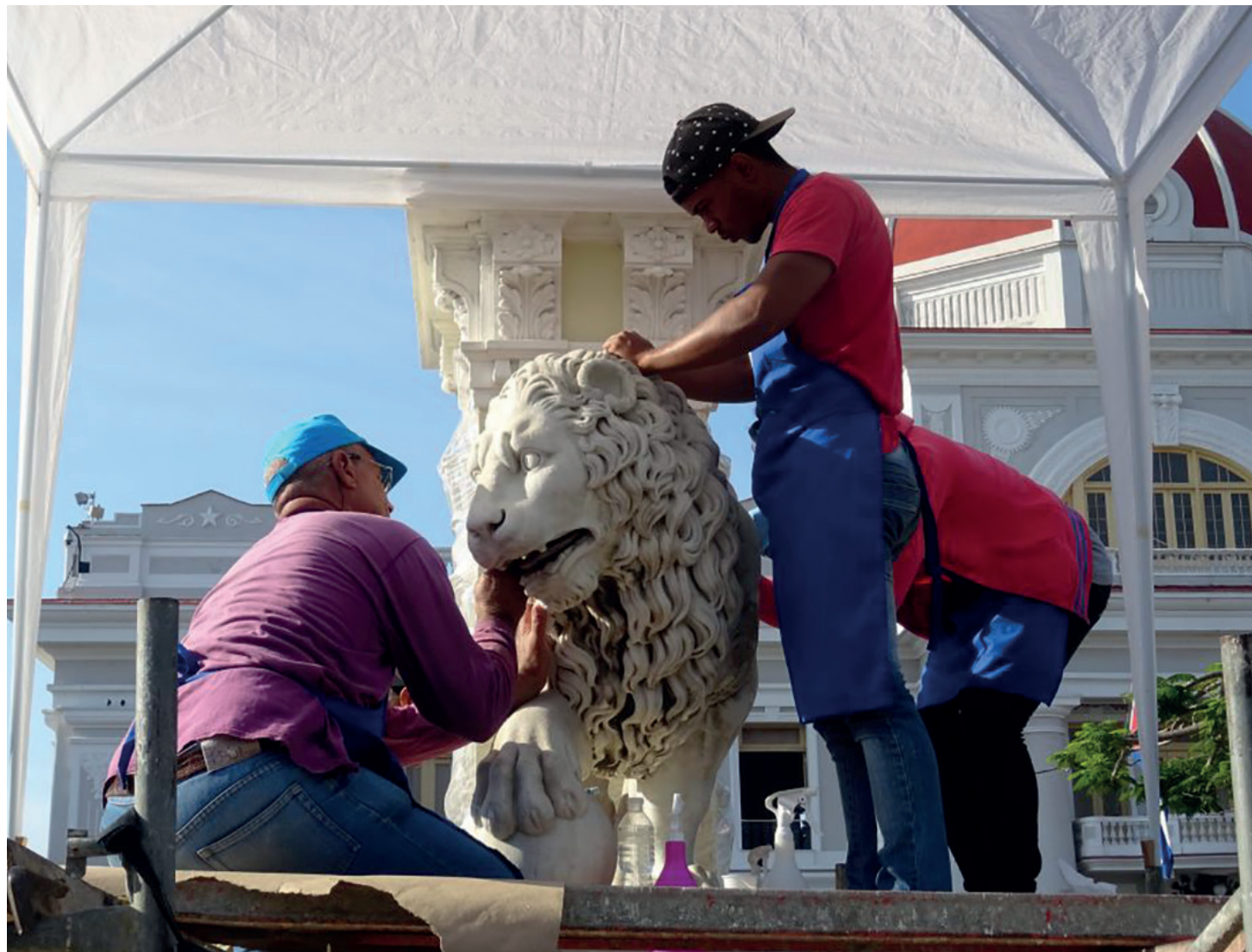
Estudiantes de la Escuela de Oficios participaron en la restauración de los leones del parque Martí, el pasado mes de marzo.