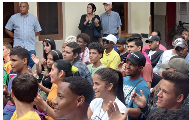
Momentos de la celebración por los tres lustros del centro, acontecida el jueves de la anterior semana.