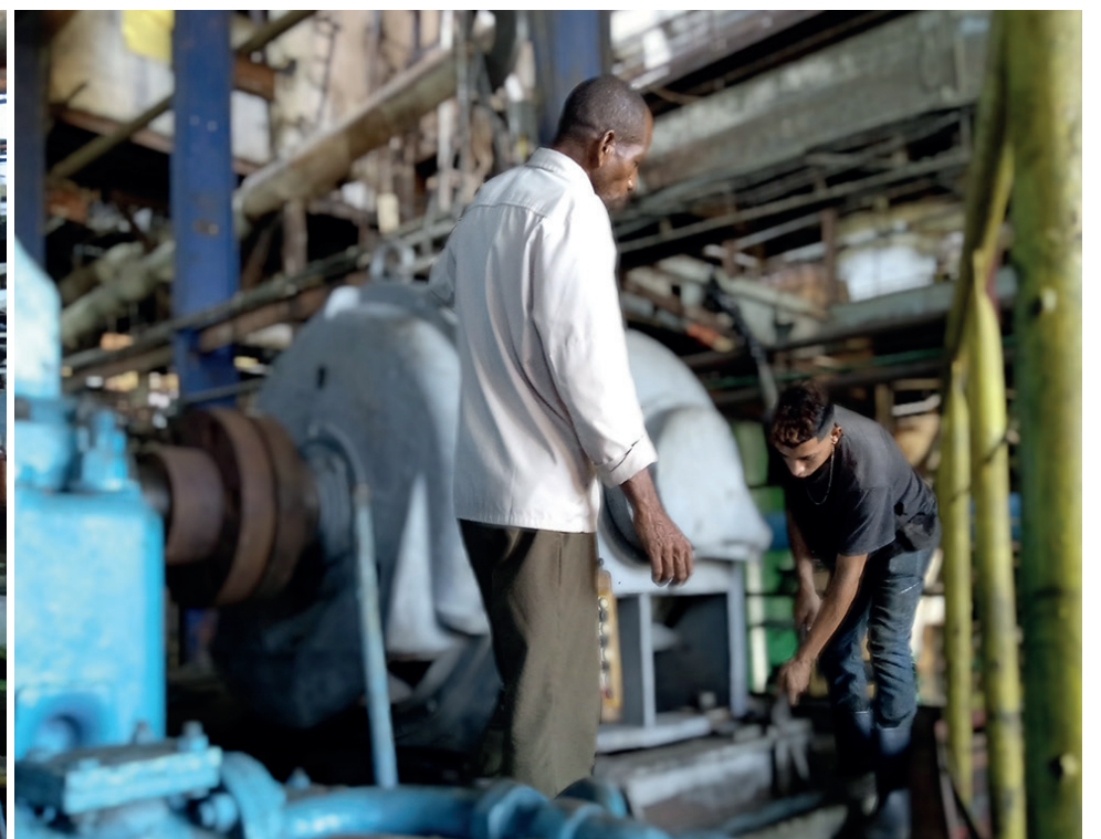
En el área de los molinos se intensifican los trabajos de mantenimiento y reparación del equipamiento del tándem.