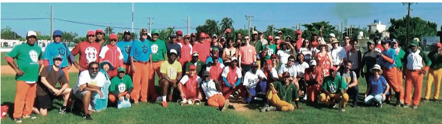
La foto para el recuerdo.

También aprovecharon la ocasión para realizar un donativo de pelotas, indispensable para garantizar la continuidad de esta excelente idea. (C.E.CH.H.)