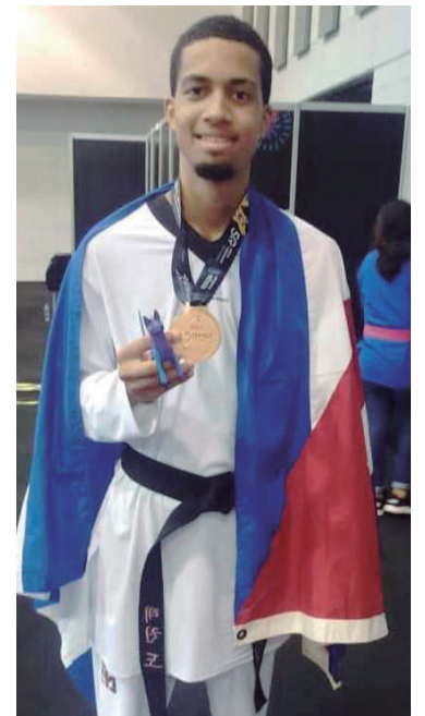
El desempeño garantizó al sureño un cupo para los Juegos Parapanamericanos de Santiago 2023.

naron cupos directos a los Juegos Paralímpicos de París 2024, convocatoria que pondrá diez títulos en concurso, cuatro más que en Tokio 2020. (Tomado de Jit)