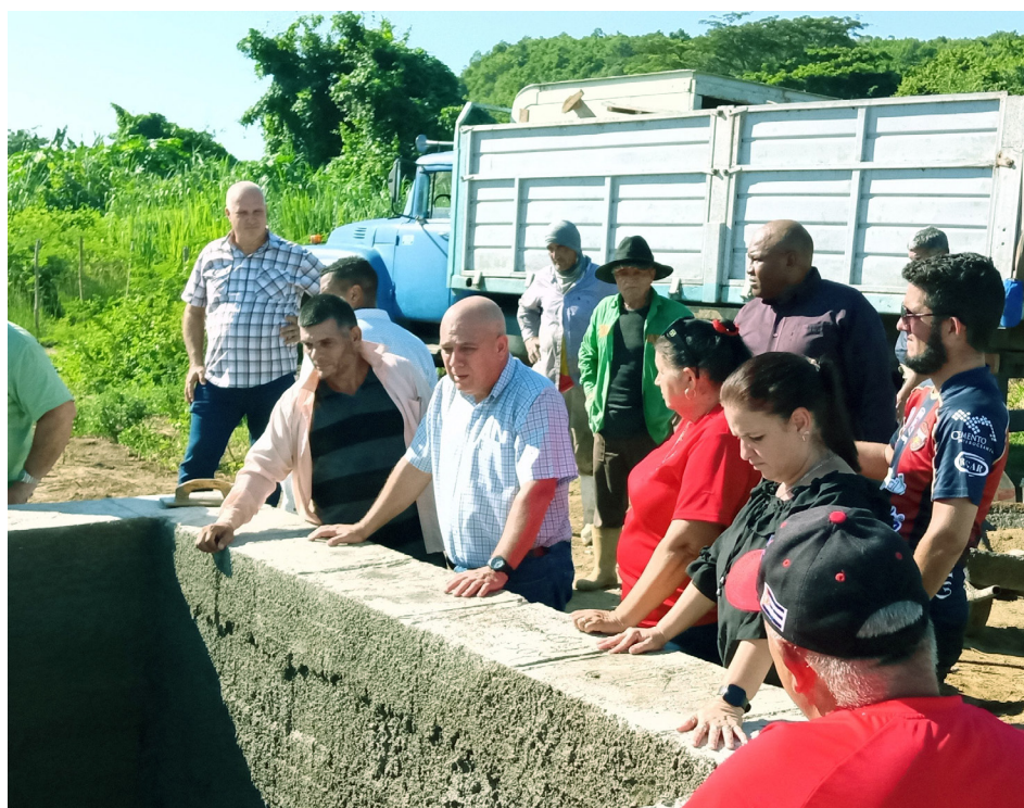
El Secretario de Organización del Comité Central del Partido visitó diversos puntos de dicha económica y socialmente significativa inversión.

Beneficiados por nuevos servicios de bodega, consultorio, vías de transporte para los escolares, acometidas y otras bondades, los pobladores de La Milpa aún afrontan el problema