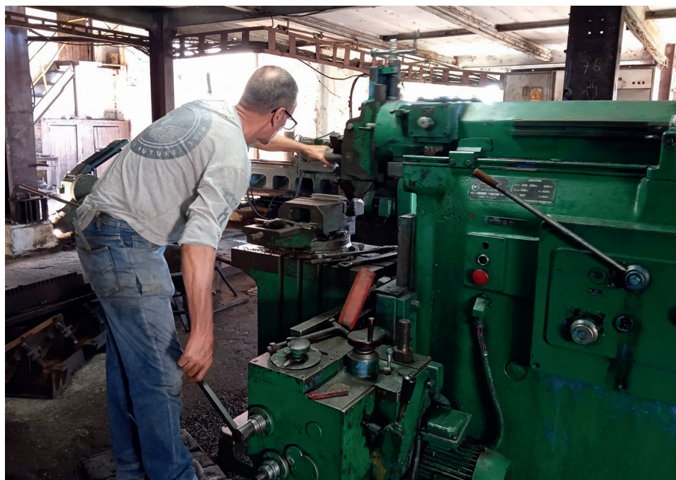
El taller de maquinado ha sido clave en la elaboración de piezas de repuesto y otros dispositivos de la maquinaria industrial.

Con todo casi listo, los trabajadores del "14" se preparan para una vez más darle el alegrón a los coterráneos sureños del cumplimiento del plan de producción de azúcar, con el regocijo adicional de saberse protagonistas en garantizar la canasta básica del dulce a los consumidores de la provincia de Cienfuegos y del municipio especial Isla de la Juventud.