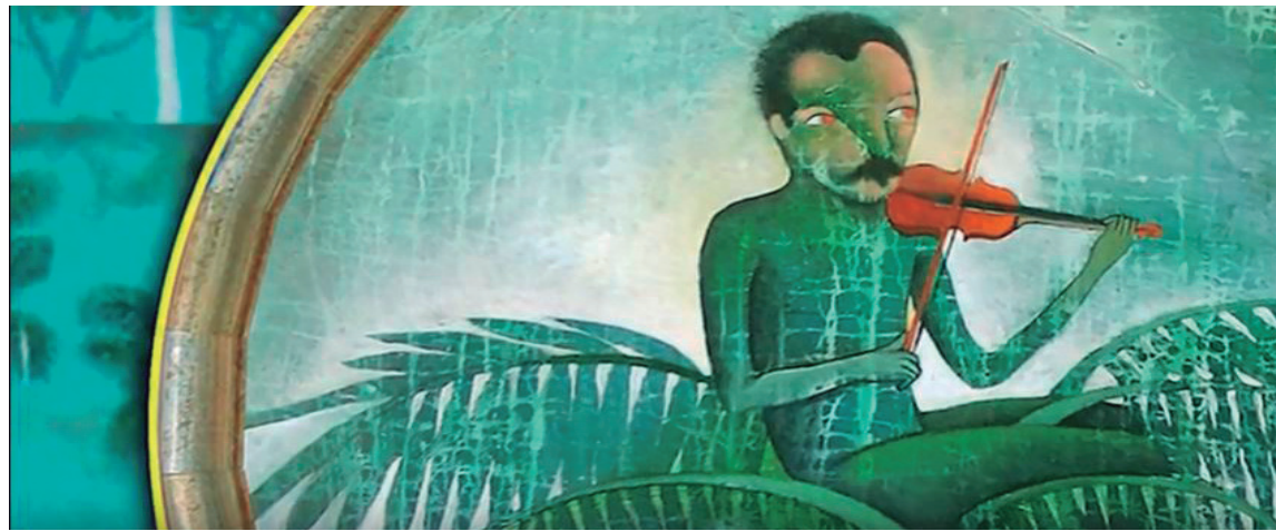
Obra visual Dos patrias tengo yo, Cuba y la noche , de Vicente Rodríguez Bonachea.

Uno de los aspectos que más llama mi atención en la obra de José Martí es su exquisita sensibilidad, la manera de adentrarse en los misterios de la vida y del arte y dejarse sorprender, arropar, hasta penetrar más allá del velo de lo visible para descubrir un mundo de sensaciones llenas de toda emoción, que solo un poeta puede plasmar, o tal vez un ser humano con la capacidad única de traducir con palabras aquello que se siente, primera-