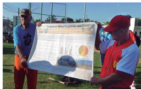
Los visitantes conocieron las particularidades del proyecto.