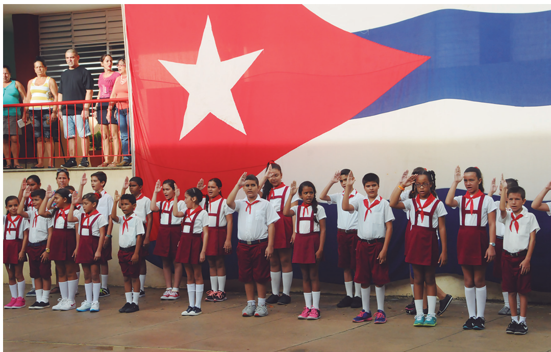
Cienfuegos cuenta con 379 instalaciones educativas y una matrícula total de 56 mil 374 estudiantes.

En este momento, de las inversiones previstas están terminadas siete obras, mientras otras cinco continúan en ejecu-