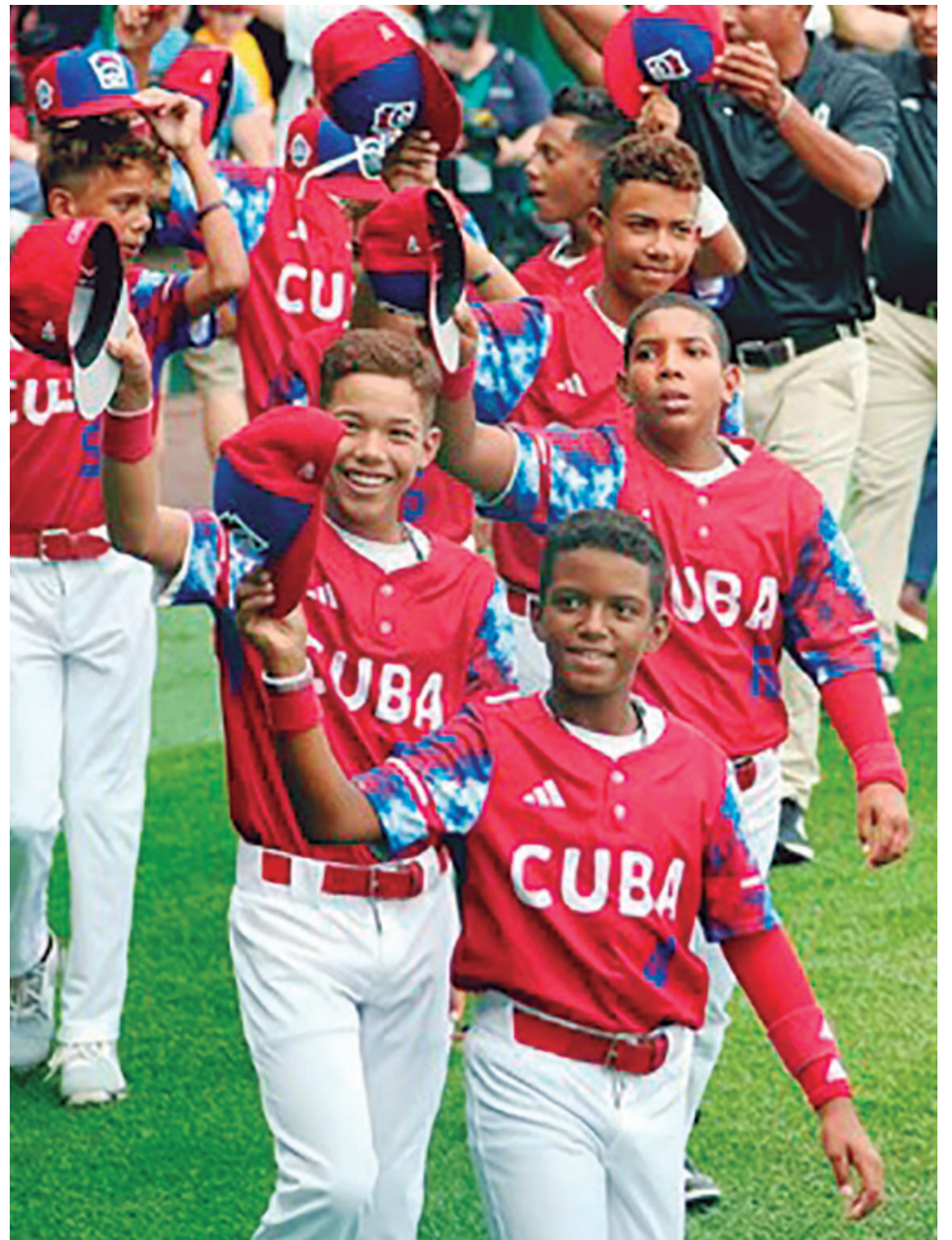
De extraordinaria se califica la actuación de los representantes de Bayamo.

Y no solo entrega, alegría y deseos de ganar mostraron sobre la grama, sino también disciplina técnico-táctica, conocimientos de los