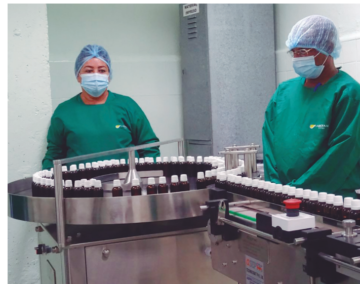
La planta de homeopáticos, de Labiofam Cienfuegos, tiene capacidad tecnológica para producir 5 mil frascos diarios.

Desde que en 2011 el Centro para el Control Estatal de Medicamentos y Dispositivos Médicos otorgó al Vidatox 30 CH su registro sanitario (renovado luego en 2016 y 2021), el enclave de homeopáticos de Labiofam Cienfuegos alcanza una producción diaria de 5 mil frascos,