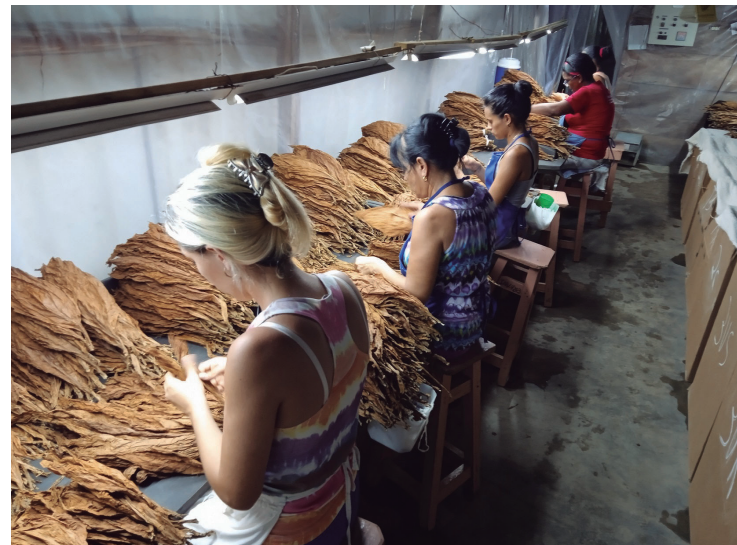
Un grupo de experimentadas tabacaleras se dedican a la selección de las hojas para capa de exportación.

“Por lo pronto, sentencia el emprendedor labriego, vamos por más en la venidera campaña. Ya estamos pasando la picadora como parte de la preparación de las tierras con la incorporación de los abonos verdes en los mismos lugares donde habíamos plantado frijol canavalia que, como se sabe, aporta fósforo, nitrógeno y potasio a los terrenos”.