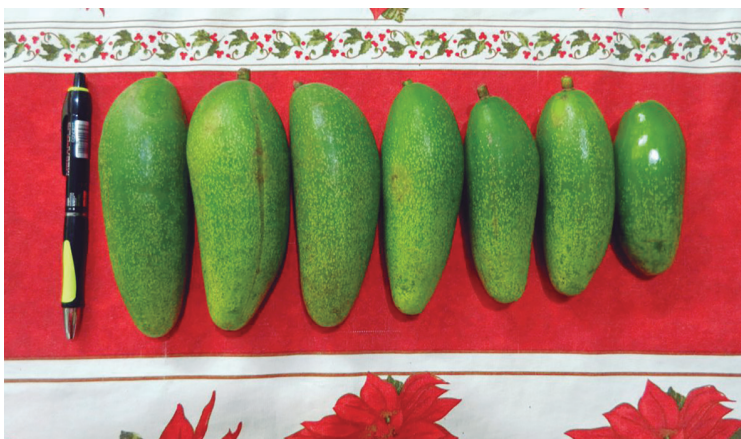
Comparación de los “pepinos aguacates” con la longitud de un bolígrafo.

Si alguien más posee un aguacatero de este tipo en la provincia cienfueguera, o en Cuba, pues hágalo saber, porque simplemente posee una joya, una rareza del reino vegetal.