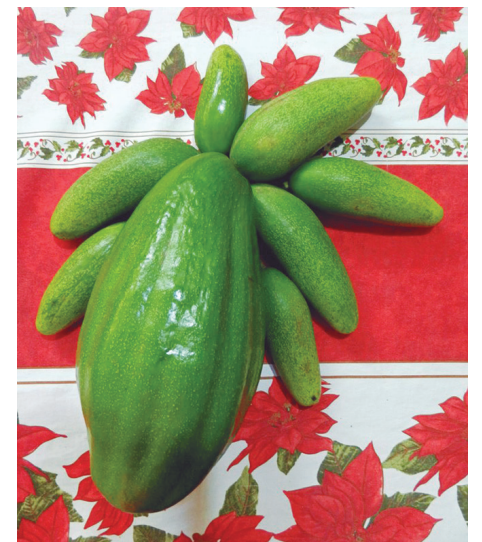
Cuando están juntos sobre la mesa, se pueden apreciar las distintas dimensiones de los frutos.