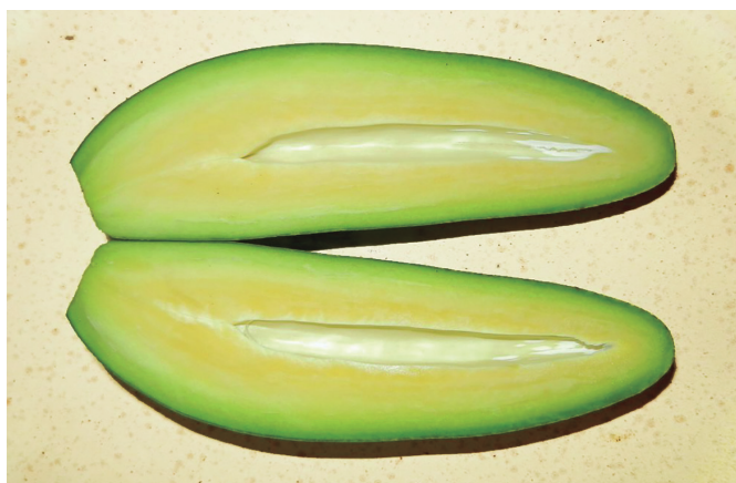
Un ejemplar del llamado aguacate Cocktail o Dátil cortado por la mitad con ausencia total de semilla o hueso central.