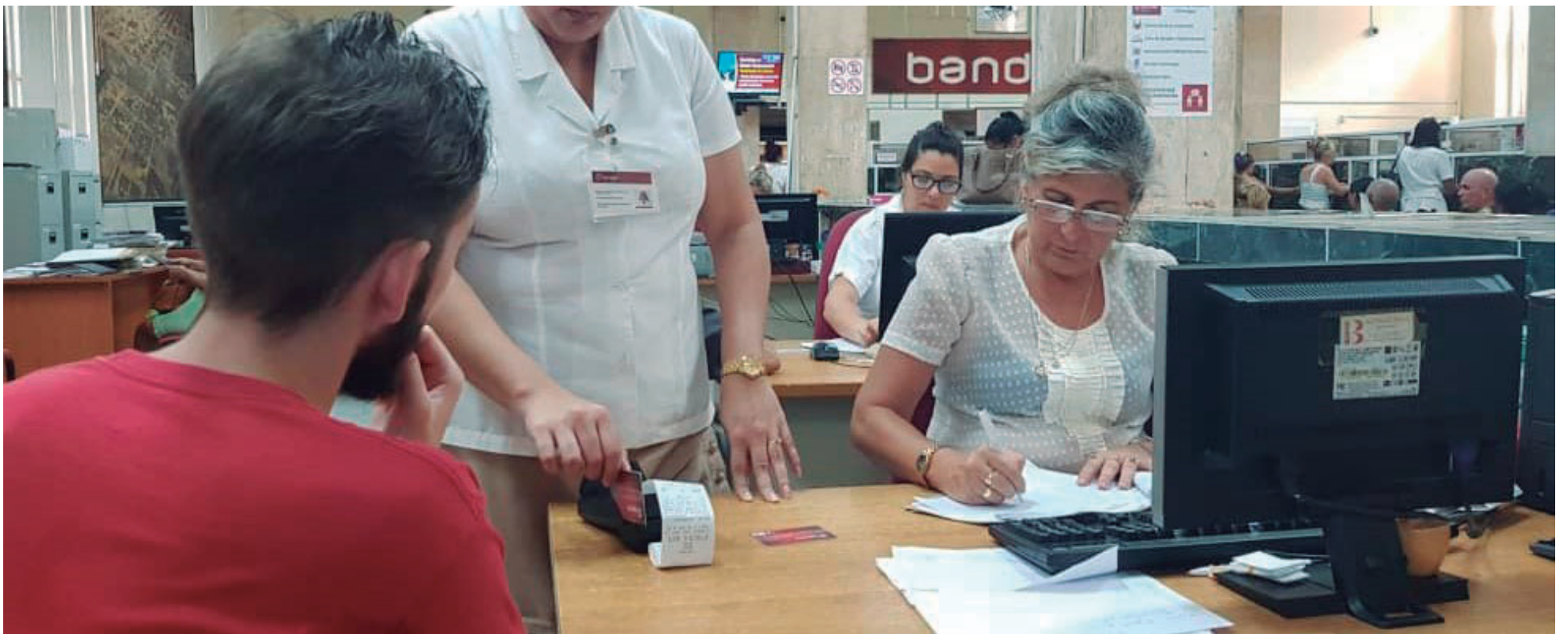
La tarjeta magnética constituye un medio de pago, pero ello requiere condiciones tecnológicas.