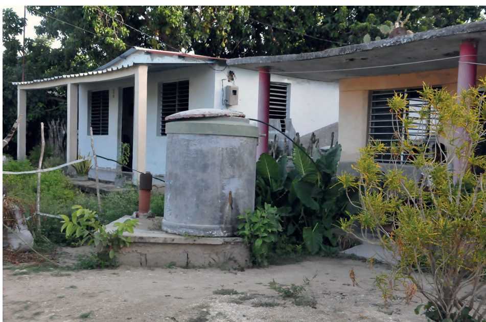
Mayor cantidad de agua y por más tiempo es el beneficio principal del cambio de matriz.