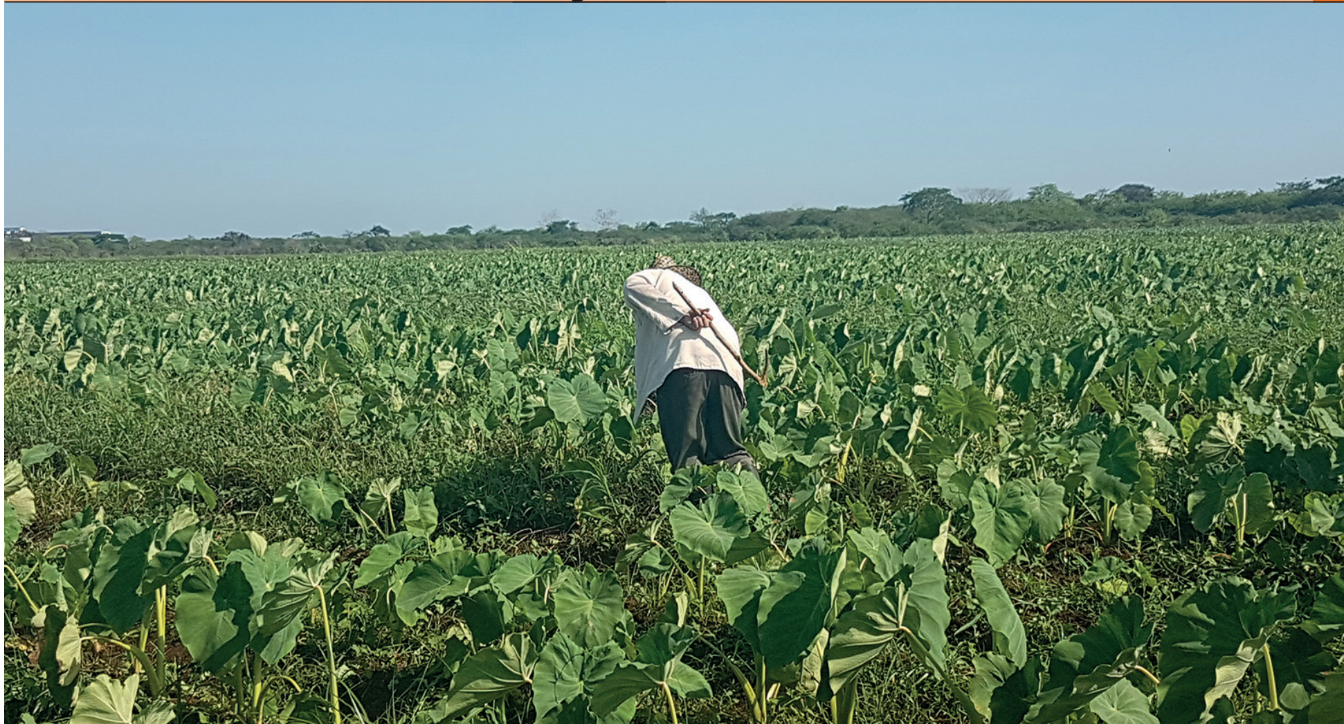
Los productores agropecuarios son comúnmente afectados por los problemas de la contratación económica.