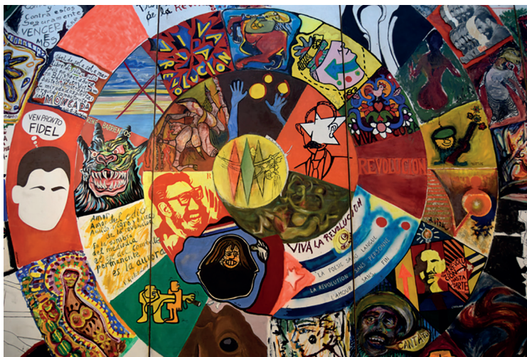
Mural "La gran espiral", 1967.

Muchos de los sobrevivientes en la acción fueron capturados después, y torturados. A varios les trituraron los testículos, les arrancaron la visión... Ahí está, por ejemplo, Abel Santamaría, fiel a sus principios sin importar el dolor. Nos parece observar a su hermana Haydée, a quien le enseñaron un ojo de él, y la amenazaron con sacarle el otro si ella no hablaba. La joven amorosa, pero corajuda, respondió con dignidad que si él no dijo nada, ella tampoco. Más tarde le co-