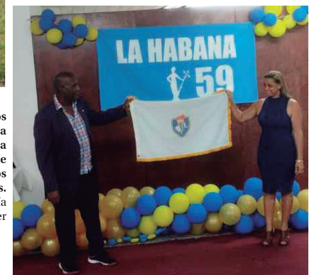
Cienfuegos entrega a La Habana la bandera de los Juegos Escolares.