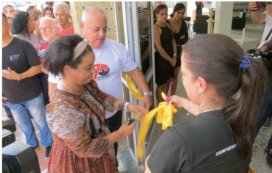
Inauguración de la Librería Ateneo Dionisio San Román.