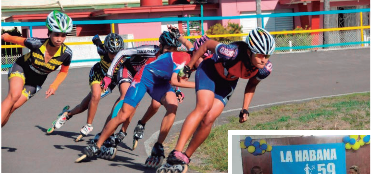
Esta vez el título del patinaje vino para la Perla del Sur.