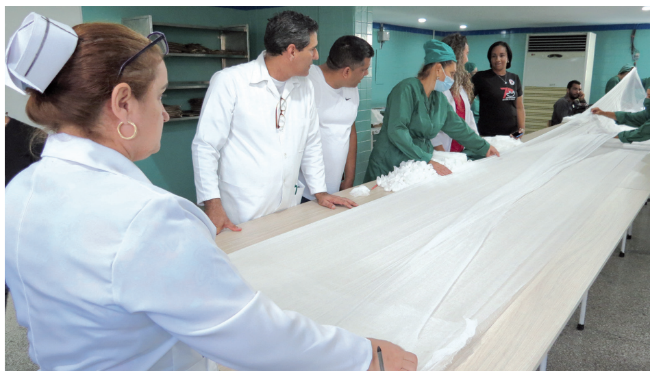
La cortadora de gazas destaca dentro de la Central de Esterilización del Hospital.