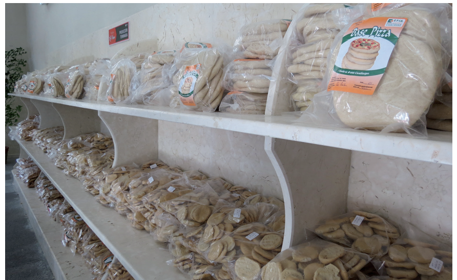
Ofertas en la panadería La Vega.