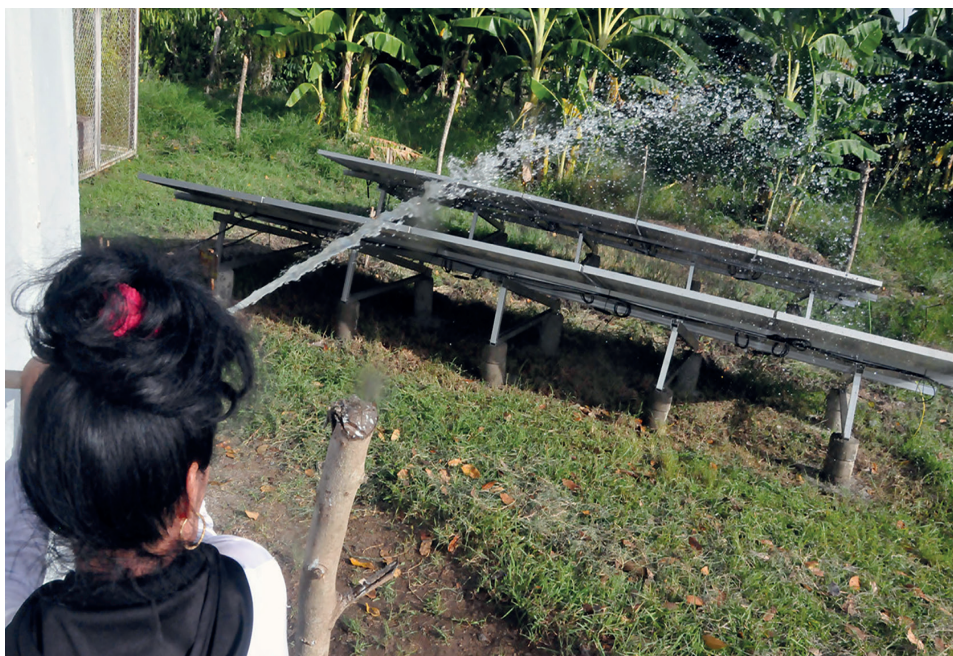
Mantener los paneles limpios garantizará su buen funcionamiento.

Igual satisfacción muestran pobladores de Lajas. Aquellos que se sirven de la EB Campo de Tiro, respiran aliviados al ver por más tiempo el “chorrito” salir de sus llaves. De la misma manera que en Quesada, Espartaco y el resto de las localidades donde se implementa el proyecto de cambio de matriz energética, el sol con toda su fuerza es bien recibido, pues la energía que irradia hace que fluya hasta sus hogares el imprescindible líquido.