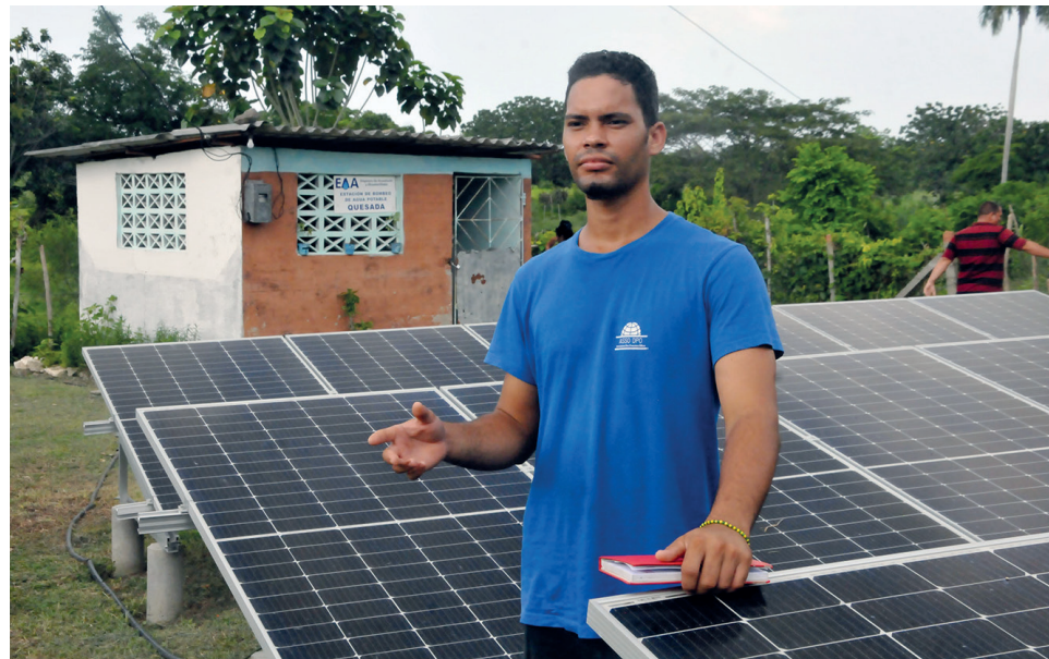
El cambio de matriz energética ha humanizado también el trabajo de quienes operan las estaciones de bombeo.