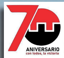
En la Plaza de la Ciudad, los cienfuegueros conmemoraron el aniversario 70 del 26 de Julio.