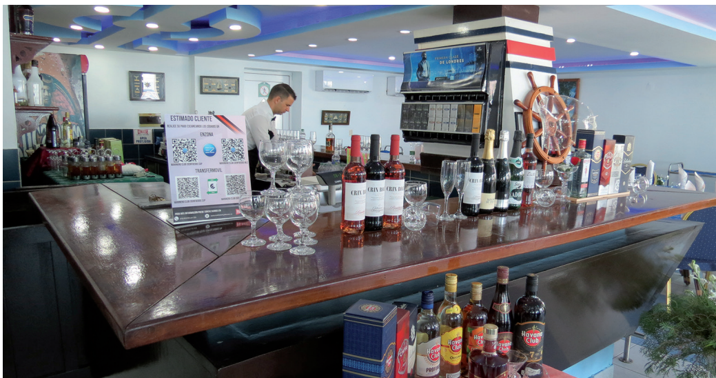
Snack bar del restaurante El Marinero, en el Club Cienfuegos.