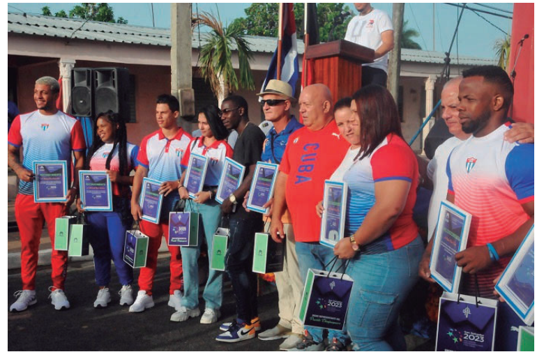
Varios de los cienfuegueros que asistieron a los Juegos Centroamericanos estuvieron presentes en el Acto Provincial por el 26 de Julio.