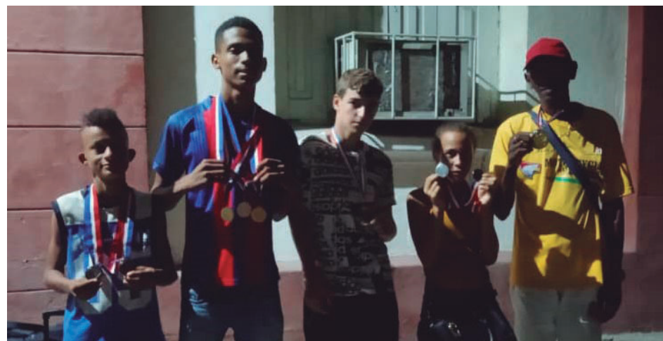
Los representantes del paratletismo hicieron lo suyo.