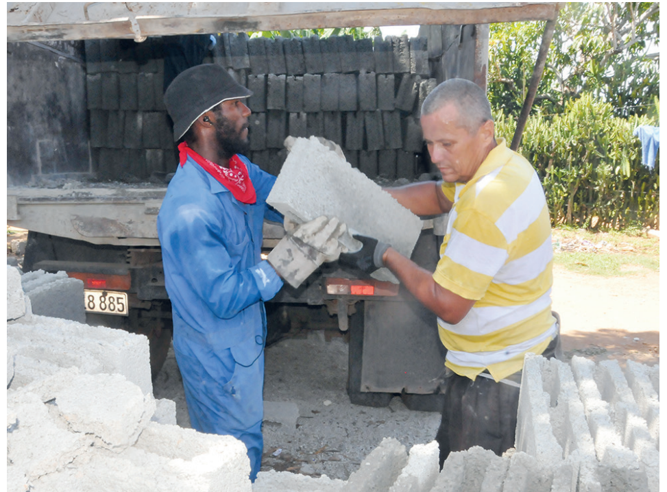
Trabajadores acarrean materiales para la construcción de viviendas en el barrio El Tabaco, en Juraguá.