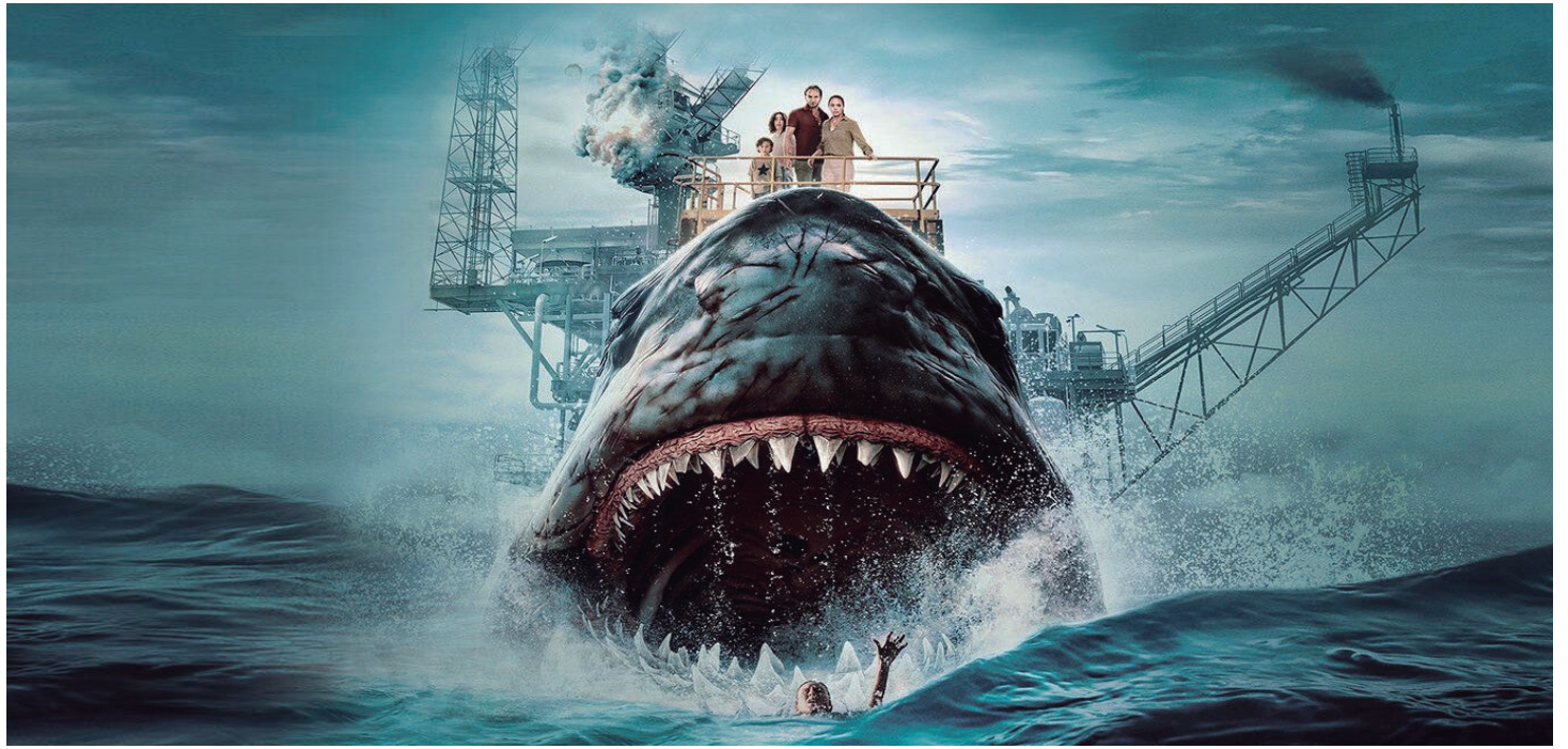
Demonio negro (2023) será estrenada mañana en el espacio televisivo La película del sábado.

Dicha saga de seis películas iniciada por la cadena de televisión SyFy en 2013, con aquellos tiburones que volaban sobre Los Ángeles tras ser levantados del mar por un tornado,