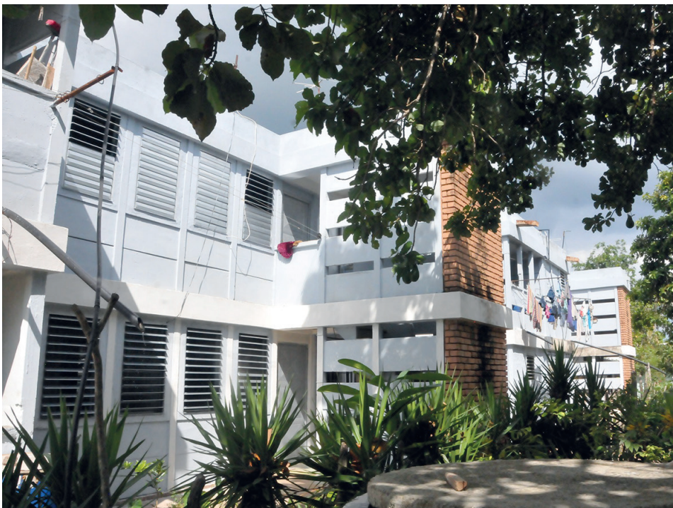
El asentamiento de Las 500 estuvo en el programa de mejoras en barrios con situación de vulnerabilidad.