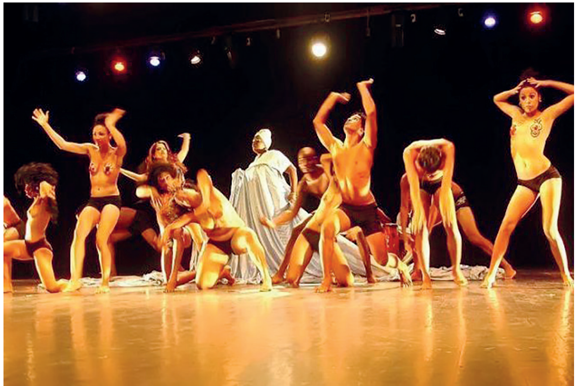
El Conjunto Folclórico de Cienfuegos desarrolla un taller en el cine Jagua.

Otra acción prevista resultó un encuentro por una infancia feliz con motivo del recién celebrado Día de los Niños (tuvo lugar el miércoles, en la Biblioteca Provincial).