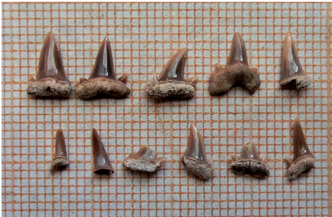
Dientes de tiburones fósiles del Cretácico hallados en Potrerillo y diente fósil de un pez del mismo período, igualmente descubierto.

El destacado investigador Carlos Rafael Borges Sellén afirmó que, por la riqueza de los hallazgos verificados en Rodas y Cruces, estamos en presencia de una gran Región Paleontológica en el centro sur de Cuba