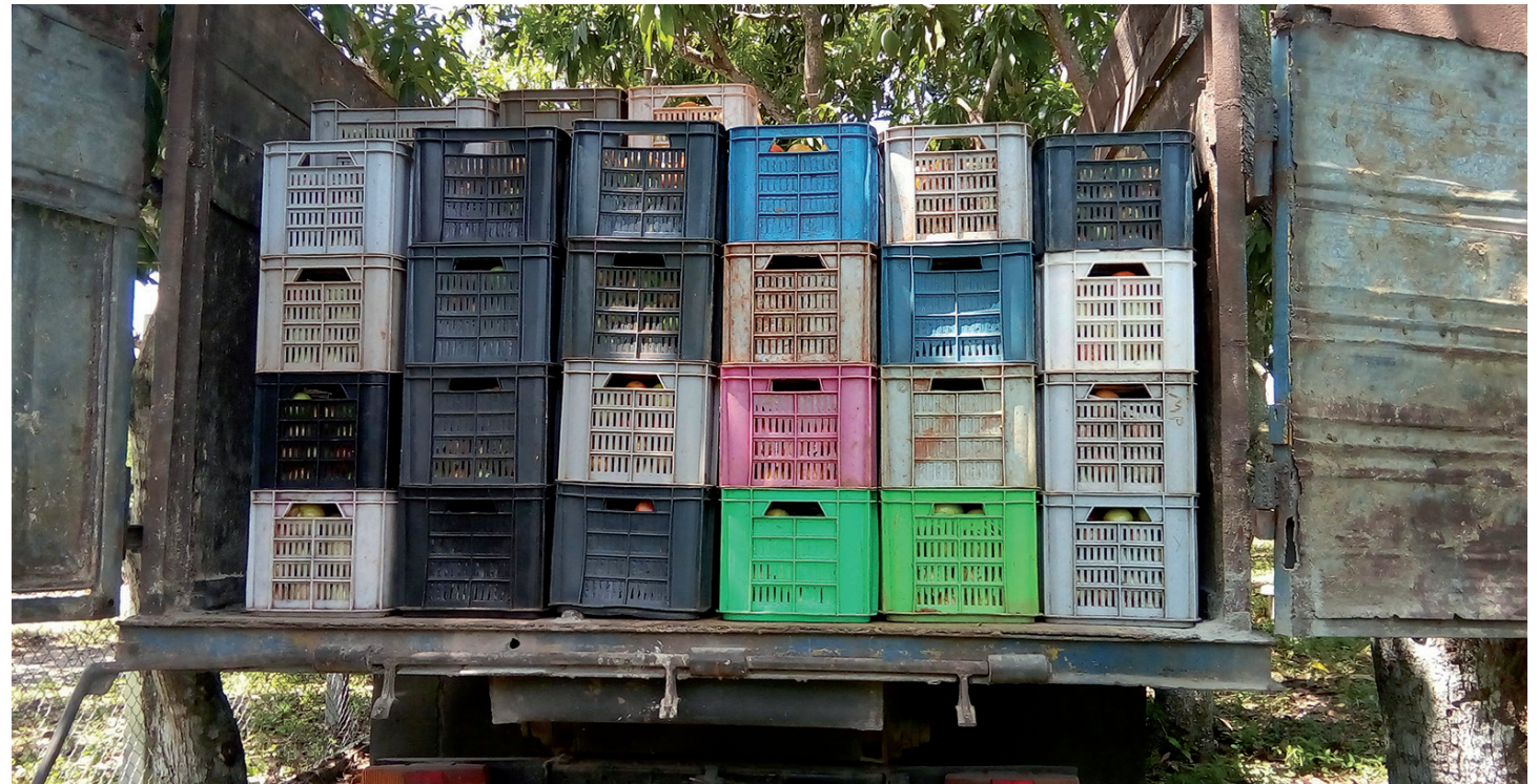
Fueron decomisadas las 465 cajas de tomates y distribuidas en entidades del sistema de Salud y las direcciones de Educación y Deportes del municipio cabecera provincial.