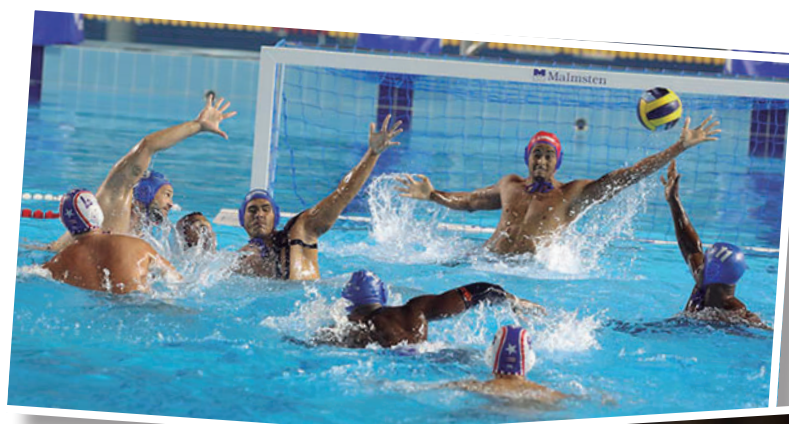
El polo acuático estuvo a un tilín del cetro centroamericano.