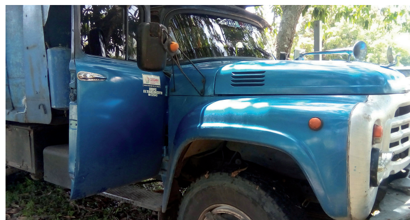
Como medida administrativa, los dos vehículos involucrados se encuentran al servicio de la Empresa Provincial de Comunales de Cienfuegos por un período de tres meses.