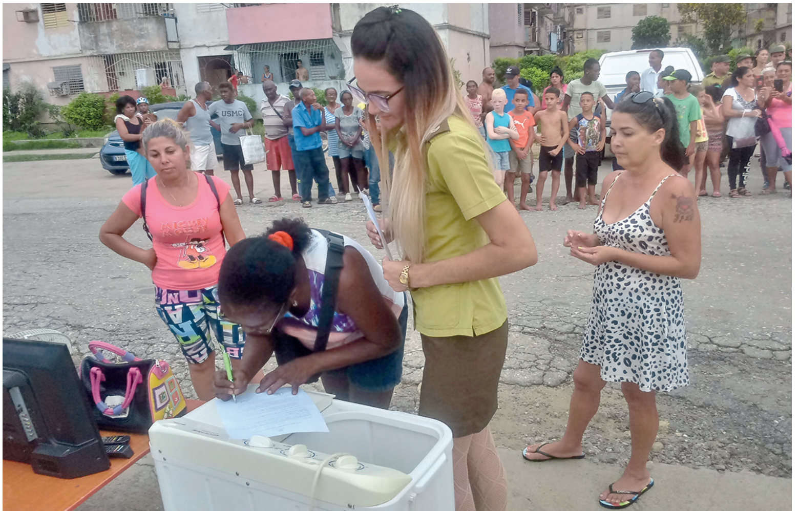
Devolución efectuada en Buenavista.

La actividad policial permite el rápido y eficaz accionar contra ladrones que perpetraron sus fechorías en instituciones y viviendas