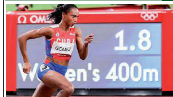
Cienfuegos en la vanguardia de los Centroamericanos