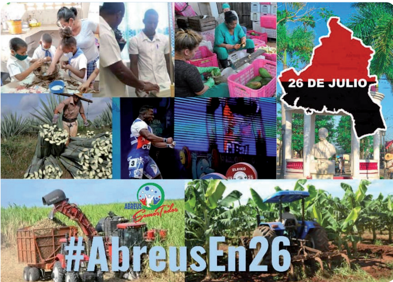
Abreus, municipio ganador de la sede del 26 en Cienfuegos.

lebración del acto provincial en nuestro territorio Destacado Nacional, a las puertas del aniversario 70 del asalto a los cuarteles Moncada y Carlos Manuel de Céspedes.