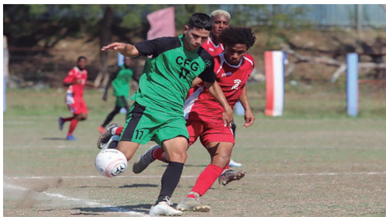
Esta vez la historia fue diferente ante los Diablos Rojos.

Aunque no sabe igual ni representa lo mismo, los Marineros de Cienfuegos se sacaron hoy la espina de la final del torneo Apertura frente a Santiago de Cuba, al ganar 2-1 en la tercera fecha de Clausura de la 107 Liga Nacional del fútbol cubano.