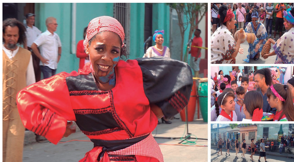
Causas y azares, organizada por el proyecto Trazos libres.

¿Estamos ante meras documentaciones de las eventualidades comunitarias? Es injusto precisarlo de ese modo. En las instantáneas de Rita Arbolay, Yoel de la Paz, Dorado, Liván Rodríguez y Luis Alberto Álvarez, entre otros (algunos pintores que tienen como afición el arte y la técnica del lente), se perciben los signos de una fotografía que detalla la contingencia cultural, pero mediada por la artisticidad (obvio que aludimos a que el objeto primero de las imágenes no es ser una obra de arte, sino un instrumento de las ciencias, abierta a los estudios socio-culturales), así como aquella marca a la que aludía Juan Acha como condición ineludible de un texto creativo: la intromisión del artista en el espacio motivacional. Por su puesto, estamos haciendo referencia a esa capacidad que debe tener el fotógrafo para transformar el entorno desde las pulsaciones estéticas. Considérese la fragmentación visual de los objetos en planos, las atmósferas obtenidas a partir del dominio de la luz y el registro cromático, la