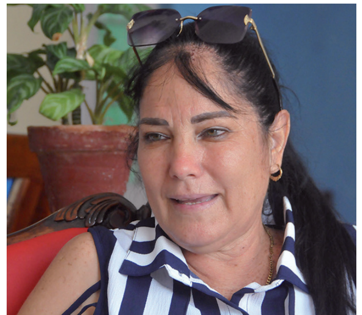
La precandidata al XI Congreso de la FMC se refiere a los principales retos de la organización femenina.

“Tampoco podemos obviar, precisa, el rol que le corresponde a la Federación en la atención y apoyo a aquellos segmentos y barrios más vulnerables dentro de la comunidad. Por otro lado, tenemos una gran responsabilidad, de manera particular, con las madres con tres o más hijos. De igual modo, estamos convocados, permanentemente, a