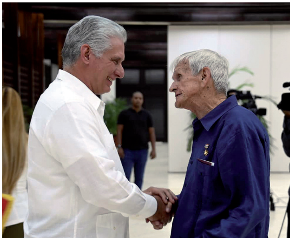
El Primer Secretario del PCC y Presidente de la República, Miguel Díaz-Canel Bermúdez, lo condecoró en el acto solemne efectuado en el Salón El Laguito, en la capital del país.

la lucha clandestina o en la Sierra, y eso me causaba una gran insatisfacción.