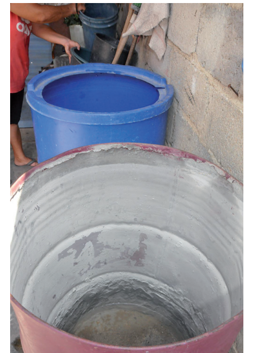
Tanques vacíos, una realidad bastante común para los moradores de Arizona.