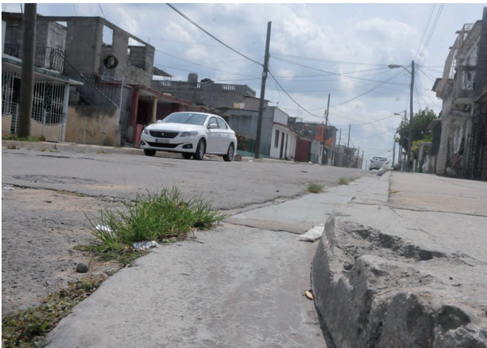
Esta cuadra, correspondiente a la avenida 48, entre 65 y 67, es una de las más afectadas por la escasez de agua.

El director provincial de la Empresa de Acueducto y Alcantarillado reiteró la voluntad de que “a mediano plazo, Arizona pueda disponer del servicio de agua por las redes del sistema”. Treinta años después solo queda aferrarse a esa nueva esperanza, en medio de una realidad casi desértica.