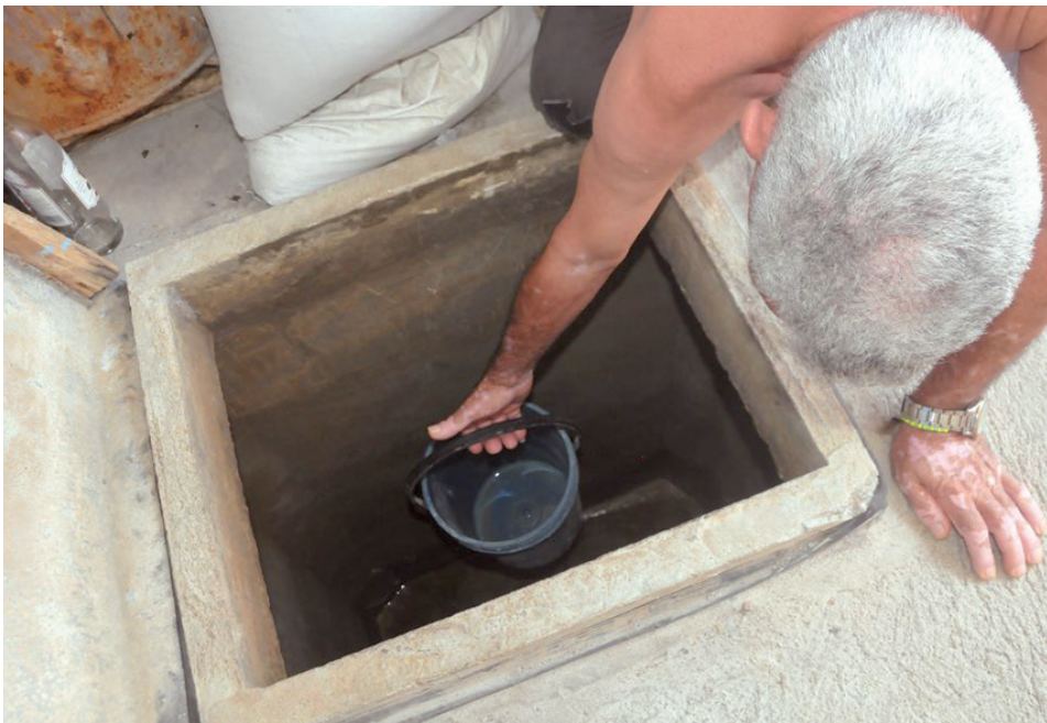
Así lucían las cisternas de varias casas del barrio de Arizona, en la ciudad de Cienfuegos, cuando este periódico visitó el lugar y dialogó con sus vecinos.