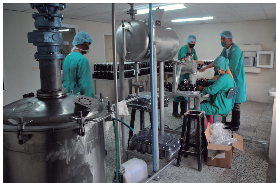
La tecnificación de la planta de Cumanayagua se acometió en gran medida gracias a la acción innovadora y la inventiva de buena parte de los técnicos y operarios de Labiofam.

Como parte del proyecto de autosustentabilidad de Labiofam Cienfuegos, y de su trabajo de atención al hombre, proseguirá el desarrollo del programa porcino, en procura de garantizar como promedio a través del año 100 toneladas de carne; y de forma paralela, el de autoconsumo, con siembra de viandas y vegetales, y la consolidación de 700 gallinas ponedoras, con el objetivo de producir 500 huevos diarios, destinados a la venta sistemática a los trabajadores a precios asequibles.