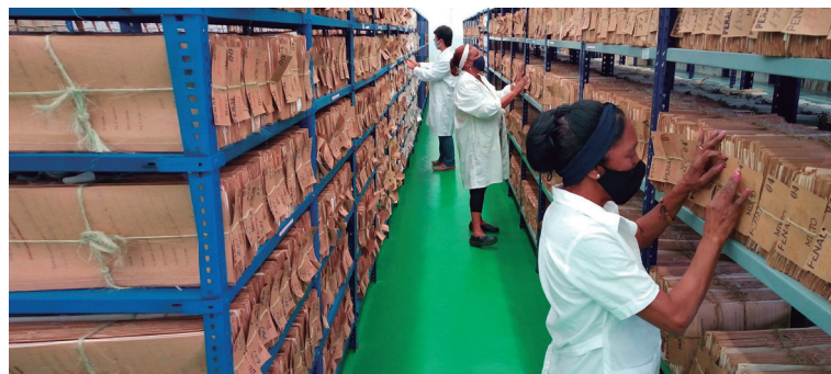
Muestra de los documentos relacionados con la Justicia que atesora el Archivo Provincial de Cienfuegos.

En Cienfuegos, el Sistema de Tribunales ha contribuido a tan noble propósito y de conjunto con otras entidades como los Joven Club de