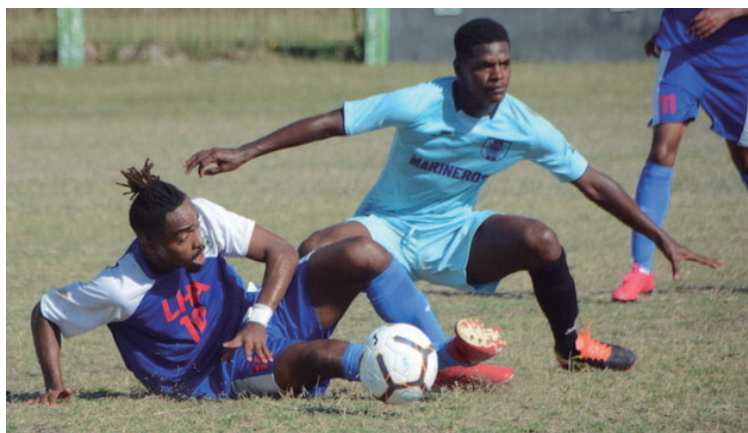
Los habaneros se han convertido en difíciles rivales para los nuestros.