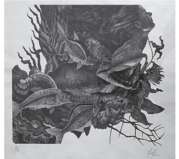
Maikel ofrece un sitio especial a la mujer y su voluptuosidad.

Para los entusiastas del grabado como disciplina, la muestra es un