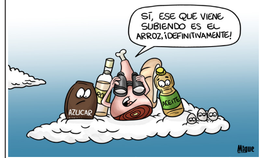
El arroz... casi toca las nubes

Viernes, 24 de febrero de 2023. "Año 65 de la Revolución". ÓRGANO DEL COMITÉ PROVINCIAL DEL PCC Año 43 | No. 24 | VII época | $ 1.00 |