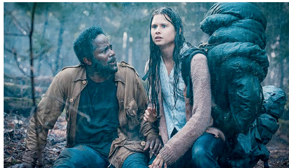
Escena de la serie From , de estreno en la televisión cubana.

En la noche, cercanas a las puertas, a la espera de algún momento de debilidad de cualquiera de los inquilinos de los hogares, se encuentran unas criaturas que pueden replicar la imagen de los seres