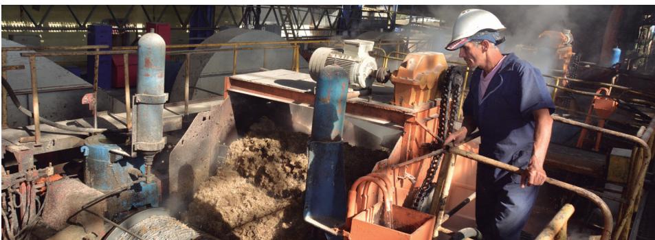
El acto por el cumplimiento se efectuará hoy en la Empresa Agroindustrial Azucarera 14 de Julio. (Trabajo periodístico en la próxima edición)