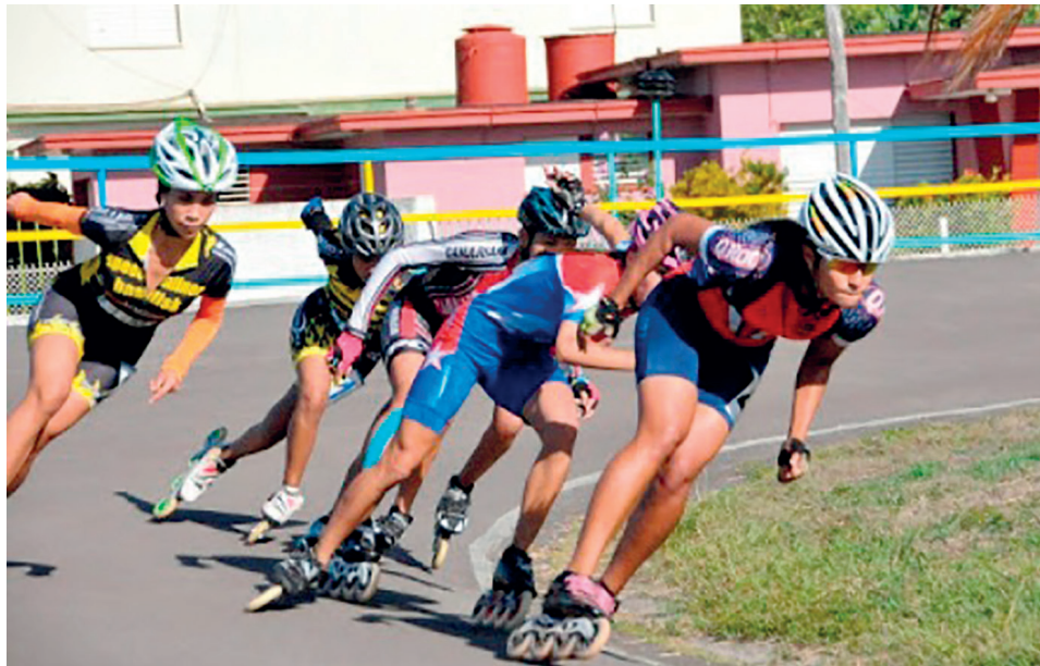
El cuarto lugar en los Juegos Escolares es uno de los principales motivos de celebración en este cumpleaños.

En el mes de noviembre está previsto el primer Campeonato Nacional de Boleo Femenino, y allí podremos comprobar si la hija del gato está lista para cazar ratones.