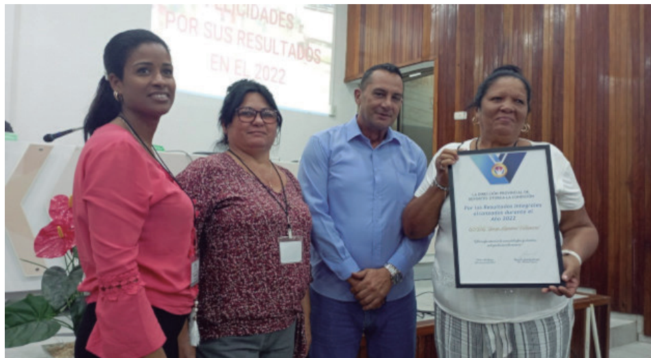
Durante el balance, fue reconocida la Eide Provincial Jorge Agostini Villasana.

Se informó que la provincia, una de las más pequeñas del país, cuenta con un universo de casi 6 mil discapacitados, pero de ellos solo unos 400 están aptos para la práctica de deportes, y no todos se