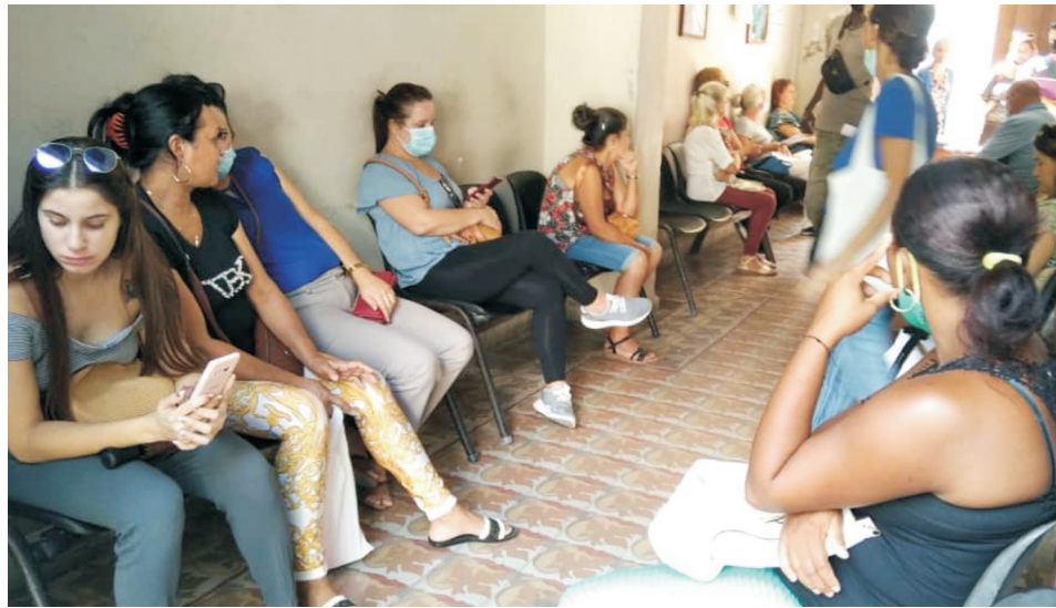
En una segunda visita al Registro del Estado Civil del municipio de Cienfuegos, previamente coordinada con la Dirección Provincial de Justicia, este periódico constató un escenario más tranquilo al de la jornada anterior.

Sin embargo, aunque la funcionaria reconoce que “las nuevas condiciones son