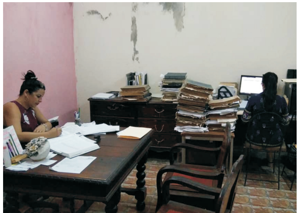
Viejos y deteriorados documentos permanecen en las oficinas junto a las registradoras, y son manejados por ellas sin medios de protección.

La efectividad de esta iniciativa, o mejor, su impacto en el bienestar de los ciudadanos, dependerá de la organización y eficacia de los procesos tradicionales. Por más aplicaciones e innovaciones que desarrollemos para el universo virtual, persistirá el caos si en el espacio físico prevalece el desorden. Poco favor nos hacemos al negarlo.