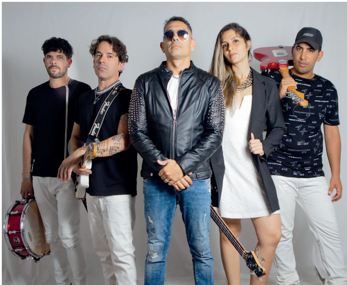
Flores del Sol, banda de reciente creación en Cienfuegos.

La banda se estrenará el 14 de febrero en el Museo de las Artes Palacio Ferrer, con un concierto por el Día del Amor y la Amistad