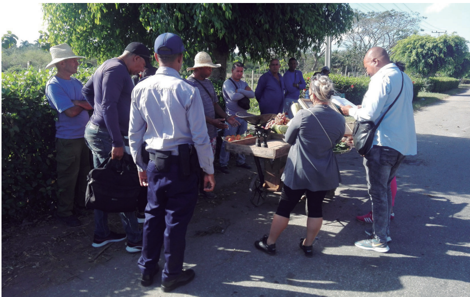
Inspección y multa a carretilleros en la carretera de Caunao.

carle hasta el 30 por ciento por encima.