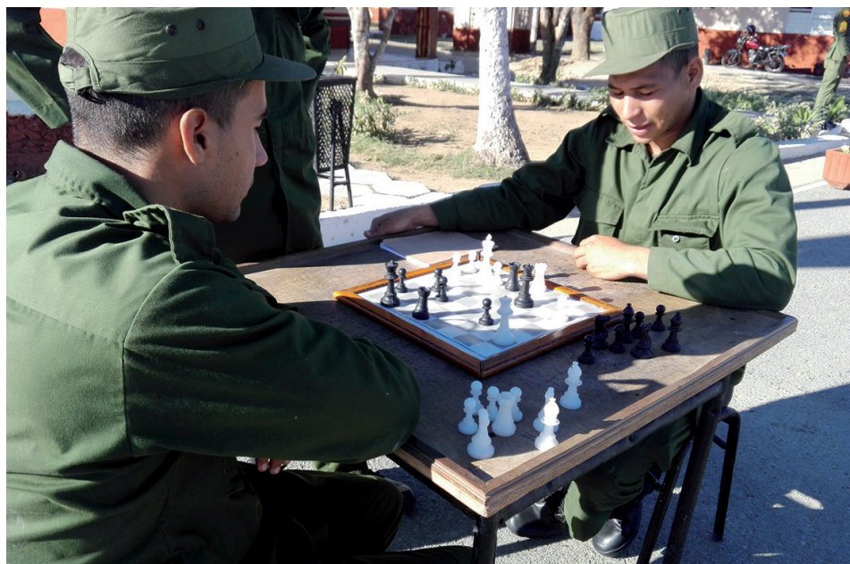
La recreación y el deporte forman parte del régimen diario en el Centro de Preparación.