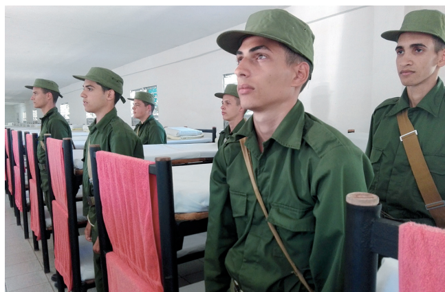
Los hábitos de convivencia contribuyen a la formación de los jóvenes.