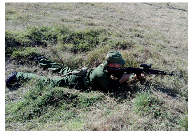
Mediante clases teóricas y prácticas los reclutas van dominando el arte militar.