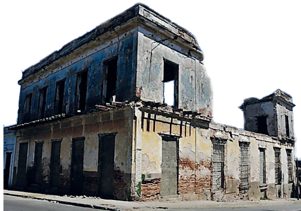
La Catalana poco antes de ser demolida en 2015.