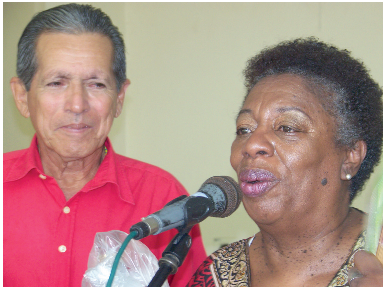
Los Jardines de la Uneac en Cienfuegos acogieron el primer concierto homenaje al Dúo Así Son por sus 25 años.

“En aquel momento solo deseábamos tener una forma de expresar nuestra filiación con la música como artistas aficionados, sobre todo para compartir con las amistades. Ya luego, en 1998, cuando decidimos profesionalizarnos, ese tiempo anterior nos permitió conformar un repertorio, sustentado en géneros tradicio-