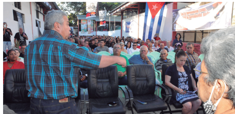
El miembro del Buró Político del Partido y secretario general de la CTC, Ulises Guilarte de Nacimiento, en el acto nacional por el Día del Trabajador de la Industria Alimentaria y la Pesca, sede merecida por Cienfuegos.

“Si algún trabajador merece reconocimiento en estos tiempos es el que se desempeña en el sector alimentario, por el esfuerzo, la innovación y creatividad, para tratar de ofertar alimentos a la población, en medio de carencias económicas, falta de materias primas y ante un bloqueo económico y financiero