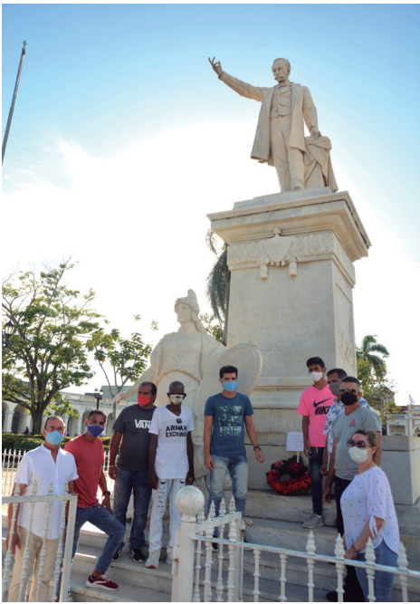
Varios integrantes históricos reunidos frente a la estatua de Martí, hace dos años.