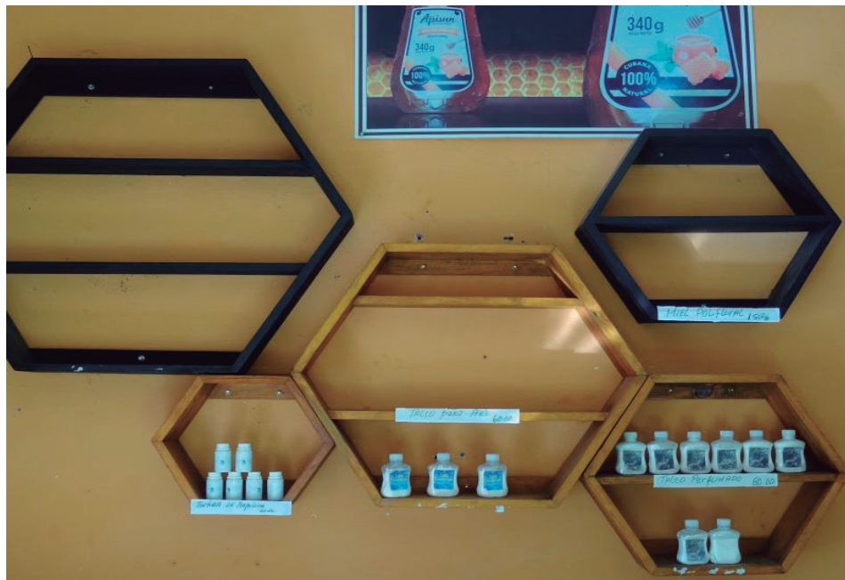
En 2022, la UEB Apícola de Cienfuegos cumplió sus planes productivos, pero ahora mismo ese logro no se observa en la Casa de la Miel, donde lo que ha predominado a la venta por semanas es talco, crema y jarabe de orégano.

Un reportaje que publicamos este mes dio cuenta sobre los positivos indicadores de la