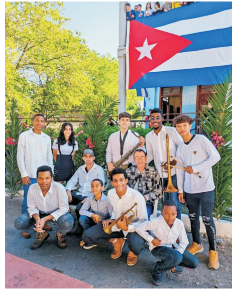
Cubanía y fidelidad, esencias de la banda.

Hemos estado haciendo una gira provincial por el aniversario 170 del nacimiento de José Martí. Hoy, a las 8:00 p.m., en el parque