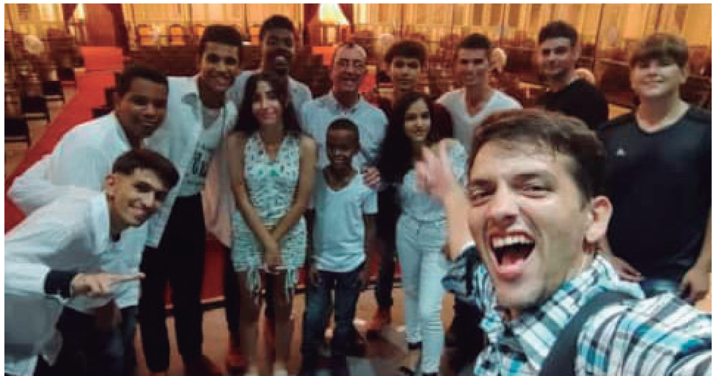
La alegría, característica de los muchachos de Ismaelillo.