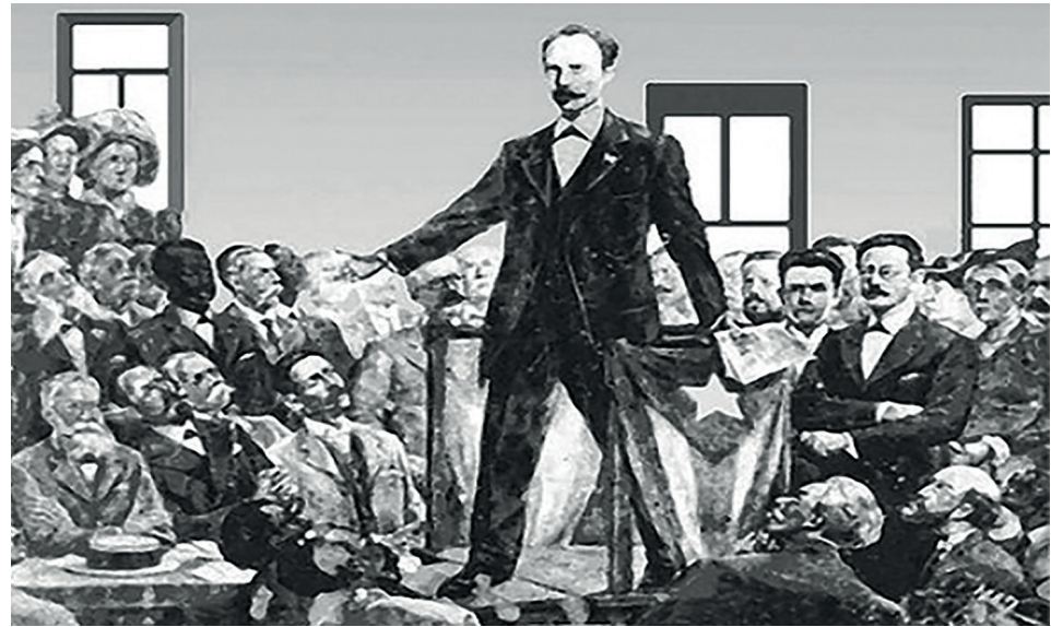
El Apóstol dedicó su vida y su palabra a que la patria sanara. Sus discursos en el exilio fueron movilizadores de conciencia.

Así reafirma Martí en esta pieza oratoria