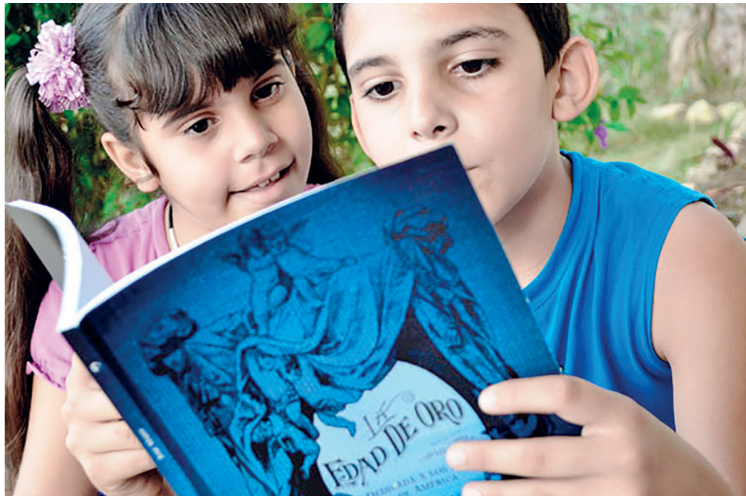
“Leer es una manera de crecer, de mejorar la fortuna, de mejorar el alma, otra gran fortuna que debemos a la colosal Naturaleza”, José Martí.

Especial importancia revisten los escritos dedicados a los niños, a quienes llamó la esperanza del mundo. En la revista La Edad de Oro pueden leerse mensajes con tanta vigencia hoy como en el momento de su publicación.