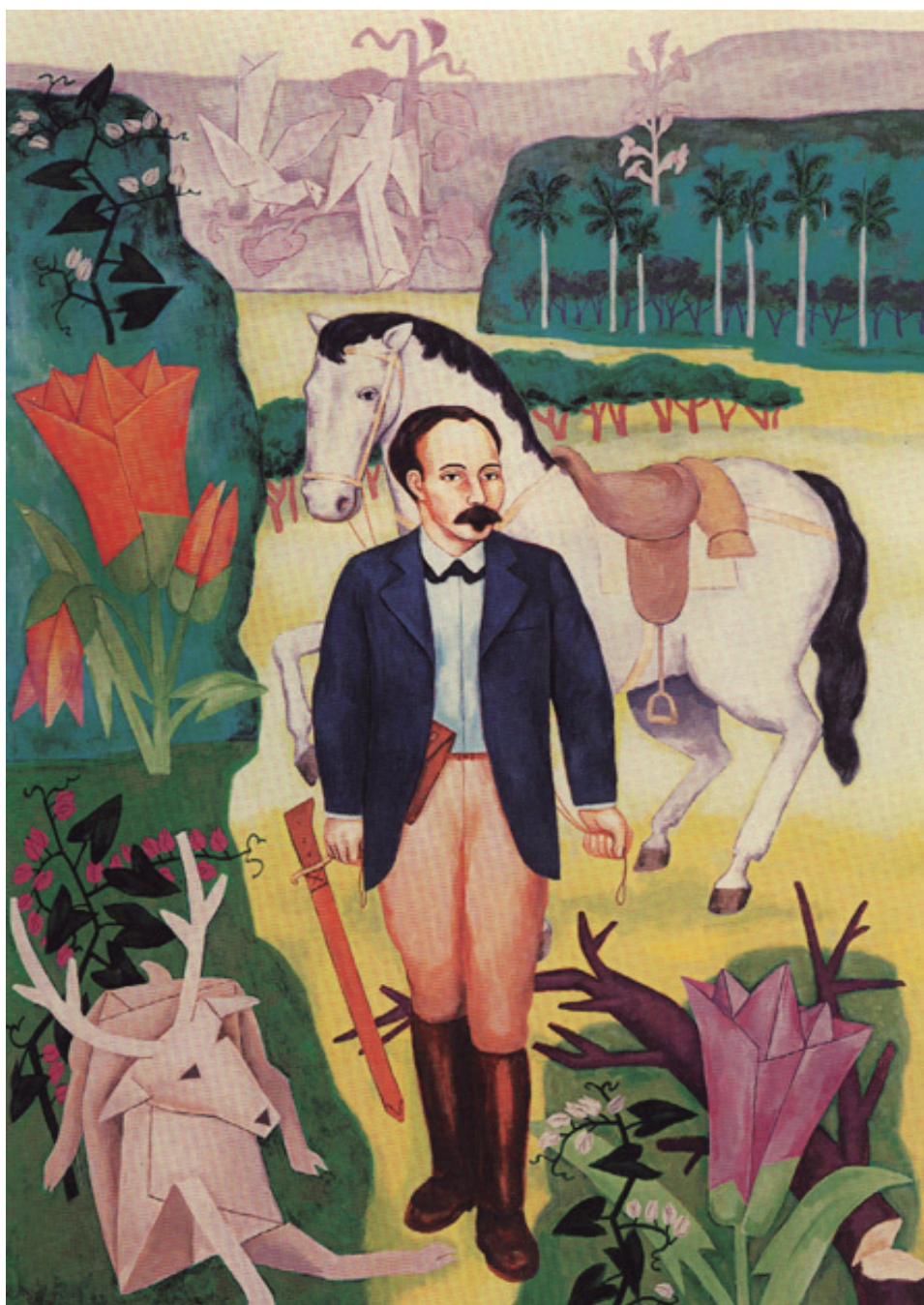
Donde el verso es un ciervo herido (Adigio Benítez, 1996).