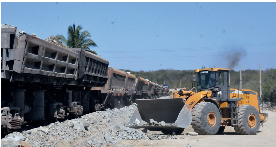
Los mayores volúmenes de rajón de voladura se transporta por ferrocarril a través de volquetas.

Y mientras avanza la vía de rieles y piedra por los estados de Chiapas, Tabasco, Campeche, Yucatán y Quintana Roo, con nuevos empleos y un notable bienestar social para el pueblo azteca, acá desde el centro sur de Cuba, más de 150 trabajadores y un número considerable de equipos y medios no descansa para, desde la retaguardia, garantizar el material pétreo que luego será procesado como balastro para el camino de hierro del Tren Maya.