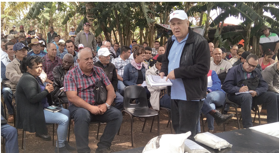
El viceprimer ministro abogó por el mayor empleo de biofertilizantes en el esquema productivo arrocero de la nación, durante la plenaria de productores en Aguada.