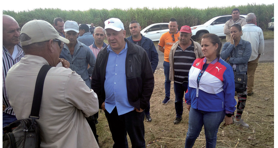
Intercambio con los trabajadores en la CPA Nicaragua Libre.