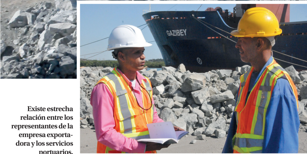
Existe estrecha relación entre los representantes de la empresa exportadora y los servicios portuarios.