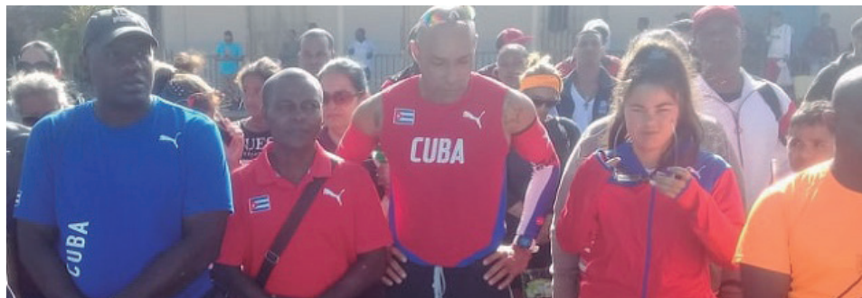
Autoridades del Partido, el Gobierno y el Inder del municipio, así como glorias deportivas, familiares, amigos y lajeros en general acudieron al singular evento.

"Todo marchaba bien, incluso durante la natación. Me había propuesto un tiempo para la travesía y se iba cumpliendo. Pero como viste, porque estabas allí, el tiempo cambió mucho de repente. Me vino el aire de frente, las olas, y además la temperatura del agua era bastante fría. Tuve que esforzarme mucho, y ahí llegaron los calambres. A pocos metros del final el equipo de apoyo tuvo que entrar para darme masajes. Gracias a ueste-