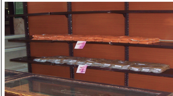
Algo más que colorante y pasta de ajo