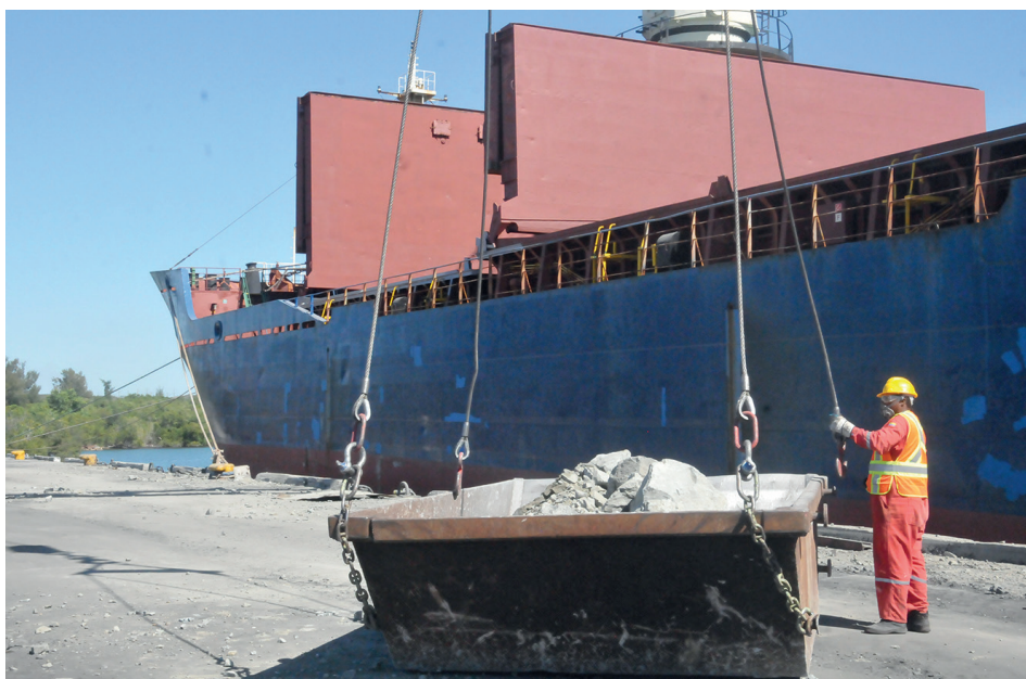
El buque Gazibey carga sus bodegas con 17 mil metros cúbicos de rajón de voladura para el Tren Maya. / Fotos: Dorado.

nuestra OSDE (Organización Superior de Dirección Empresarial) procedentes de varias provincias del país, con hombres y equipos, además de otras del territorio como son la Ecoa-37 y Ecoing-12, en tanto, es clave la participación del Ministerio del Transporte en los servicios de carga ferroviaria y los portuarios.”