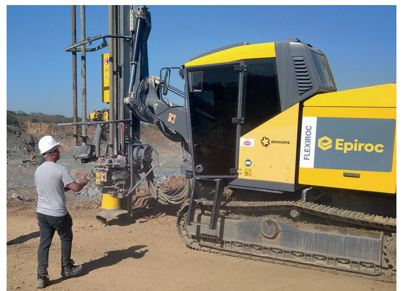
La moderna y computarizada barrenadora Flexi-roc es considerada única de su tipo en el país.