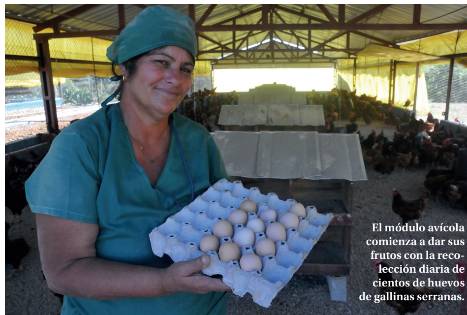
El módulo avícola comienza a dar sus frutos con la recolección diaria de cientos de huevos de gallinas serranas.

En tanto llegue ese momento ya en Lomitas se habla de un antes y un después. Nuevos aires de creación se respiran en la localidad y para sus habitantes no hay dudas de que pueden convertirse, con mucho trabajo, esfuerzo y dedicación, en los primeros en alcanzar la autosostenibilidad, que es decir suficiencia alimentaria y calidad de vida.