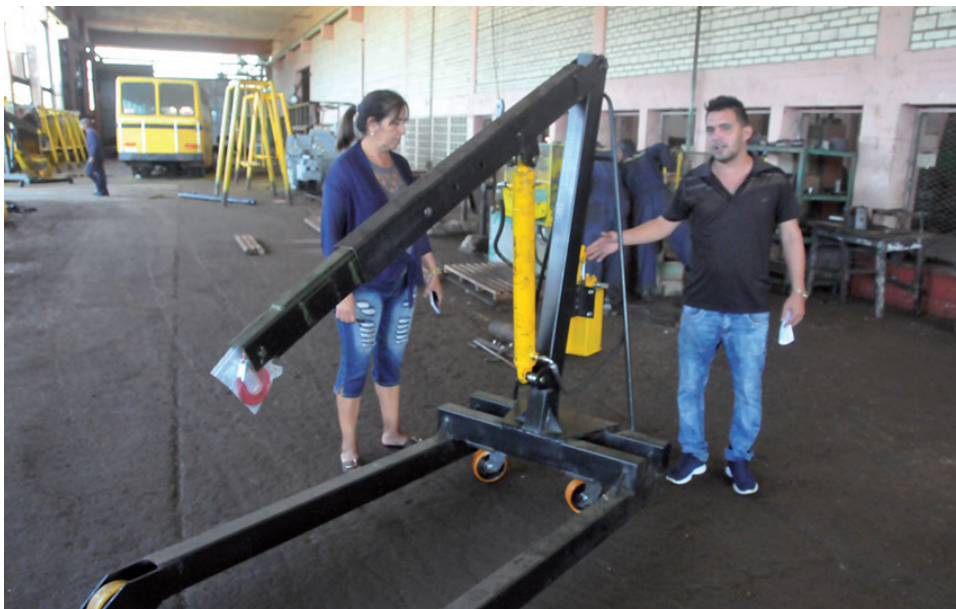
De la fresa CNC salieron los grampones para las cuchillas de las combinadas cañeras KTP.