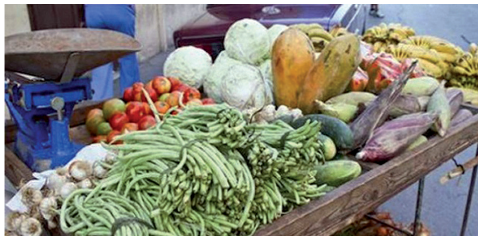
Carretillas... ¡maravillosas carretillas!

sis de NPK; y no solo eficaz, sino económico y seguro.