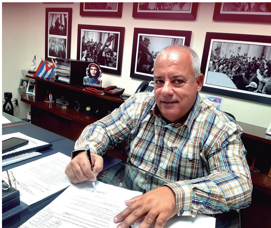
Alexandre Corona Quintero, gobernador de la provincia.

Constituyó un alto reconocimiento para el pueblo cienfueguero la sede del 26 de Julio, hecho que nos compromete a seguir trabajando con más esfuerzo, unidad y cohesión, para que el 2023 sea de retos y desafíos superiores.