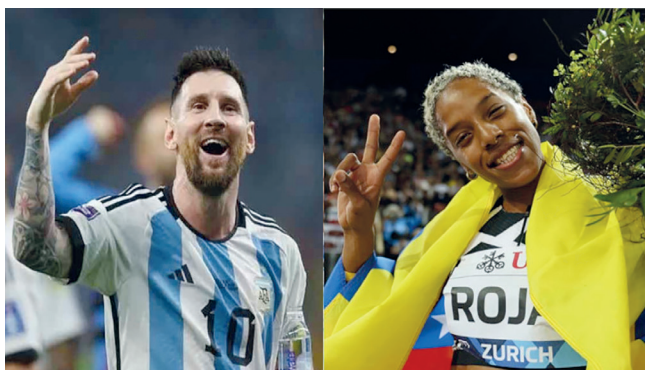
Messi y Yulimar.