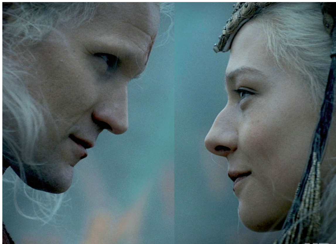
Matt Smith y Emma D’Arcy (Daemon y Rhaenyra Targaryen), personajes centrales de la serie estrenada en la televisión cubana.

El primer error pasa por comparar a ultranza la serie original y el proyecto derivado. Sería lo mismo si equiparásemos a las precuelas 1883 o 1923 (ambas muy recomendables) con la serie madre Yellowstone , que es maciza, pero cada una posee sus propios universos. Las obras audiovisuales, al menos así lo pienso, se aprecian y sopesan en base a sus especificidades, no sobre la premisa de esas aborrecibles mediciones. No son un concur-