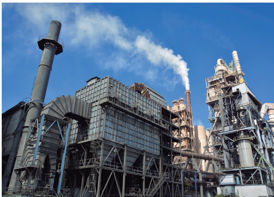
El cemento producido en la fábrica de Cienfuegos es uno de los rubros exportables locales.

El plenario dedicó buena parte de su agenda a ponderar, en materia de comercio exterior, la creación, a principio de año, del polo exportador de Cienfuegos, anclado a la Empresa Provincial de Acopio (EPA). Entre los principales impactos económicos para el territorio y el país resalta el envío a España y Turquía de 62 contenedores de carbón vegetal, con un monto superior a los 404 mil 300 USD.