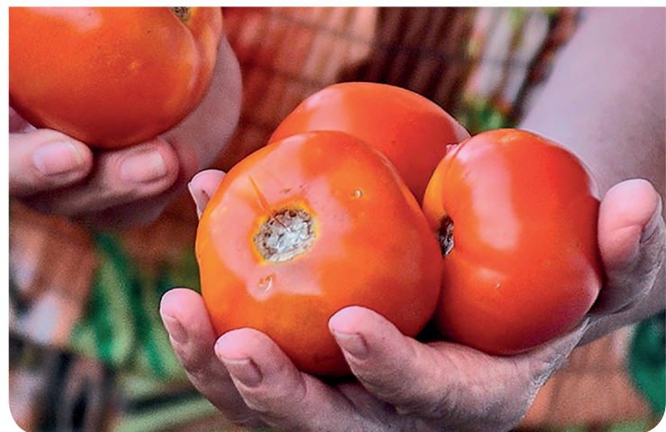
El precio máximo del tomate en Cienfuegos quedó establecido en 25.00 pesos, pero algunos vendedores violan esta norma.

La experiencia de análogos esfuerzos por contener el excesivo costo de los productos