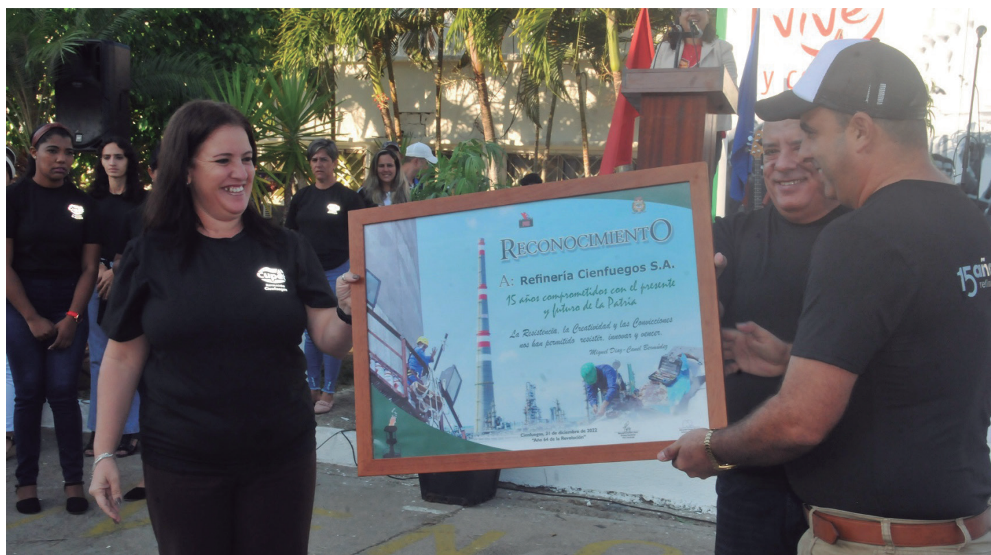
Las máximas autoridades de la provincia entregan certificado de Reconocimiento a la Refinería.

Entre los principales proyectos ejecutados en los quince años está la recuperación y preparación de la planta de destilación