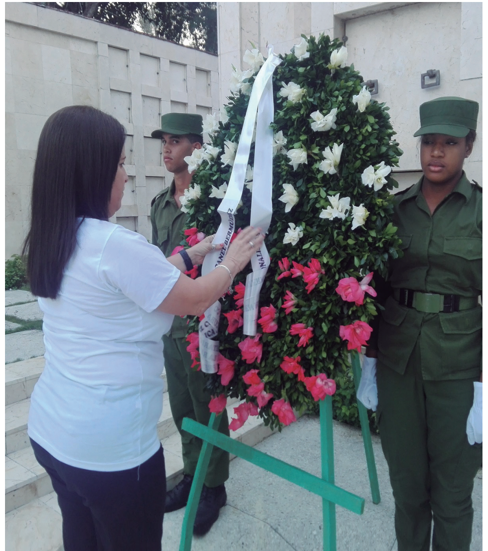
Ofrendas florales a nombre de Raúl, Díaz-Canel, el pueblo de Cuba, la ACRC y de los familiares, estuvieron presentes al pie del Panteón de los Caídos por la Defensa.