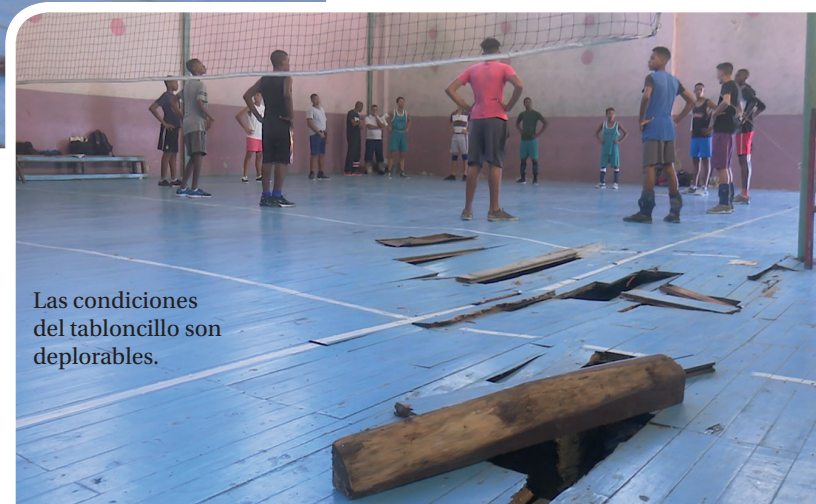
Las condiciones del tabloncillo son deplorables.