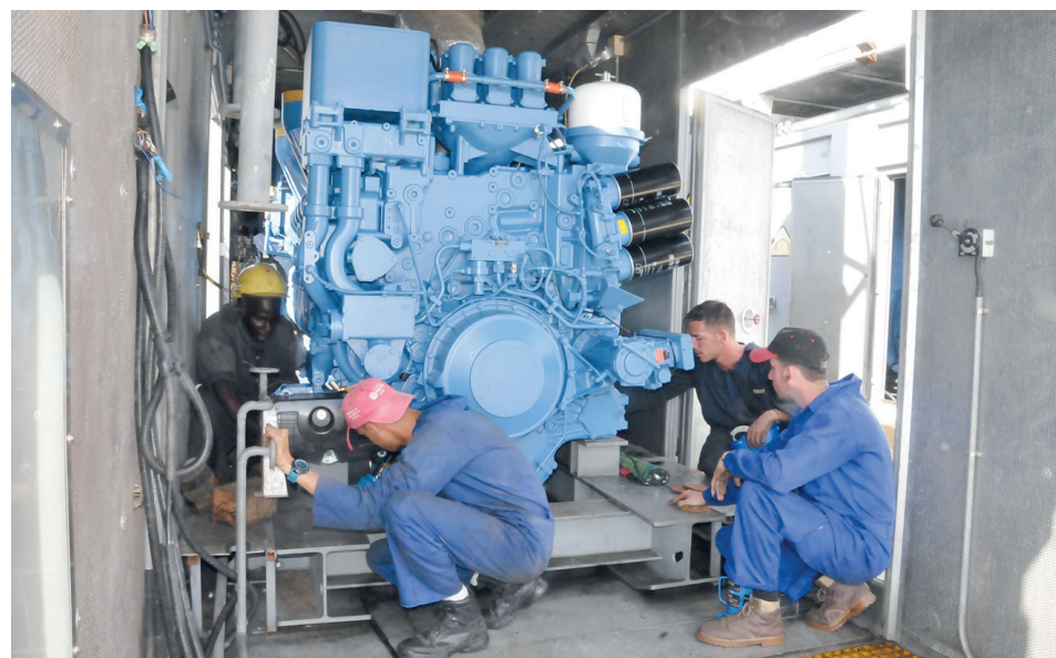
Mecánicos de Geysel de varias provincias del país apoyan la instalación de los nuevos equipos.

compañeros de oficio como yo estamos preparados para asumir tan compleja tarea.”