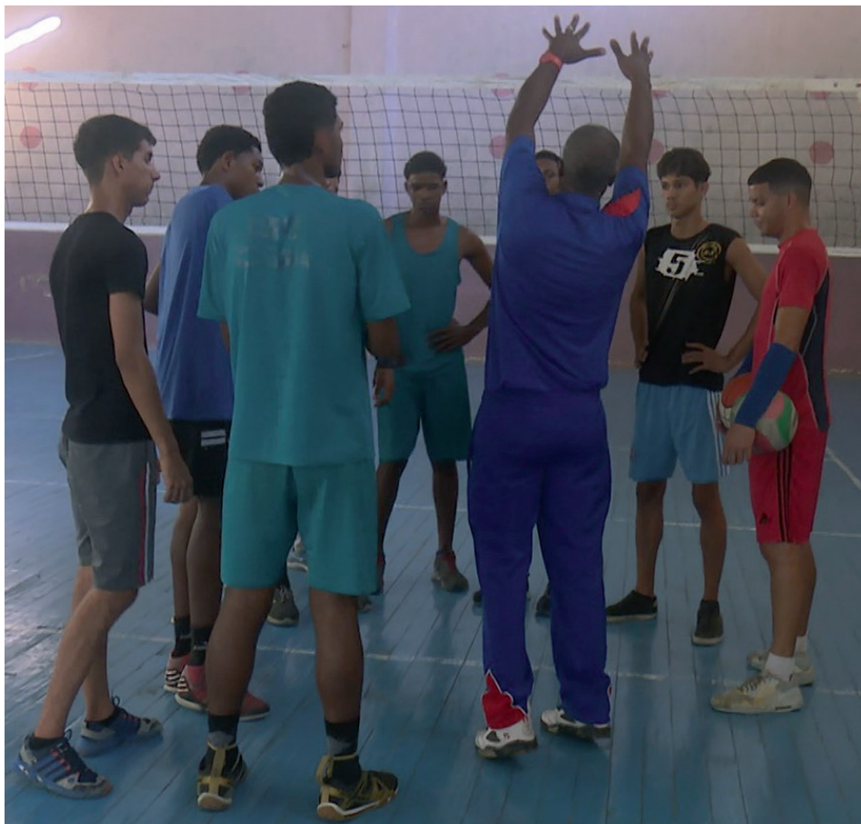
Varios de los atletas repiten en sus categorías.

En el caso de los juveniles, Iván Mesa, su