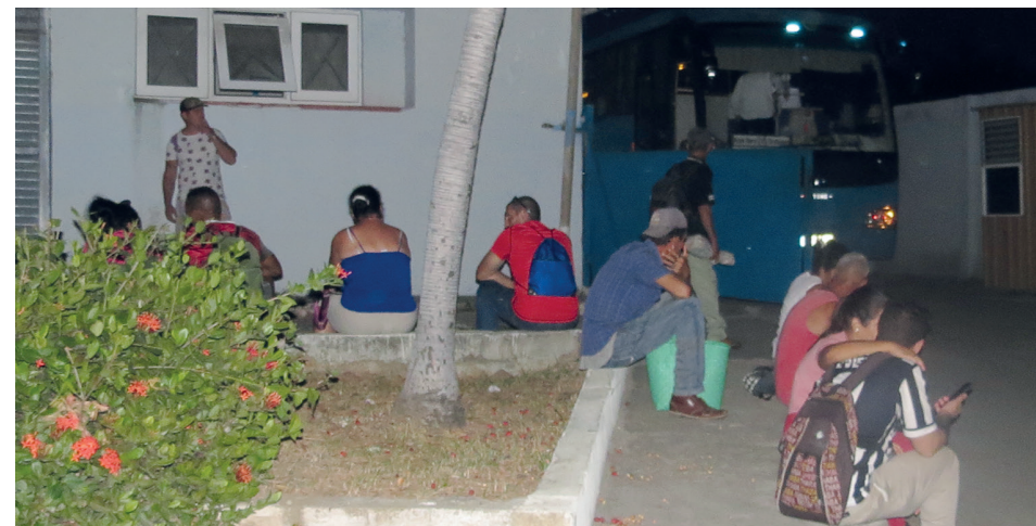
Personal fuera de la terminal de ómnibus, en medio de un apagón.

Las inconformidades continúan, otras se suman, y las preguntas siguen sin respuestas en el presente: ¿Por qué no se usan las taquillas para una mejor organización? ¿Por qué no se emplean boletines? ¿Dónde están los televisores, ventiladores y las consolas