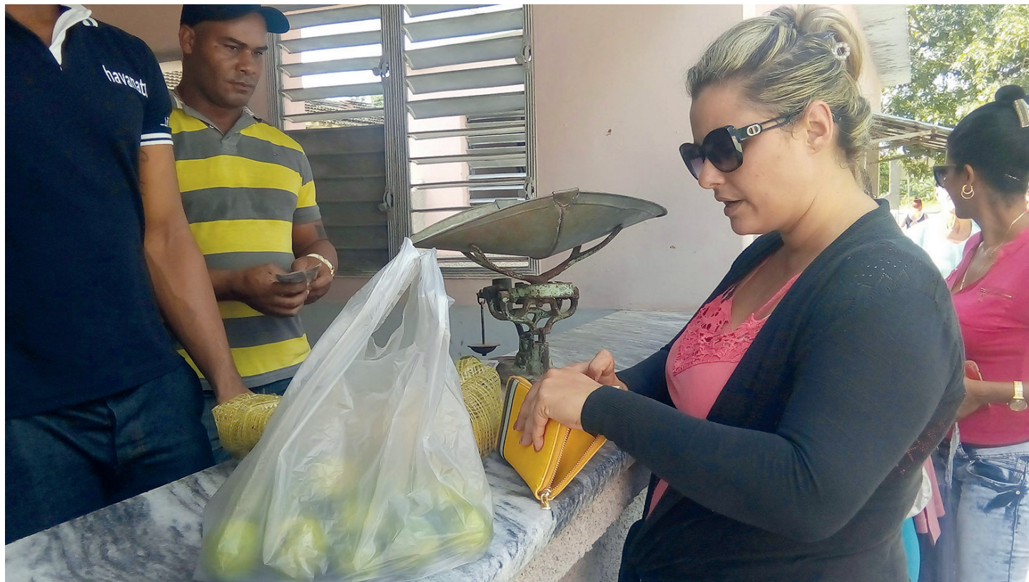
La venta de naranjas en el mercado local, una acción que el pueblo agradeció.

cialización de productos agropecuarios en Cruces, pues aun cuando está en vigor la Resolución 145/2022, firmada por Alexandre Corona Quintero, gobernador de Cienfuegos, acerca de la concertación de precios de varios renglones agropecuarios, se evidenció el incumplimiento de la misma con productos como el arroz, cuyo precio se fijó en $45.00 y se expendía a $ 50.00 y en algunos casos a $ 55.00.