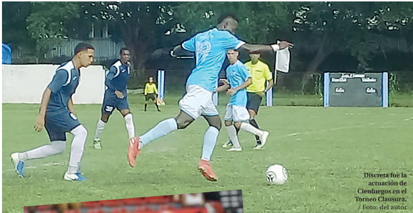
Discreta fue la actuación de Cienfuegos en el Torneo Clausura.

En medio de la justa prosiguieron las bajas, voluntarias e involuntarias. Abandono, llamado al Servicio Militar, convocatorias a selecciones nacionales, lesiones..., para aumentar los dolores de cabeza del técnico, que entonces acudió a la cantera juvenil, y fueron muchos los que vistieron asiduamente la casaca titular, mientras apenas había en