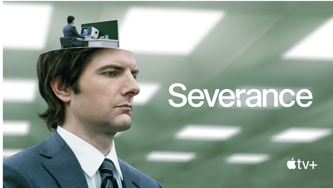
Cartel promocional de la serie de estreno en la televisión cubana.

valiosa por cuanto discursa, sí, y sobre ello no deseo detenerme, en tanto cada espectador arribará a sus juicios propios; pero sobre todo debido a las formas (y herramientas) como lo expone, en realidad su baza mayor.