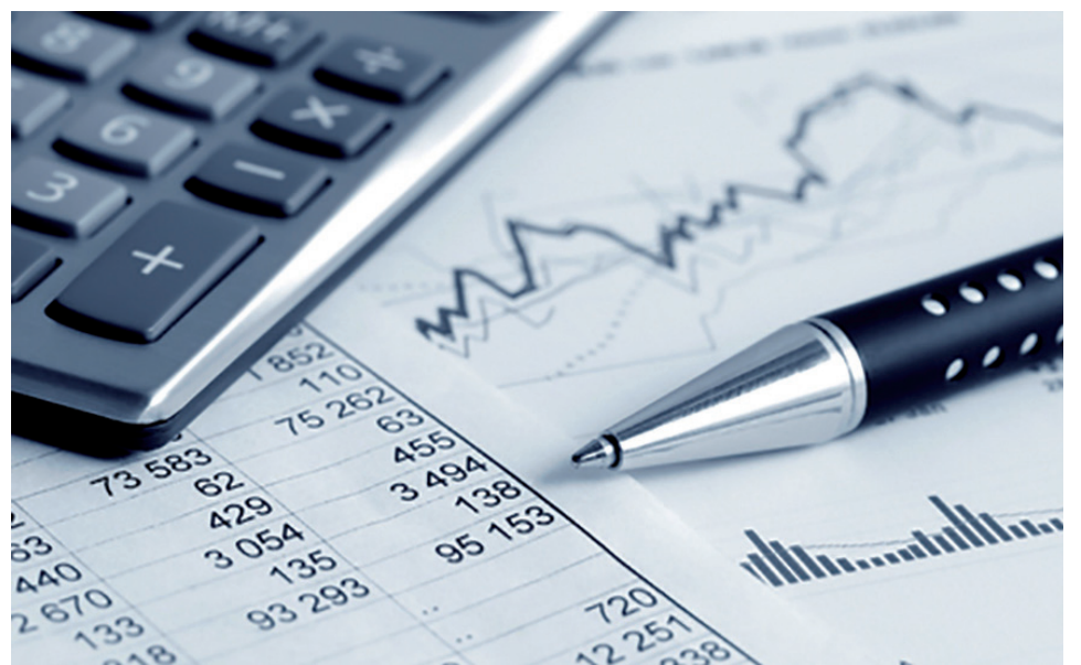
La XIV Comprobación Nacional al Control Interno contempló a 16 empresas de Cienfuegos en auditorías de cumplimiento.