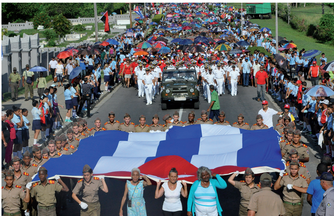
La tradicional peregrinación popular para honrar a los caídos en el cementerio Tomás Acea iniciará una vez concluido el acto central.