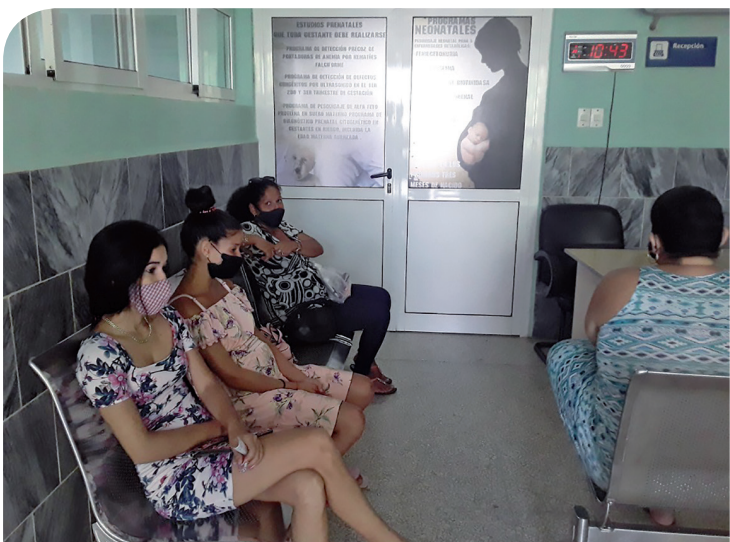
Centro Provincial de Genética Médica, ubicado en el HPU, cumple 15 años de fundado.

Magalys Chaviano Álvarez @Magadcienfuegos