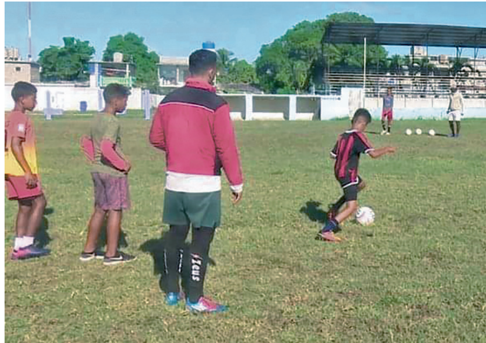
El trabajo técnico-táctico es una prioridad.

este es el relevo del fútbol en el territorio”.