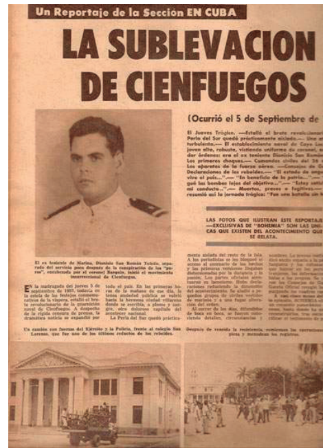
Artículo de la revista Bohemia sobre el hecho histórico.