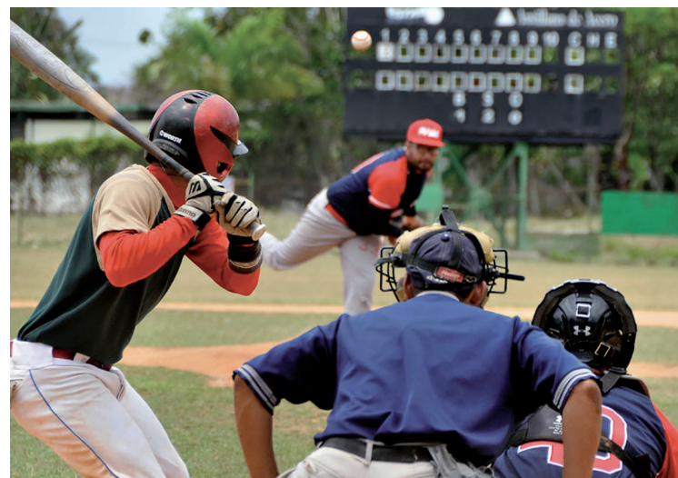
“14 de Julio” estará en el apartado 2, junto a representantes de Sancti Spíritus, Villa Clara y Matanzas.

Otros equipos que verán acción son Paquito Rosales (Santiago de Cuba), Arquímedes Molina (Granma), Amancio Rodríguez (Las Tunas), Ignacio Agramonte (Camagüey), Primero de Enero (Ciego de Ávila), Transminaz (La Habana), Cristino Naranjo (Holguín), Héctor Molina (Mayabeque), 30 de Noviembre (Artemisa) y Honduras (Guantánamo). (C.E.CH.H. y Alfredo Landaburo Almaguer)