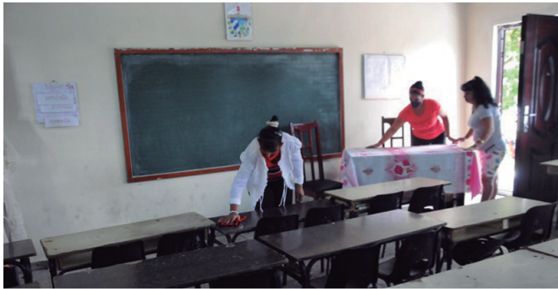
Nuevas aulas en la escuela primaria Fernando Pérez Guardarrama, en Caunao.