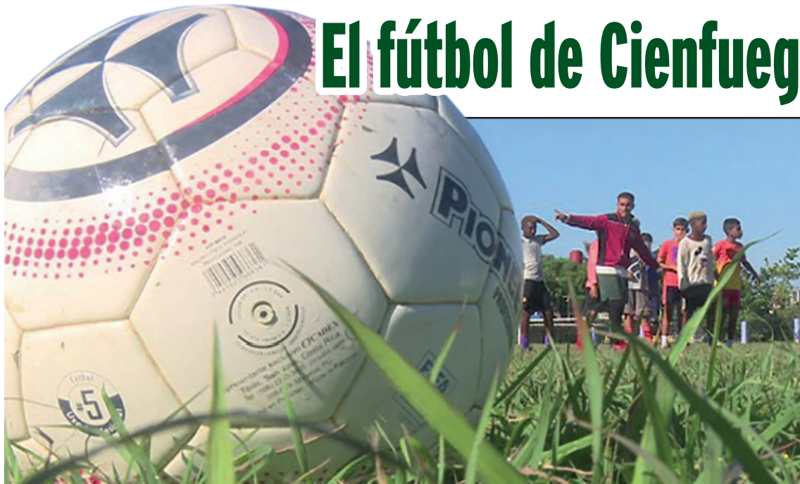
Un total de 25 atletas integran la preselección.