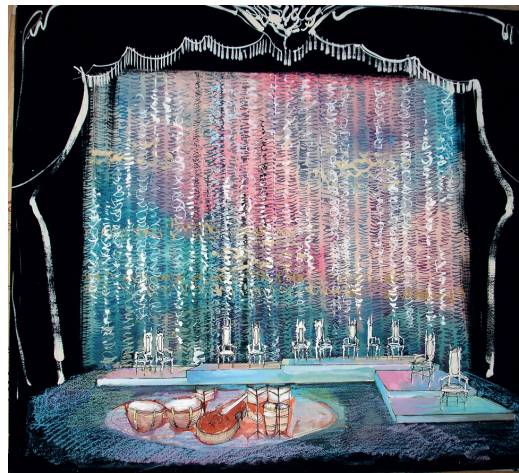
Diseño escenográfico de Leandro Soto para la obra El Danzón .