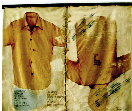
Instalación Coincidence (1979), de Leandro Soto.