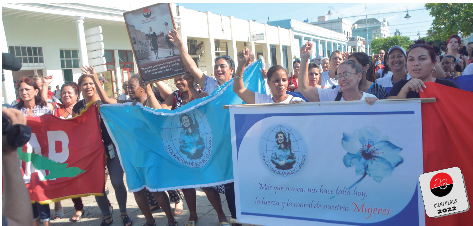
Alegría femenil en el encuentro suscitado en Prado y San Fernando.

Carlos E. Chaviano Hernández @carchavia74