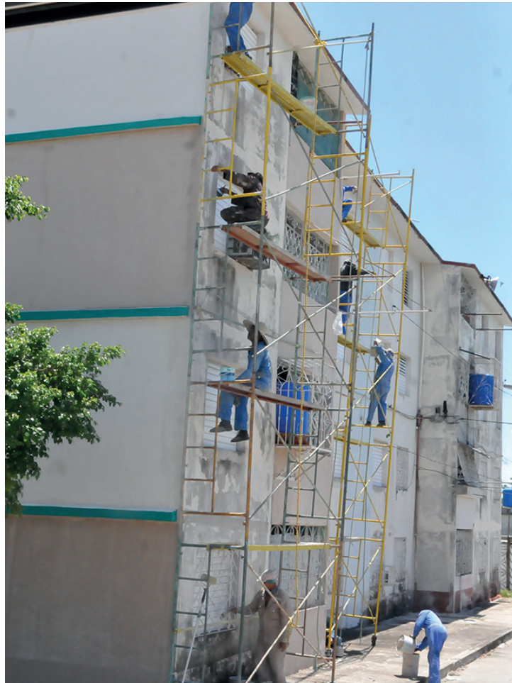
Pintura de edificio multifamiliar en la Avenida 28, en Cienfuegos.

Muy bien, pero tan importante como la labor de los constructores será en lo adelante la de padres y profesores, de manera que esos niños y adolescentes tengan cabal