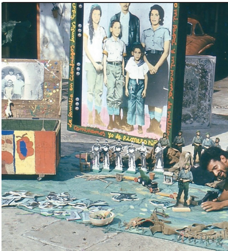
Leandro Soto durante una conferencia de prensa (15 de junio de 2010).