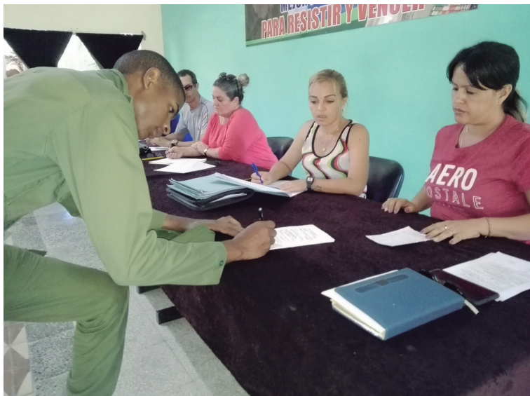
Una comisión compuesta por representantes de varios organismos le oferta a los jóvenes las diferentes opciones de empleo por municipios de residencia.

ciplina y capacidad alcanzada en la preparación combativa”.