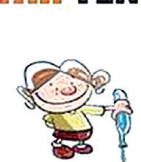
VACÍE Y COLOQUE BOCA ABAJO BOTELLAS, FRASCOS Y BALDES