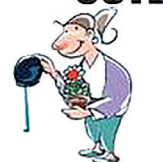
RENUEVE EL AGUA DE LAS FLORES, BEBEDEROS Y PECERAS CADA 3 DÍAS