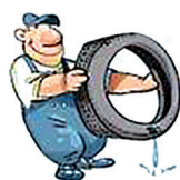
MANTENGA LIMPIOS LOS PATIOS