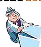
TAPE LOS DEPÓSITOS DE AGUA