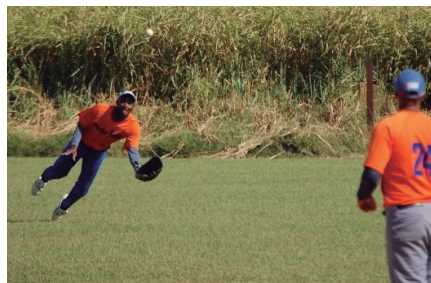
Mañana sábado pudiera definirse el certamen.

Con tres victorias sucesivas sobre Ciudad Caracas, el equipo de "14 de Julio" se colocó a un paso de la corona en la versión provincial de la Liga Azucarera de Béisbol, que este fin de semana dio inicio a la discusión del título.