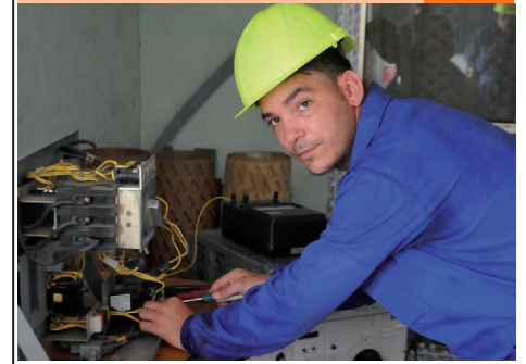
Hombres de luz