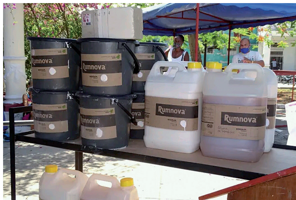
La mipyme ha podido exponer sus productos y servicios en las ferias de actores económicos organizadas en la provincia.