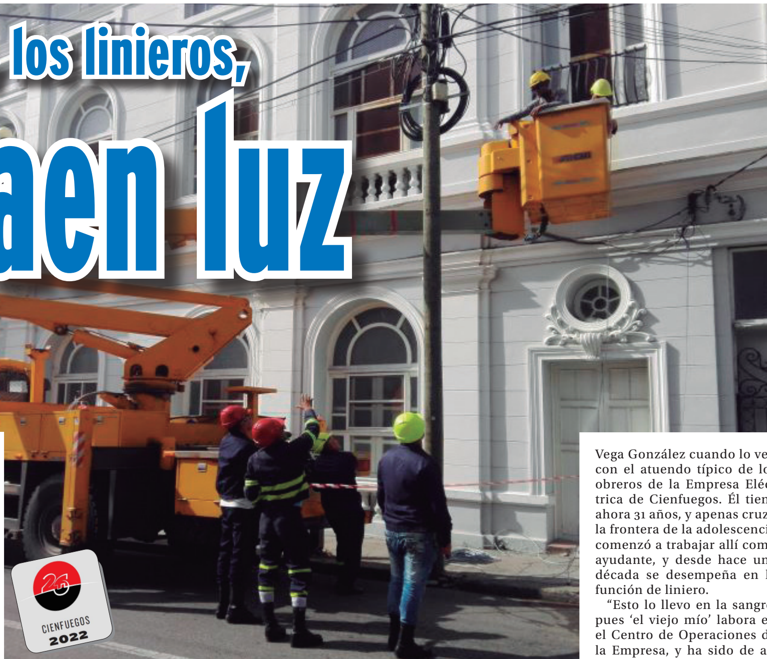
Trabajos para iluminar los exteriores de la Biblioteca Provincial.

José Azday recuerda de manera especial aquellos días en La Habana, tras el paso del tornado que en enero de 2019 fustigó varios municipios de la capital del país. “Nunca había asistido a un desastre