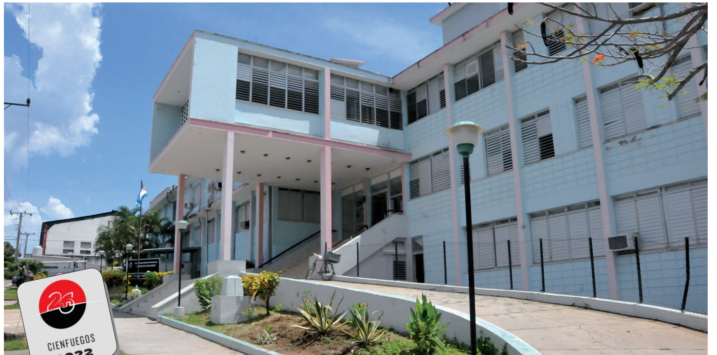
Centro Especializado Ambulatorio.