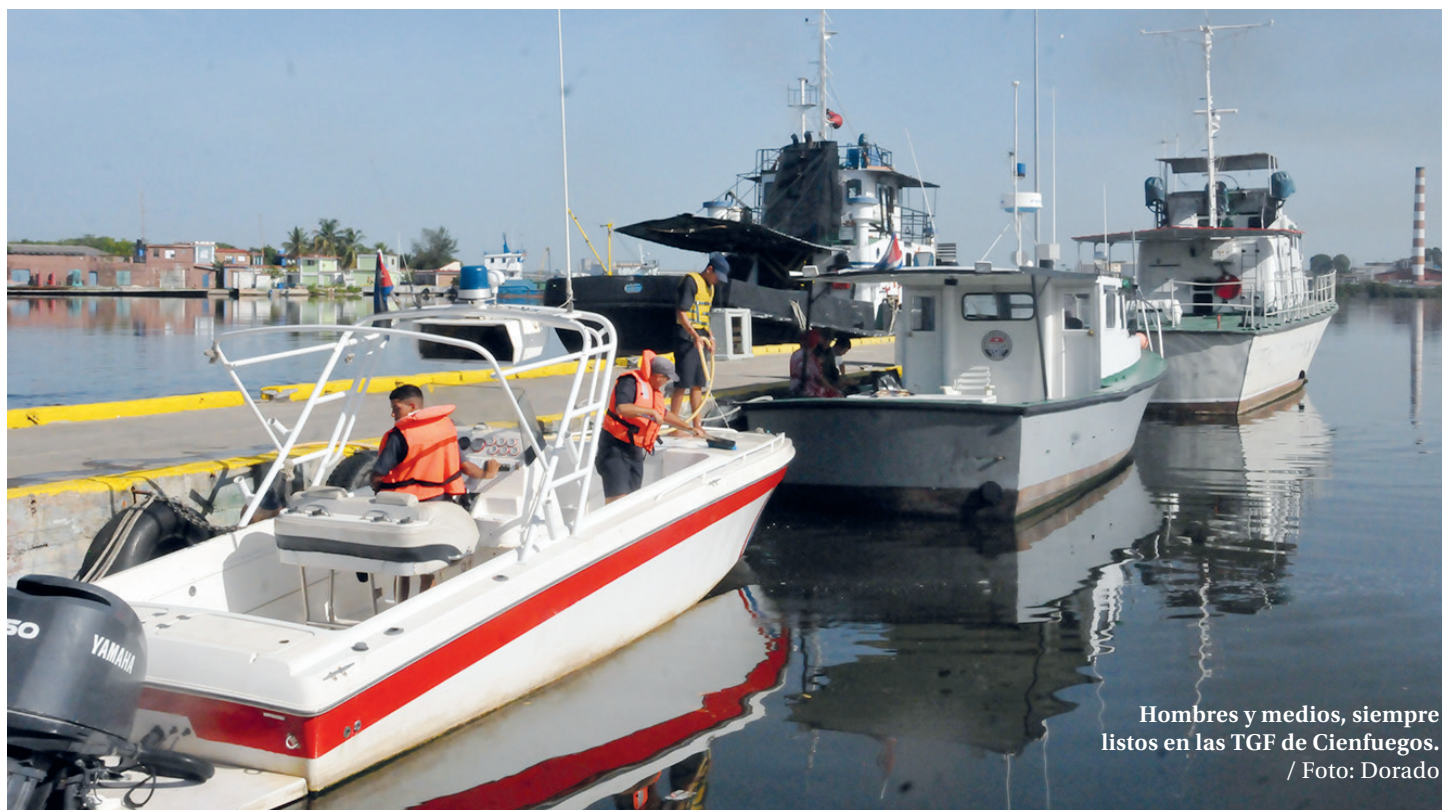
Hombres y medios, siempre listos en las TGF de Cienfuegos.

No ha sido poca la faena de los últimos días para los valerosos integrantes del Destacamento de Tropas Guardafronteras Centro-sur, quienes devienen protagonistas y tienen en sus manos la seguridad náutica de Cienfuegos.