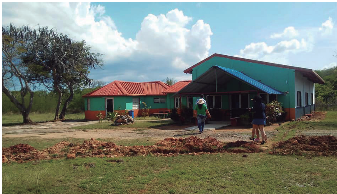
Espacios del Campismo Jagua siguen siendo intervenidos.

Si bien todas estas metas exhiben dificultades debido a la crisis de recursos, los servicios de hotelería y turismo en Cienfuegos siempre se han caracterizado por un amplio diapason de alternativas para los visitantes foráneos y extranjeros, es por ello que cada día su gremio apuesta por la búsqueda de vías y soluciones que logren la calidad óptima en los servicios y en la comodidad de los clientes.