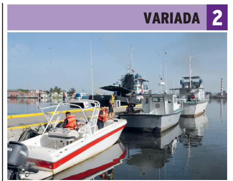
Guardafronteras y seguridad náutica

Viernes, 17 de junio de 2022. "Año 64 de la Revolución". ÓRGANO DEL COMITÉ PROVINCIAL DEL PCC Año 42 | No. 42 | VII época | $ 1.00 |