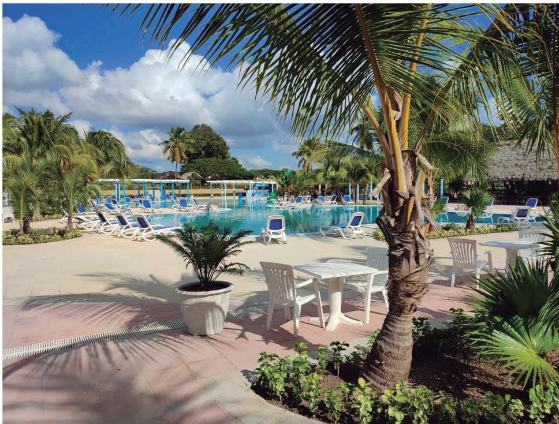
Áreas del Hotel Pasacaballo continuarán rehabilitándose durante el actual período.