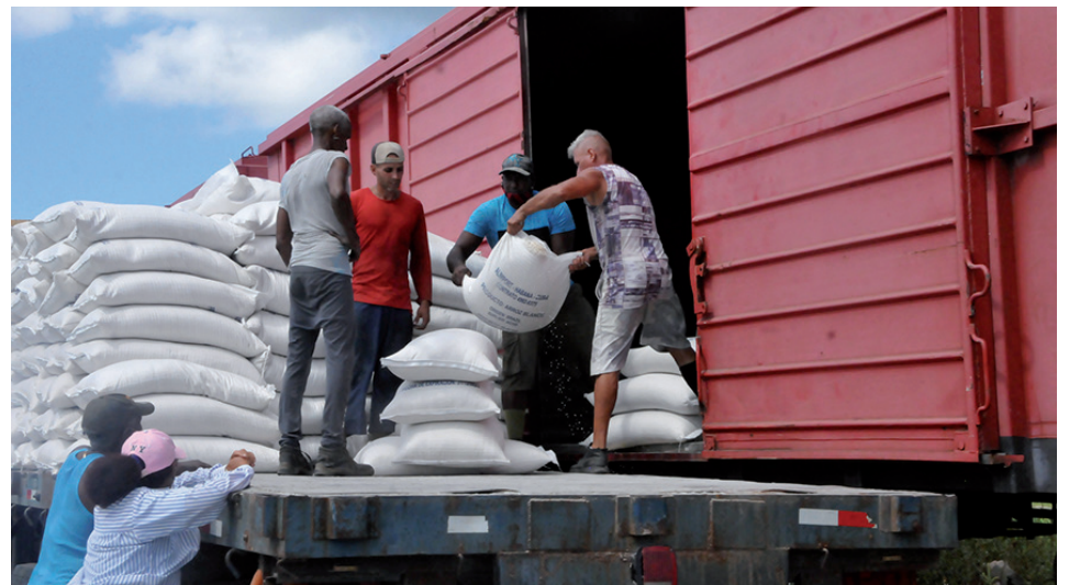
Centro de Carga y Descarga, otro punto vital en la rada cienfueguera.

Cienfuegos tiene el privilegio de disponer no solo de una de las bahías de bolsa más hermosas y útiles, sino de una rada que se cuenta entre las más importantes del país, junto a las de La Habana y Santiago de Cuba. Allí se respira trabajo y se desafían las adversidades.