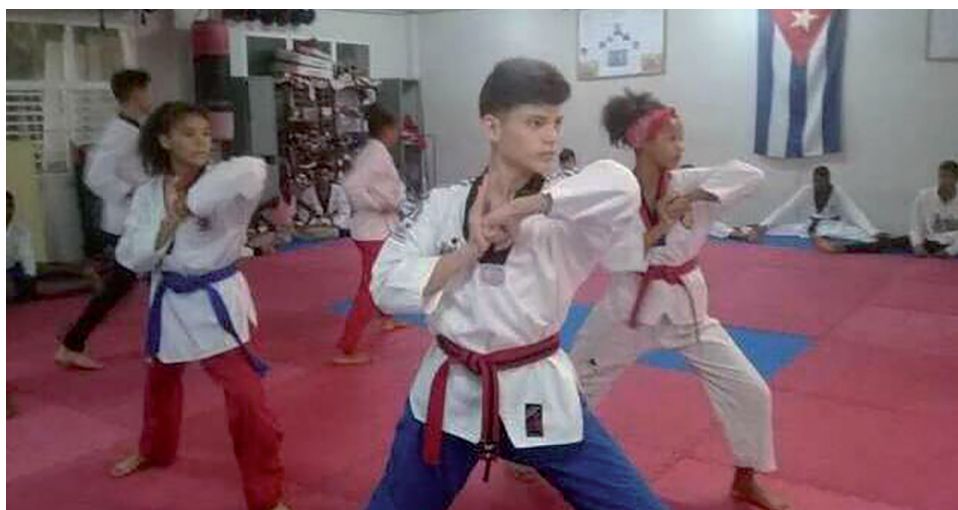
La matrícula en la Eide Provincial consta de 36 atletas, sumados escolares y juveniles.

Carlos E. Chaviano Hernández @carchavia74