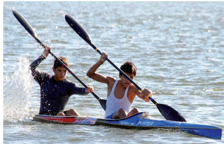
Matanzas dominó el canotaje pioneril. / Foto: Archivo

Remeros y badmintonistas concluyeron en el tercer puesto, al igual que el nado sincronizado. Los representantes de atletismo y gimnasia artística finalizaron cuartos; los de taekwondo en la quinta plaza; y el tenis de mesa terminaba en el sexto escalón. (C.E.CH.H.)