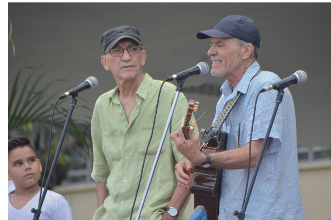
En el acto por el aniversario 43 del Hospital Provincial, el pasado 23 de marzo.

Entre las distinciones a Los Novos se encuentran Premio Especial en el Festival Cubadisco 2005; Orden Majadahonda 1936, en 2007; Premio Jagua y Premio del barrio, en 2009; Premio Alma Mater y los diplomas Amadeo Roldán y Nicolás Guillén, en 2012; La Flor de la Marilope, en 2017; Reconocimiento Especial de la Escuela Provincial de Arte Benny Moré; y Premio Especial en los Premios Lucas, en 2019. Sin embargo, sus mejores distinciones las han recibido del público y su pueblo. Al lado de sus seguidores han permanecido para rea-