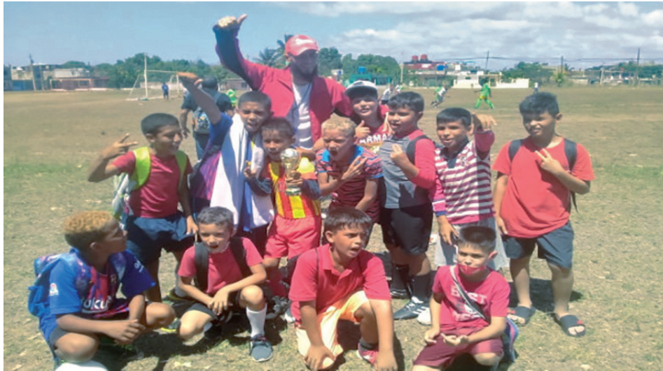
Caunao es el flamante campeón de la categoría 10-11 años.

de Reina y conquistaba la corona en cerrado compromiso de dos goles por uno.