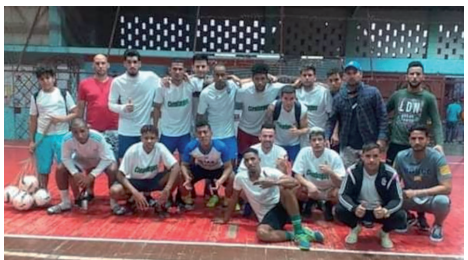
Equipo cienfueguero de futsal.

Sin poder efectuar su último compromiso de la etapa regular (otra vez la provincia no pudo asegurar el combustible para el traslado del equipo), Cienfuegos consiguió la