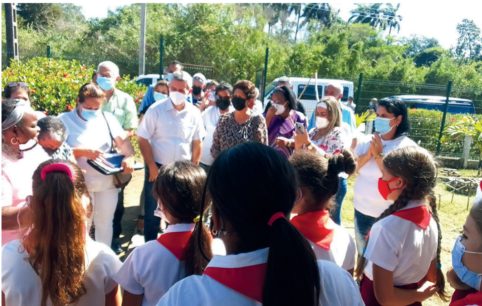
Jorge Luis Perdomo Di-Lella, viceprimer ministro, en la escuela primaria Carlos Caraballo.