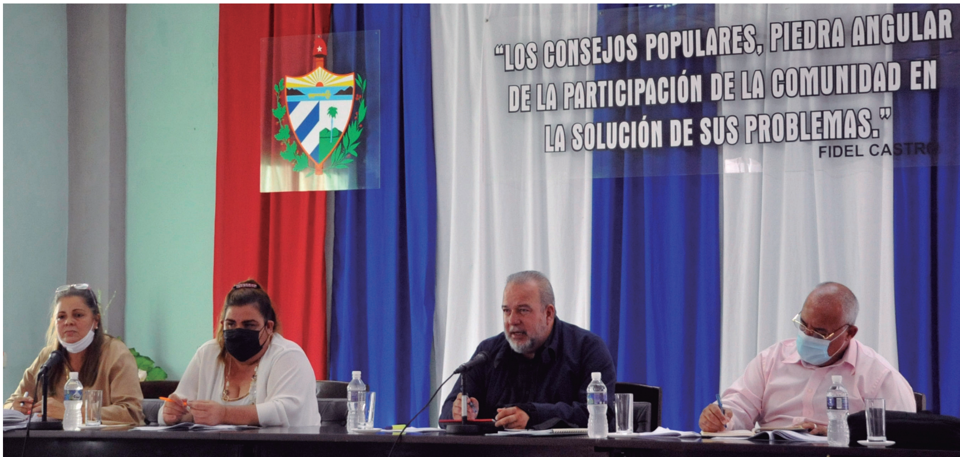
En el Consejo de la Administración de Aguada.