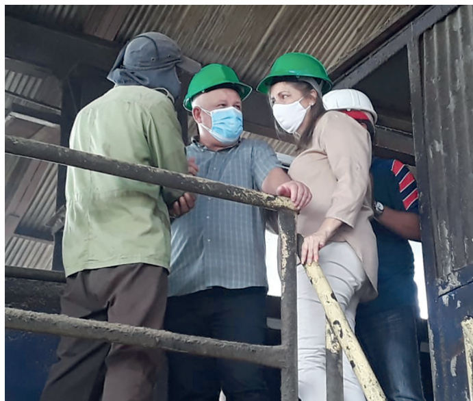
El viceprimer ministro Jorge Luis Tapia Fonseca en el ingenio azucarero Antonio Sánchez.

Las áreas claves y estratégicas definidas son: producción, diversificación y comercialización de alimentos; la salud pública, la construcción, y la vivienda.