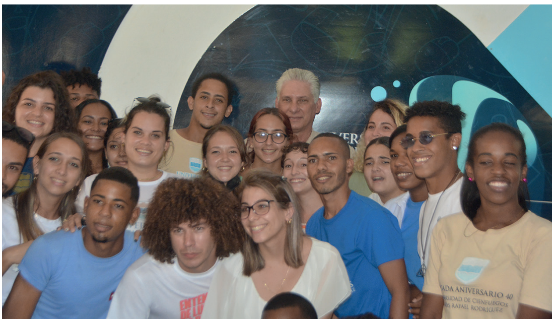
Díaz-Canel confraternizó con los estudiantes de la Universidad.

Díaz-Canel también visitó la fábrica de pienso líquido de la Empresa Porcina Cienfuegos, del mismo municipio palmireño. La producción de alimentos a partir de productos nacionales tiene que ser la base de la recuperación de este ganado, intrínseco a la cultura alimentaria del pueblo cubano, siempre ha indicado y defendido el Primer Secretario.