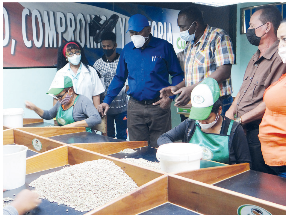
El Vicepresidente de la República conoce la situación de la Empresa Procesadora de Café, en Cumanayagua.

Indagó acerca del programa de la vivienda y la industria de materiales de la construcción, en tanto exhortó a de-