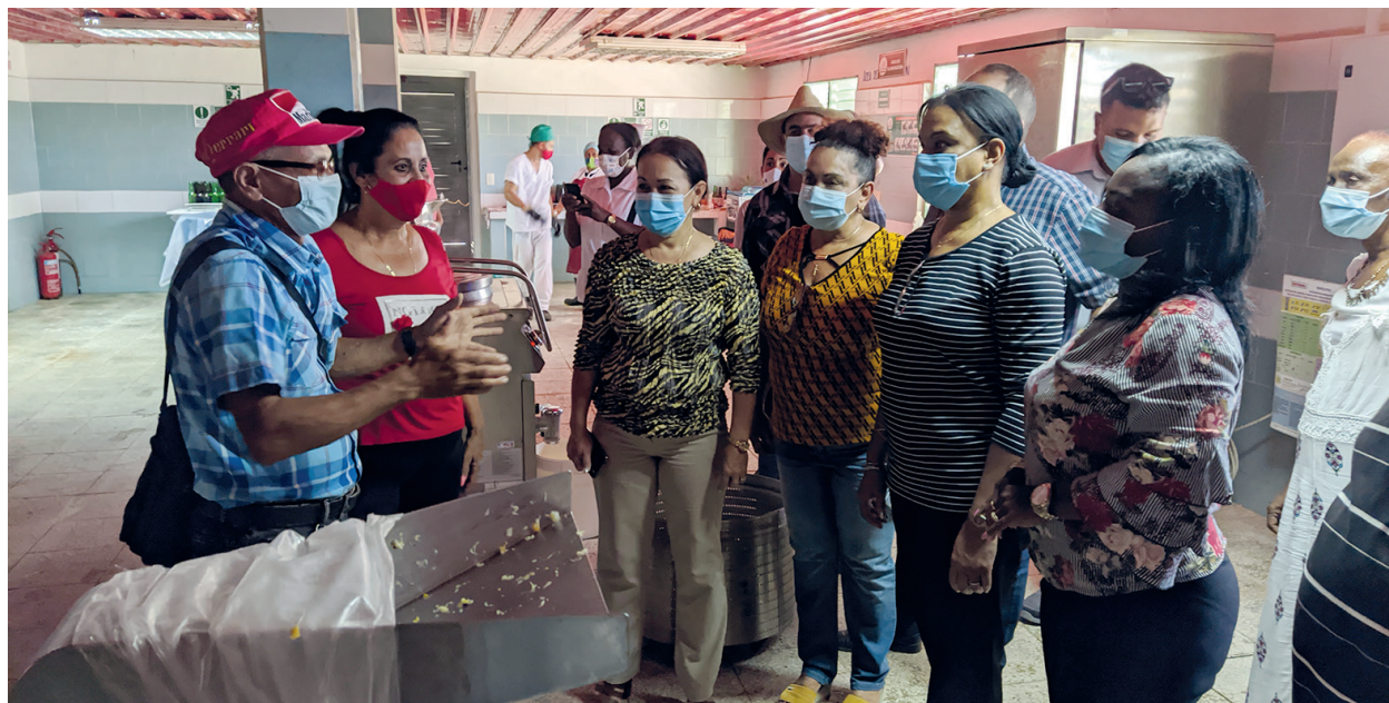
La minindustria La Constancia, de Abreus, visitada por la viceprimera ministra Inés María Chapman, sobresale dentro del municipio por la generación de utilidades y beneficios a sus trabajadores.