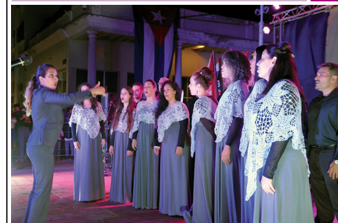
Los 60 del Coro Cantores de Cienfuegos