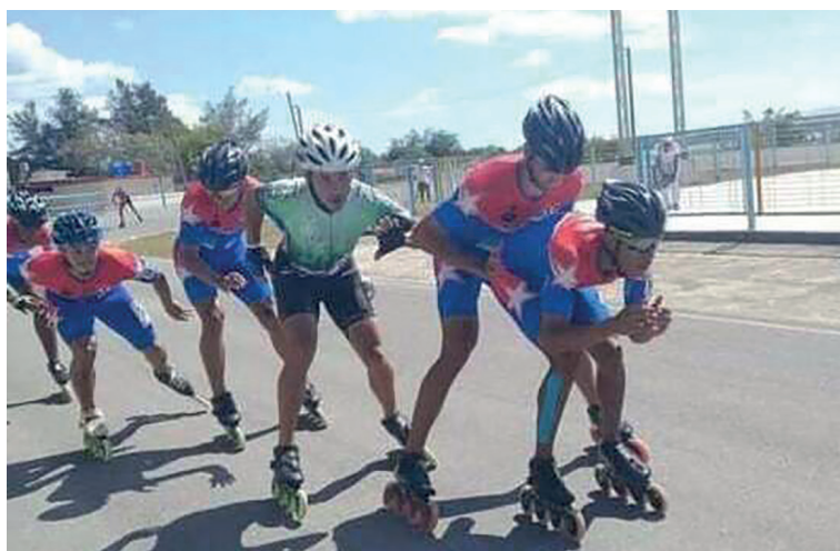
Cienfuegos con su mejor actuación en este tipo de certamen.