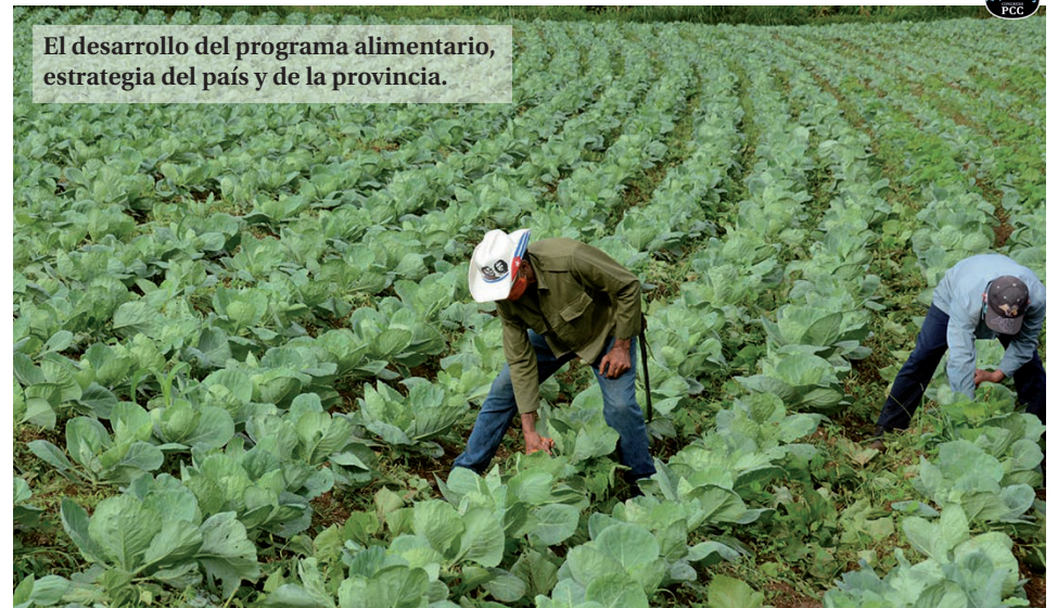
El desarrollo del programa alimentario, estrategia del país y de la provincia.

(31 759 ha), siendo bajos los rendimientos por cultivos.