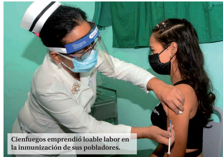
Cienfuegos emprendió loable labor en la inmunización de sus pobladores.

La batalla ideológica a librar en los escenarios actuales exige una utilización superior de los recursos humanos y tecnológicos puestos en nuestras manos para enfrentar y contrarrestar la subversión. No se trata de disponer de más recursos, sino del empleo racional de los que existen con el firme propósito de librar la lucha con efectividad, hacerlo con iniciativa, y participar con argu-