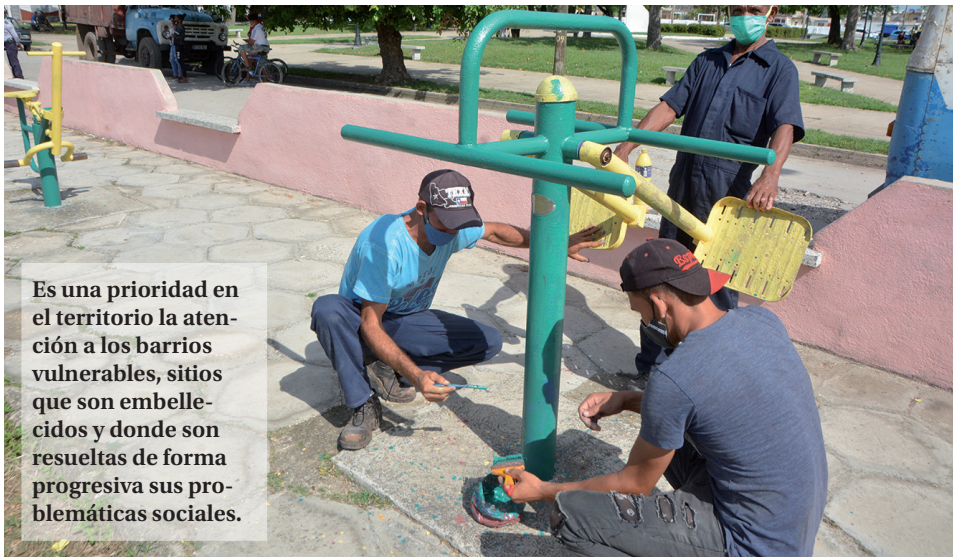
Es una prioridad en el territorio la atención a los barrios vulnerables, sitios que son embellecidos y donde son resueltas de forma progresiva sus problemáticas sociales.

reuniones ordinarias y otros espacios con los trabajadores.